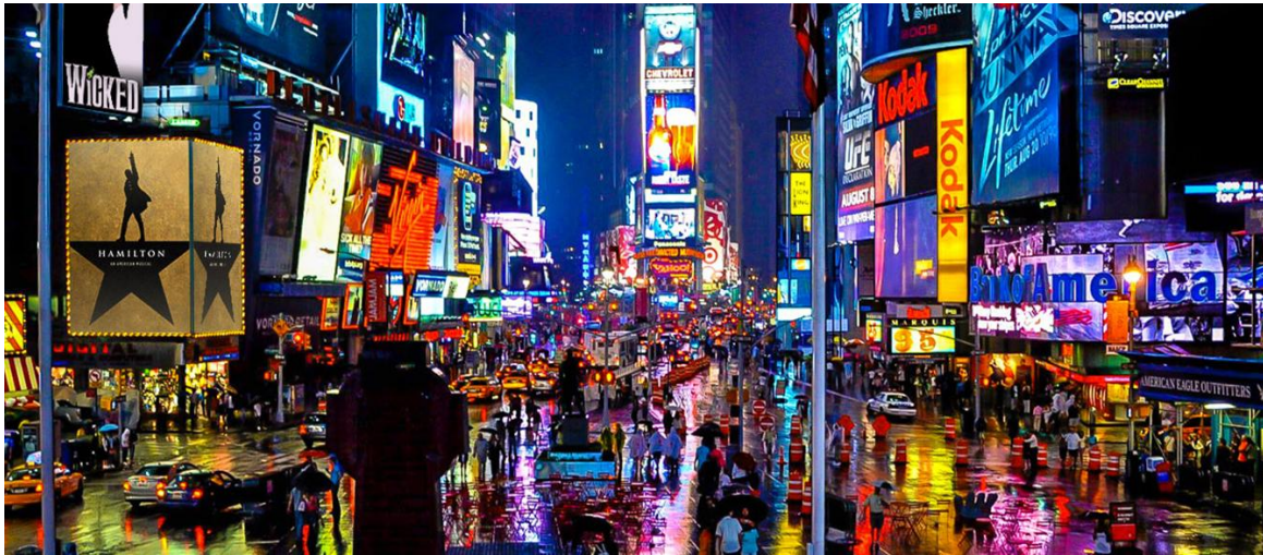
Resim 4. Broadway

1980 ve 1982 yılları arasında, Broadway'de üretim maliyetlerinde %62 gibi ciddi bir artış yaşanırken, işletme giderlerinde %45 oranında bir artış görülmüştür. Sektörde artan enflasyonla birlikte azalan seyirci sayısı, genel olarak dramalardan daha yüksek maliyetlerle sahneye konan müzikal oyunlarda, etkisini çok daha çarpıcı biçimde göstermiştir. 1982 yılında gişe hasılatlarında önceki yıla göre %13'lük bir düşüş yaşanmış, seyirci sayısı da %23'lük bir düşüşle 4 milyon kişide kalmıştır. 40 Broadway tiyatrosundan her biri gün geçtikçe karanlığa gömülmeye başlamıştır. Sadece milyonlarca dolar bütçeli Cats, A Chorus Line (1975'ten beri Broadway'de oynayamaktaydı), Nine ve Dreamgirls gibi müzikaller izleyici çekebiliyordu. Artan maliyetlere en büyük sebep olarak, sendika kuralları gösteriliyordu (Turan, 2009: 2).