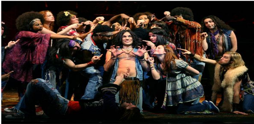
Resim 2. Hair Müzikali (1968)