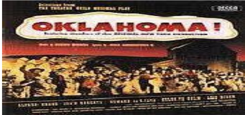
Resim 1. Oklahoma Müzikali (1943)

Müzikal tiyatronun altın çağının "Oklahoma!" (1943) ile başladığı ve "Hair" (1968) ile sona erdiği kabul edilir (Alpman, 2008: 12).