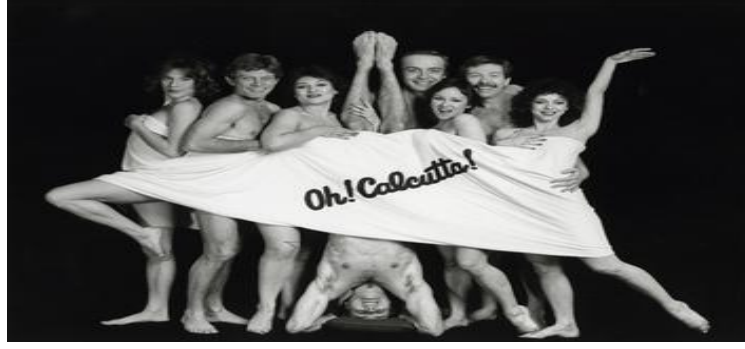
Resim 3. Oh Calcutta Müzikali