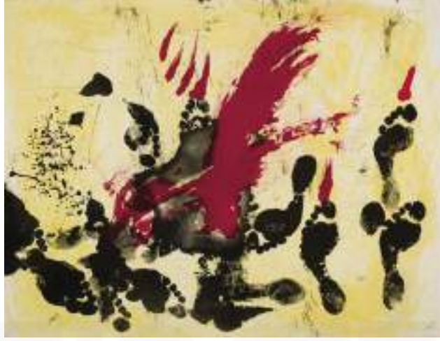
Görsel 12. Antoni Tàpies, “La Taca Vermella”, Guarro Kâğıdına Gravür ve Sulu Boya, 50x 40 1970.

İşaret ve sembollerin önemli olduğunu savunan Antoni Tàpies, soyut resim geleneğinde eserler üretmiştir. Sanat eseri üretim sürecinde deneye önem veren sanatçı, baskı, kolaj, grafiti gibi teknikleri birleştirdiği çalışmalar ortaya koymuştur. Çalışmalarında, farklı malzemeleri ve teknikleri birleştiren sanatçının kompozisyonlarında, baskılar, fırça darbeleri, tesadüfi çizikler, rastlantısal lekeler ve daha birçok deneysel teknik mevcuttur (URL-4).