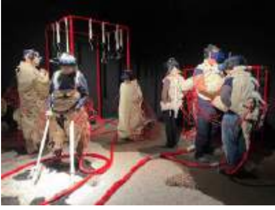
Görsel 3. Symbiosis I