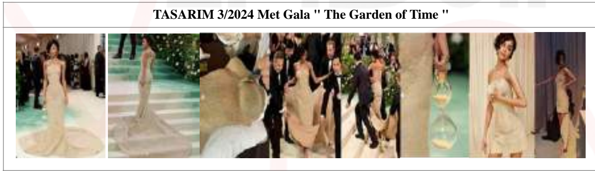
Görsel 6. Güney Afrikalı şarkıcı ve söz yazarı Tyla Laura Seethal (Tyla)’nın 2024 Met Galada giydiği Olivier Rousteing tasarımı kum elbise görselleri.

Görsel 6’da detaylı görüntüleri sunulan giysi tekstil dışı malzeme kullanılarak tasarlanan ve araştırma kapsamına dahil edileni Olivier Rousteing tarafından 2024 Met Gala’nın “The Garden of Time” (zamanın bahçesi) teması kapsamında, sunulmak amacıyla tasarlanmıştır. Giysi Güney Afrikalı şarkıcı ve söz yazarı Tyla Laura Seethal (Tyla) için 2024 Met Gala’nın “The Garden of Time” (zamanın bahçesi) teması kapsamında hazırlanan sergi ve gösteride sunması amacı ile özel olarak hazırlanmıştır. Tablo 3’de, Tyla Laura Seethal (Tyla) tarafından 2024 Met Gala sergi ve gösterilerinde sunulan tek parçalı kum, micro kristal çivi ve kumaş kullanılarak çalışılmış uzun ve kuyruklu giysinin model ve tasarım değeri analizi yapılmıştır.