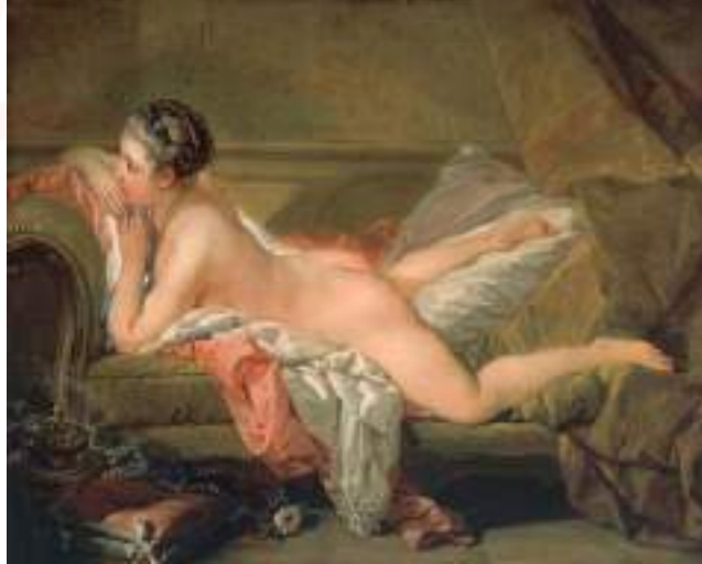
Görsel 6. François Boucher, “Sarışın Odalık”, Tuval Üzerine Yağlı Boya, 59x73 cm, 1752.

Kadın tasvirine yönelik bilinen en eski yapıtlardan biri olan “Willendorf Venüsü” (Görsel 5), Avusturya’nın eski taş çağına ait en ünlü kalıntısıdır. MÖ 25.000 yıllarına ait olan bu heykel, 7 Ağustos 1908 yılında Willendorf’da yapılan bir demiryolu inşaatı sırasında ortaya çıkmıştır (URL-2). Yaklaşık 11 cm uzunluğunda olan heykel, iri göğüsleri ve geniş kalçası ile dikkat çekmektedir. Kadın bedeninin cinsel organlarının vurgulanarak tasvir edilmesi, doğurganlığı temsil etmektedir. Bir anlamda o dönemde toplumun kadına olan bakış açısını aktaran bir yapıttır.