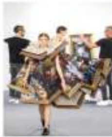
Görsel 2. Victor&Rolf 2015/Sonbahar-Kış Haute Couture koleksiyonu