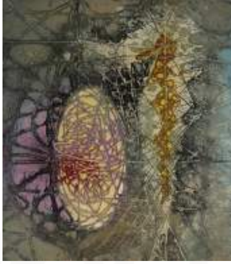
Görsel 5. Krishna Reddy “İki Form Birden”, Viskozite, 1957.

Krishna Reddy, Atölye 17'nin çalışmalarına katılarak, atölyenin deneye dayalı, yeni arayışları destekleyen üslubunu benimsemiştir. “İki Form Birden” adlı çalışmada tek kalıpla çok renkli baskı anlayışının uygulandığı, bir metal plaka üzerine, çeşitli sıvılıktaki yağlardan oluşan mürekkepler, sert ve yumuşak merdanelerin kullanımıyla gerçekleştirilen ve Reddy tarafından geliştirilen bir yöntemle baskı yapılmıştır (Farrel, 2016: 1).