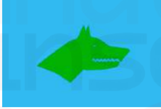
Görsel 6. Göktürk Bayrağında Kurt Başı. "Göktürk Kağanlığı Bayrağı".

Türk kültüründe "Kurt-Bozkurt" figürüne çok sık rastlanılmaktadır. Türk türeyiş destanları arasında yer edinen kurt figürü, Türklerin milli simgesi olarak görülmüştür. Ulu, ata gibi anlamları çağrıştıran bu sembol, Türk mitolojisinde yol gösterici bir semboldür. Kurtla ilgili olarak zamanla gelişen hayvan-ata kavramı devlet, hükümdarlık vb. unsurların simgesi olmuş; gök ve yer unsurlarıyla ilgili birçok anlam kazanmıştır (Çoruhlu, 2002). Bozkurt figürü, Göktürk destanlarında hem yol gösterici olarak hem de türeme sembolü olarak nitelendirilmiştir.