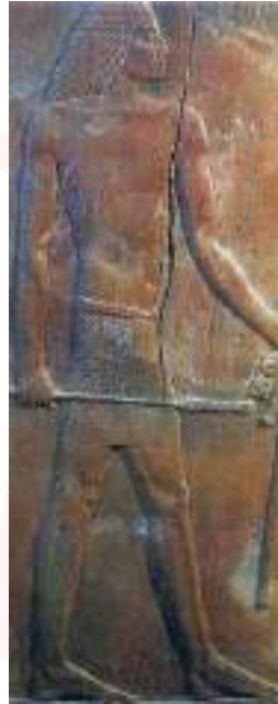
Görsel 2. Hesire’nin Portresi, Ahşap, Yükseklik. 115 cm, MÖ 2778-2723, Mısır Müzesi, Kahire