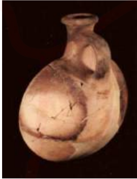
Görsel 3. Hitit Çağı, Masat Höyük, Anadolu Medeniyetler Müzesi 28,4 X 21,8 X 10,6 cm

Yuvarlak ağızlı, uzun boyunlu, mercimek gövdeli ve üç kulpludur. Çarkta şekillendirilmiş olup sonradan restore edilmiştir. Krem renk astarlı ve çarkta yapılmış gövdenin her iki tarafında kahverengi boya ile belirtilmiş, tek merkezli dairelerle bezenmiştir.