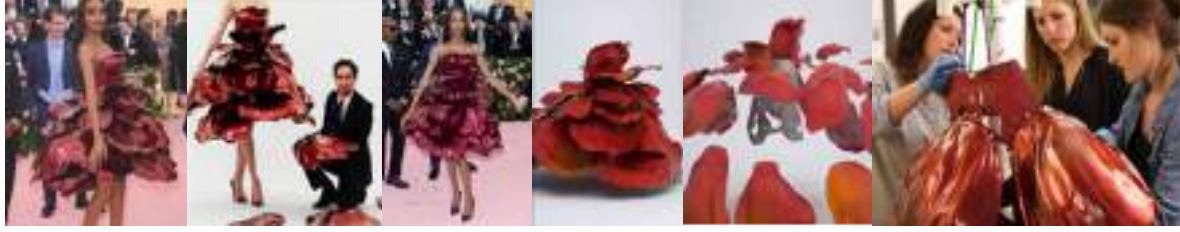
Görsel 7. Jordan Dunn'un 2019 Met Galada giydiği Zac Posen tasarımı petrol türevi elbise görselleri.

Görsel 7'de detaylı görüntüleri sunulan giysi tekstil dışı malzeme kullanılarak tasarlanan ve araştırma kapsamına dahil edileni Zac Posen tarafından model Jourdan Dunn için 2019 Met Gala'nın "Camp: Notes on Fashion" (kamp: moda üzerine notlar) teması kapsamında, sunulmak amacıyla tasarlanmıştır. Tablo 4'de, Zac Posen tarafından, Jourdan Dunn tarafından 2019 Met Gala sergi ve gösterilerinde sunulması için tasarlanan tek parçalı giysinin model ve tasarım değeri analizi yapılmıştır.