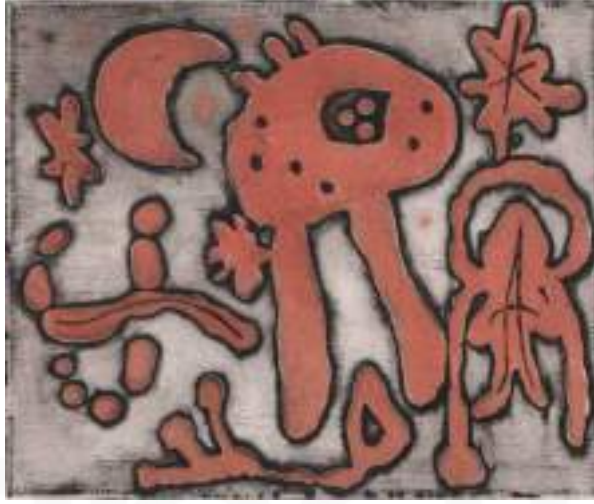
Görsel 9. Joan Miro, “Joan Miro'nun Baskıları İçin”, Auvergne Kağıdına Renkli Gravür ve Açık Isırık Kazıma, 12x14 cm, 1947.

Soyut sanat ve figüratif sanat arasında köprü olarak görülen Joan Miro, baskiresmin tüm tekniklerinde işler üretmiştir. Her türlü malzemeyi kullanarak eserler ürettiği dönemde Miro, Atölye 17'nin gravür çalışmalarına katılmıştır. Sanatçı işaretler, simge ve semboller, lekeler ve boşluklardan yararlanarak, tek bir renk ile yaratıcı kompozisyonlar oluşturmuştur (URL-3).