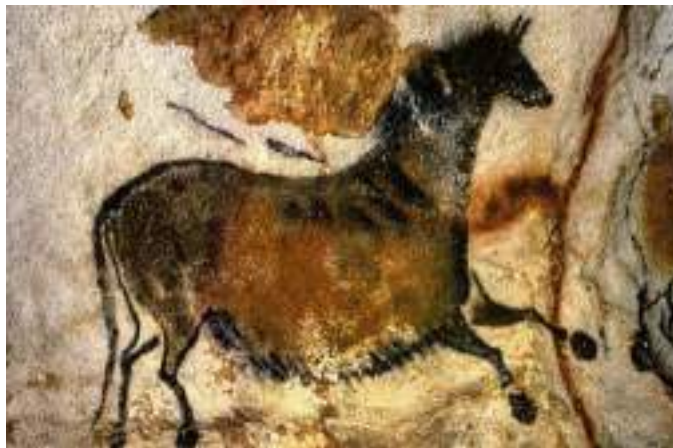
Görsel 1. Okla Vurulan Yabani At, Mağara Duvarı Resmi, Yaklaşık İÖ 1500, Lascaux Mağarası, Doraogne.

Sanatın işlevi, görevi, amacı ve sanattaki birtakım temsil biçimleri; insanlığın gelişmesine bağlı olarak değişerek günümüze ulaşmıştır. Sanat tarihine bakıldığında bu değişim ve farklılıkların göz önünde olduğu görülmektedir. Nitekim günümüze kadar farklı dönemlerde birçok farklı sanat akımının ortaya çıktığı görülmektedir. Sanatın geçirdiği bu dönüşümden beden tasvirlerinin temsili de etkilenmiştir. Resimde beden tasvirinin tarihi de yine sanat kadar eskidir.