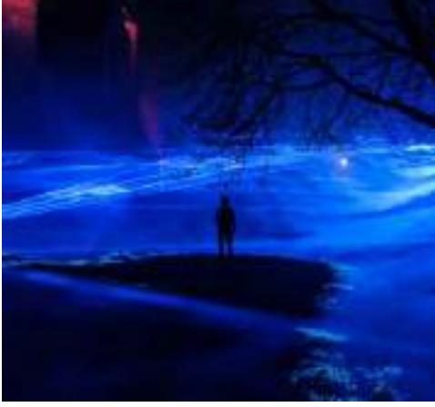
Görsel 1. Waterlicht I