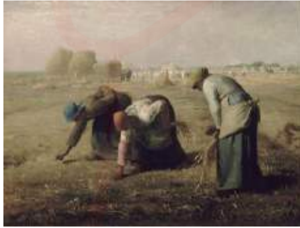
Görsel 3. Jean-François Millet, "Başak Toplayan Kadınlar", TÜYB, 1857, 84x111 cm, Orsay Müzesi.

Sanatta beden tasvirine yönelik ideal oranları yansıtırma anlayışı uzun yıllar devam etmiştir. Sanatçılar, uzun yıllar doğayı görmek istediği gibi betimlemiş hatta kendi duygularını da katarak doğayı olduğundan çok daha farklı ve idealize bir şekilde betimlemiştir. Özellikle romantizme kadar bu anlayış belirgin olmuştur ancak bu anlayışa en keskin tepki, gerçekçilik akımı ile beraber gerçekleşmiştir. Gerçekçilik akımı, toplumsal sınıfların iyice belirginleştiği 19. yy'da ortaya çıkmış olup idealizme bir tepki oluşturmuştur. Sanatçılar günlük ve sıradan olan, hayatın gerçeklerini sanata dâhil etmiş, teatral dramadan ve klasik sanat formlarından uzak durma eğiliminde olmuşlardır. Sıradan insanlar olarak tanımlanan köylü, işçi ve emekçi kesim, tüm gerçekçi yönüyle ele alınmıştır (URL-1) Resimde tasvir edilen işçi sınıfının bedenleri tasvir edilirken ideal bir güzellik oluşturma kaygısından ziyade olduğu gibi betimlenmiştir.