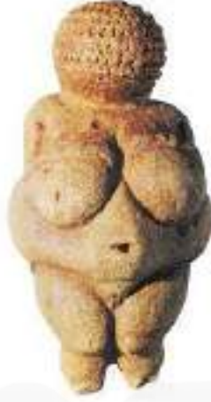
Görsel 5. “Willendorf Venüsü”, Viyana Doğa Tarihi Müzesi, Viyana, Avusturya

Kadın tasvirine yönelik bilinen en eski yapıtlardan biri olan “Willendorf Venüsü” (Görsel 5), Avusturya’nın eski taş çağına ait en ünlü kalıntısıdır. MÖ 25.000 yıllarına ait olan bu heykel, 7 Ağustos 1908 yılında Willendorf’da yapılan bir demiryolu inşaatı sırasında ortaya çıkmıştır (URL-2). Yaklaşık 11 cm uzunluğunda olan heykel, iri göğüsleri ve geniş kalçası ile dikkat çekmektedir. Kadın bedeninin cinsel organlarının vurgulanarak tasvir edilmesi, doğurganlığı temsil etmektedir. Bir anlamda o dönemde toplumun kadına olan bakış açısını aktaran bir yapıttır.