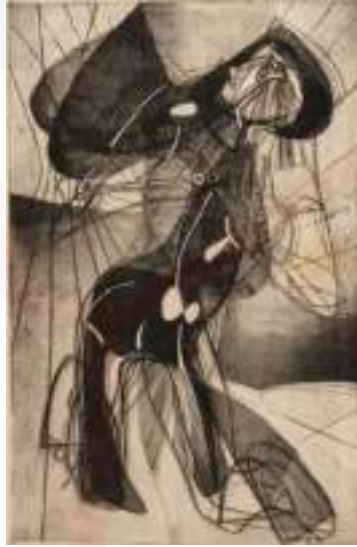
Görsel 4. Stanley William Hayter, “Amazon”, Yumuşak Vernik ve Islak Kazı Tekniği İle Çizgisel Doğaçlama, 1945.

Hayter, renk, leke, doku, şekil gibi unsurları çalışmalarında temel öge olarak kullanmış ve bu unsurları geleneksel bakış açısının dışında yorumlayarak kompozisyona yerleştirmiştir. Hayter’in geleneksel kuralların dışına çıktığı ve basmakalıp fikirlerin dışında hareket ederek uygulamalar yaptığı, neredeyse tüm çalışmalarında görülmektedir. Nitekim Hayter, belirli bir duygu ya da düşünceyi ifade etmek ya da belirgin bir his uyandırmak için rengin sezgisel olarak kullanılması gerektiğini savunmuştur (Tüzün, 2019: 730).