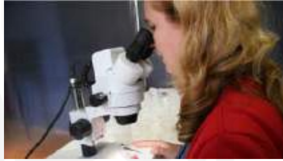
Görsel 6. Nature? II

“Modern biyoloji ve biyoteknoloji, yeni bir ortam kullanarak sanat yaratma fırsatı sunuyor. Yeni bir sanat biçiminin doğuşuna tanık oluyoruz: Laboratuvarları sanat stüdyoları olarak kullanarak test tüplerinde yaratılan sanat.” (de Menezes, 2007, s. 215). Modern biyoloji laboratuvarlarının sunduğu olanakları sanat ortamı olarak değerlendiren Menezes’in sanat ve bilim kesişiminde ürettiği eserlerden bazıları şunlardır: İşlevsel manyetik rezonans görüntüleme (fMRI) teknolojisini kullanarak beyin aktivitelerinin görsellerinden yararlandığı Functional Portraits, floresan boyalarla birleştirilmiş DNA molekülleri ile insan hücrelerinin çekirdeklerindeki kromozomları boyayarak mikro heykeller oluşturduğu NucleArt, cam tüplere koyduğu nöronlarla canlı heykeller ürettiği Tree of Knowledge.