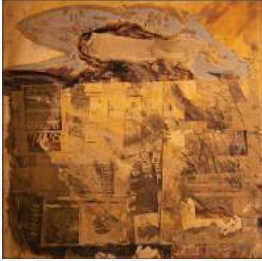
Görsel 14. Robert Rauschenberg, “Foto Finish”, Bronz Üzerine Kararma Ve Serigrafi Mürekkebi, 122 x 122 cm, 1990.

Eklektik bir sanat anlayışına sahip olan Robert Rauschenberg, çok çeşitli ve farklı teknikleri bir arada kullanarak resimlerini oluşturmaktadır. Çalışmalarında deneyselliği ön planda tutan sanatçı, serigrafi baskıyla pirinç, bakır, bronz levhaları birleştirmiş ve bir takım kimyasal tepkimeler sonucu oluşan etkilerden plastik anlamda yararlanmıştır. Bununla birlikte yaptığı çalışmalara, matbaa boyası ve akrilik gibi farklı kimyasal alt yapıya sahip boyaları birleştirerek renksel çeşitlilikler elde etmeye çalışmıştır. Bununla birlikte fotoğrafçılık, serigrafi, resim ve deneyselliği birleştirdiği çok sayıda çalışmalara imza atmıştır. Rauschenberg bir röportajında: “Bir gazetenin metnini, bir fotoğrafın ayrıntısını, bir beyzbol topunun dikişini ve bir ampulün içindeki filamanı, fırça darbesi veya boya damlaması kadar resim için temel olarak görüyorum.” ifadelerini kullanmıştır (Sülün, 2021: 16).