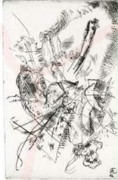
Görsel 8. Wassily Kandinsky, “Ísimsiz”, Gravür, 1931.

Atölye 17'nin çalışmalarına katılan Yves Tanguy, şiirselliğin, sır ve gizemin ön planda olduğu işlerini bu dönemde yapmıştır. Çok sayıda gravür çalışması yapan sanatçı, genellikle çalışmalarında tek plaka üzerinde çok renkli baskı uygulamalarına yönelik, deneysel arařtırmalarda bulunmuştur. Atölye 17'de bir dönem oldukça yoğun çalışılan şiir ve baskı dizisinin ürünlerinden olan çalışmalarında, soyut yorumlamalar yapmıştır (URL-2).