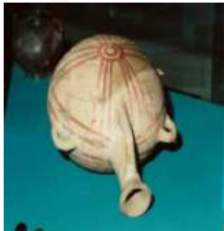
Görsel 1. Eski Hitit Çağı, Alaca Höyük, Anadolu Medeniyetler Müzesi 37 X 28,6 X 24,2 cm

Matara formlarındaki evrimsel değişim, bu dönemin teknik ve işlevsel yeniliklerini açıkça yansıtır. Başlangıçta küresel bir gövdeye sahip olan mataralar, zamanla yassılaşıp mercimek biçimine dönüşmüş; daha sonra ise hacmi artırmak ve zemine yatırıldığında sıvının dökülmesini önlemek amacıyla asimetric gövdeli ve eğimli boyunlu bir forma kavuşmuştur. Bu biçim hem taşınma kolaylığı hem de kullanışlılık açısından taşıyıcının bedenine uyum sağlayacak şekilde geliştirilmiştir. Ayrıca, teknik özellikler incelendiğinde mataraların üretiminde kullanılan çamurun kum katkılı olduğu ve yüzeylerinin Geç Neolitik dönemden itibaren perdahlanarak parlak bir görünüm kazandığı görülmektedir.