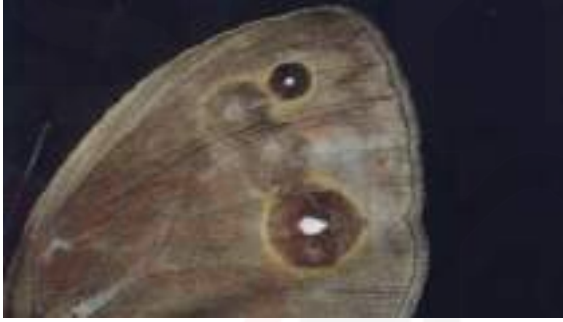
Görsel 5. Nature? I

Bununla birlikte, Nature? çalışması doğayı üretim sürecine dâhil ederken, doğayı aynı zamanda estetik bir malzemeye dönüştürmektedir. Bu durum, doğaya ait olanın sanatsal bağlama taşınırken yeniden insan merkezli bir anlamlandırma sürecine tabi tutulduğu izlenimini yaratmaktadır. Çalışma, insan ve doğa arasındaki hiyerarşiyi sorgulasa da, bu hiyerarşiyi tamamen ortadan kaldırmakta zorlanır. Dolayısıyla Nature? adlı çalışma, transdisipliner sanatın etik sınırlarına ilişkin önemli bir tartışma alanı açmaktadır: doğayla iş birliği yapmak mı, yoksa onu yeniden biçimlendirmek mi?