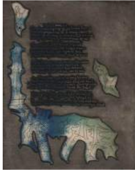
Görsel 7. Yves Tanguy, “Ízole Kemiklerin İnce Onuru”, Gravür, Asitle Oyma Baskı ve Sulu Boya, 1947.

Atölye 17'nin çalışmalarına katılan Yves Tanguy, şiirselliğin, sır ve gizemin ön planda olduğu işlerini bu dönemde yapmıştır. Çok sayıda gravür çalışması yapan sanatçı, genellikle çalışmalarında tek plaka üzerinde çok renkli baskı uygulamalarına yönelik, deneysel arařtırmalarda bulunmuştur. Atölye 17'de bir dönem oldukça yoğun çalışılan şiir ve baskı dizisinin ürünlerinden olan çalışmalarında, soyut yorumlamalar yapmıştır (URL-2).