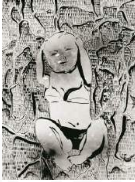
Görsel 7. İnci Eviner, “Bebek Kadın”, Kâğıt Üzerine Mürekkep ve Kolaj, 153x113 cm, 2005.

Sanatçının “Bebek Kadın” adlı çalışmasında isminden de anlaşıldığı üzere bebek ve kadın figürüne ait imgelerin bir aradalığı söz konusudur. Bedenin ayaklarının anatomisi ve duruşu, küçük bir bebek izlenimi vermektedir. Ayrıca kafası ve kolları da bir bebeğin anatomisine uygun düşecek şekilde betimlenmiştir. Ancak figürün gövdesi yetişkin bir kadın giysisi olan sutyenle kaplıdır ve sanatçı sutyenin altından kadın göğsünü de betimlemeyi ihmal etmemiştir. Yani bu yetişkin kadın çamaşırı, bir bebeğin üzerinde öylesine var olan bir çamaşır değildir. Ancak norm dışı bir görünüm olarak bebek ve yetişkin kadın bedeni bir arada betimlenmiştir.