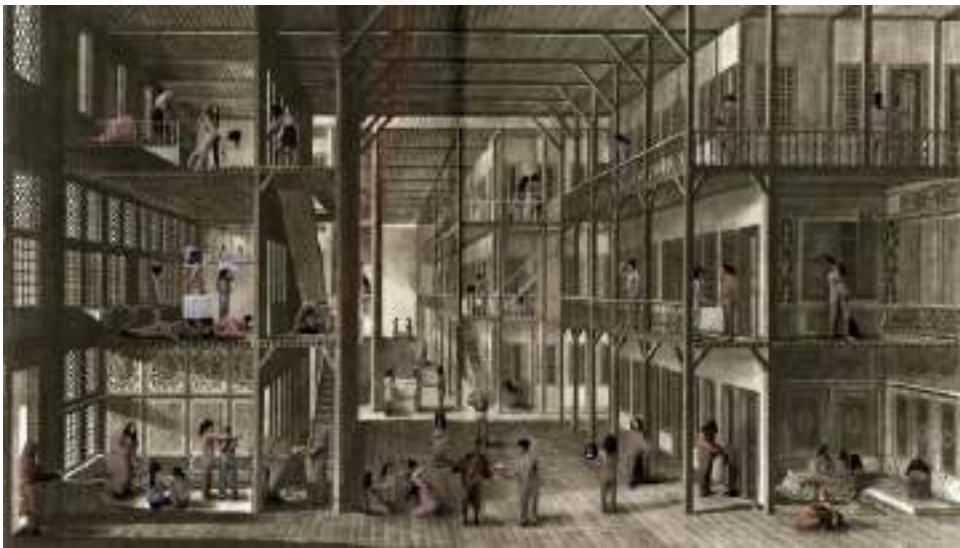
Görsel 8. İnci Eviner, “Harem”, Hareketli Görüntüden Bir Kare, 2009.

Sanatçının bu çalışmasına bakıldığında sosyolojik bir anlam çıkarmak mümkündür. Araştırmacının fikrine göre sanatçı, bu figür ile kadına yönelik yapılan toplumsal cinsiyetçilik kavramını sorgulamıştır. Kadına toplum tarafından biçilen bir takım görev, algı, bakış açısı ve yönelimlerin doğumdan itibaren yüklendiğini anlatan bir tema gibi durmaktadır. Bu anlamda araştırmacıya göre bu eser, kadın olmanın bir takım sorumluluklarının ta ki bebeklikten itibaren kendisine yüklenen bir misyon olduğunu anlatan bir eserdir.