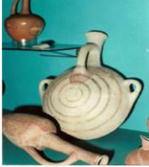
Görsel 2. Eski Hitit Çağı, Eski yapar, Anadolu Medeniyetler Müzesi 47,3 X 40 X 28,5 cm

Yuvarlak ağızlı uzun boyunlu ve mercimek gövdelidir. 3 kulplu olup, boyundan gövdeye 1, omuzlar üzerinde 2 kulpu vardır. Çarkta yapılmıştır. Krem renk astarlı ve perdahlıdır. Gövdenin her iki tarafında da tek merkezli dairelerle bezenmiştir. Daireler 5 adet üçlü bantla birbirine bağlanmıştır.