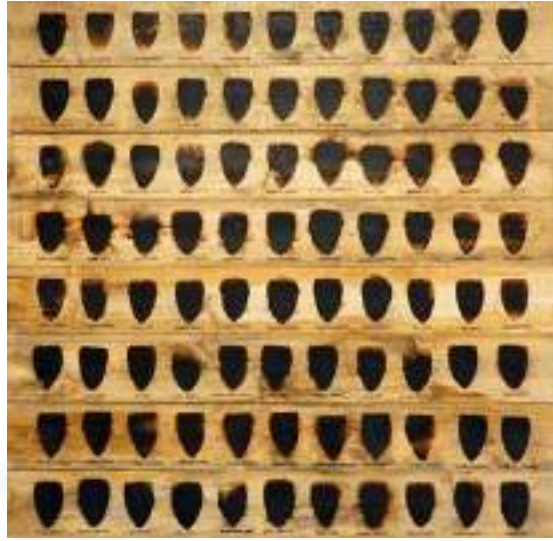
Görsel 16. Willie Cole, “Adımı Söyle”, Ahşap Üzerinde Demir Yanıkları, Siyah Kalem, Sekiz Adet Üst Üste Konulmuş Eleman, 244 x 239 cm, 2020.

Heykeltıraş ve baskı sanatçısı olan Willie Cole, ütü gibi tüketici nesnelerini ele aldığı ironik deneysel baskiresim çalışmaları yapmıştır. Cole, kâğıt, kumaş, tuval, ahşap ve daha birçok malzeme üzerine, ütüyü ısıtıp basarak bir yanık oluşturmuş ve bunu sanat malzemesi olarak kullanmıştır. Sanatçı bu çalışmalara kalemle, fırçayla ya da heykellerle müdahalelerde bulunsa da, aslında yanık izinin oluşturduğu tesadüfi oluşumlar, ütü tabanındaki delik izleri ya da baskı yaptığı yüzeyde oluşan değişimlerden plastik anlamda yararlanmıştır. Bununla birlikte sanatçının hazır bir malzemeyi baskı kalıbı gibi kullanması da oldukça yaratıcıdır (Kılıç, 2022: 87).