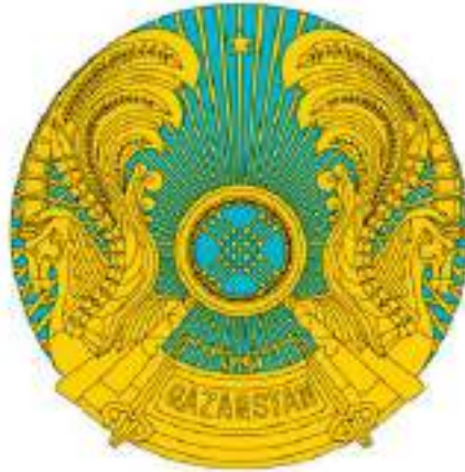
Görsel 11. Tulpar Figürlü Arma. “Kazakistan Devlet Arması”.