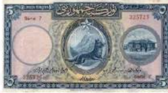
Görsel 8. Cumhuriyet Dönemi İlk Kâğıt Parası.

Türk Metal Sendikasına ait logo dişli çark biçiminde tasarlanarak biçimsel olarak kırmızı arka plan üzerinde ay yıldız ve bunun içinde merkezi noktada yerleştirilen kurt figürü bulunmaktadır. Kırmızı arka planla bütünleşen ay yıldız, anlamsal yönden ilk bakışta Türk bayrağını temsil ettiği anlaşıldığı gibi, hilal sembolünün içine konumlandırılan kurt sembolü de Türklük kavramıyla doğrudan ilişkilendirilmiştir. Bağlamsal açıdan değerlendirildiğinde, bu işçi sendikasına ait logoda temsili olarak fabrika sembolü ve metal sektörünü ifade eden dişli çark kullanılmıştır. Ancak bu unsurlar kadar merkezi bir konumda yer alan ay-yıldız ve kurt sembolleri, Türklük vurgusunu ve sendikanın benimsediği ideolojik ilke ve değerleri temsil etmektedir.