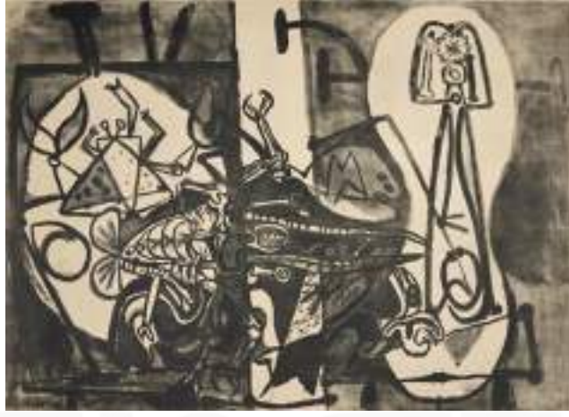
Görsel 10. Pablo Picasso, “İstakozlar ve Balıklar”, Arches Dokuma Kâğıdı Üzerine Taş Baskı, 79x110 cm, 1949.

Geleneksel baskı tekniklerinden sonra deneysel baskıresme yönelen Picasso, bir takım reçeteleri, kimyasal tarifleri gravüre uygulayarak, çeşitli araştırma ve denemeleri neticesinde farklı buluşlar, dokular elde etmiştir. Picasso, linol üzerine gravür, ağaç tabaka üzerine gravür gibi denemelerle farklı doku ve plastik zenginlik arayışlarıyla uğraşmıştır. Tüm bunlar ışığında Picasso için, deneyselliğin mutfağında yer alan, sadece uygulayıcısı değil aynı zamanda da üreticisi konumunda olan, bir yenilikçi yorumu yapılabilir (Gombrich, 2007: 576).