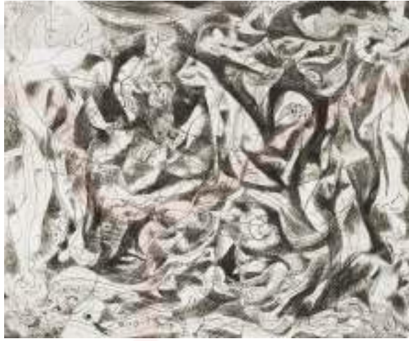
Görsel 11. Jackson Pollock, “İsimsiz 4”, 1945.

Geleneksel baskı tekniklerinden sonra deneysel baskıresme yönelen Picasso, bir takım reçeteleri, kimyasal tarifleri gravüre uygulayarak, çeşitli araştırma ve denemeleri neticesinde farklı buluşlar, dokular elde etmiştir. Picasso, linol üzerine gravür, ağaç tabaka üzerine gravür gibi denemelerle farklı doku ve plastik zenginlik arayışlarıyla uğraşmıştır. Tüm bunlar ışığında Picasso için, deneyselliğin mutfağında yer alan, sadece uygulayıcısı değil aynı zamanda da üreticisi konumunda olan, bir yenilikçi yorumu yapılabilir (Gombrich, 2007: 576).