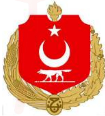
Görsel 9. “Namık İsmail'in 1925'te Tasarladığı Türkiye Arması”.

Cumhuriyet'in ilk dönemlerinde kullanılan bu kâğıt paralar, Mustafa Kemal Atatürk'ün emriyle basılmıştır. Bu kâğıt paralarda çeşitli önemli semboller kullanılmıştır. Sırasıyla; 1 Türk lirasında I. TBMM Binası, Ankara kalesi, eski Başbakanlık Binası ve bir köylü temsili bulunmaktadır. 5 Türk lirasında kurt sembolü, I. TBMM Binası ve Yenimahalle'de bulunan Akköprü yer almaktadır. 10 Türk lirasında kurt sembol ve Ankara Kalesi yer alır. 100 Türk lirasında Atatürk portesi ve Anadolu'dan bir köy temsili vardır. Son olarak 500 lirada ise Sivas Gök medrese ve Sivas görsellerine yer verilmiştir. Tasarımlarda kurt figürüne iki ayrı banknotta yer verilmesi bu sembolün önemini göstermektedir. Bu sembolün Cumhuriyet'in ilk dönem paralarında iki ayrı banknotta yer alması, bağlamsal ve anlamsal açıdan figürün Türkcülük ve millî kimlik inşasıyla ilişkilendirilebilmektedir.