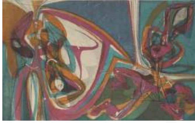
Görsel 3. Stanley William Hayter, “Beş Kişilikler”, Gravür ve Yumuşak Zeminli Gravür; Şablonlarla Eş Zamanlı Renkli Baskı, 37x 61 cm, 1946.

Hayter, renk, leke, doku, şekil gibi unsurları çalışmalarında temel öge olarak kullanmış ve bu unsurları geleneksel bakış açısının dışında yorumlayarak kompozisyona yerleştirmiştir. Hayter’in geleneksel kuralların dışına çıktığı ve basmakalıp fikirlerin dışında hareket ederek uygulamalar yaptığı, neredeyse tüm çalışmalarında görülmektedir. Nitekim Hayter, belirli bir duygu ya da düşünceyi ifade etmek ya da belirgin bir his uyandırmak için rengin sezgisel olarak kullanılması gerektiğini savunmuştur (Tüzün, 2019: 730).