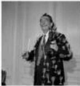
Görsel 1. Salvador Dalí "Aptrodisiac Jacket" 1936.