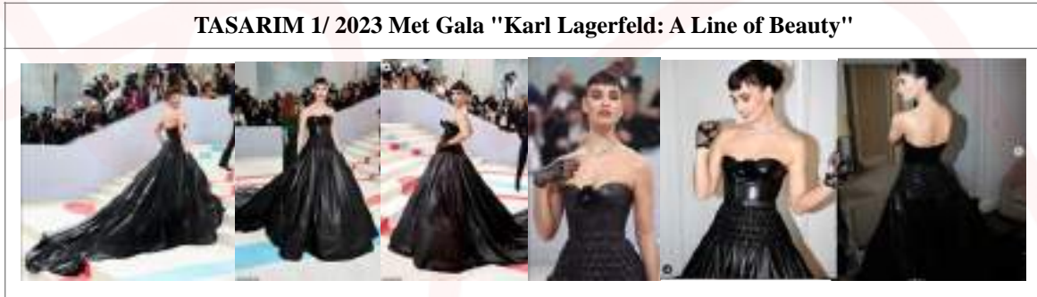
Görsel 4. Lily James'in 2023 Met Galada giydiği Tamara Ralph tasarımı deri elbise görselleri.

Tablo 1'de; kısa tanımlarla Giysi, 2023 Met Gala'nın "Karl Lagerfeld: A Line of Beauty" teması çerçevesinde Tamara Ralph tarafından İngiliz oyuncu Lily James için hazırlanmıştır. " Karl Lagerfeld: A Line of Beauty " (Karl Lagerfeld: Bir Güzellik Çizgisi) teması ile Karl Lagerfeld'in onuruna düzenlenen 2023 Met Gala sergi ve gösterilerinde sunulan ve Tasarımcı Tamara Ralph tarafından tasarlanan, Lily James tarafından sunulan deriden hazırlanan uzun kuyruklu elbisenin giysi model ve tasarım değeri analizi yapılmıştır.