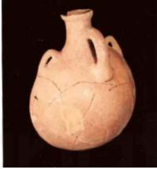
Görsel 4. Hitit İmparatorluk Çağı, Masat Höyük, Anadolu Medeniyetler Müzesi 33,6 X 24,6 X 16,2 cm

Yuvarlak ağızlı, uzun boyunlu, üç kulplu matara; boyundan gövdeye omuzlar üzerinde iki kulpu bulunmaktadır. Mercimek gövdeli, asimetrik şekilde gövde de yer yer parçalar sonradan restore edilmiş. Ağız kenarı hasarlı ve omuz kulpunun biri de kayıp. Bej rengi hamuru ince kum katkılı, kırmızımsı bej renk astarlı ve perdahlıdır. Çarkta şekillendirilmiştir.