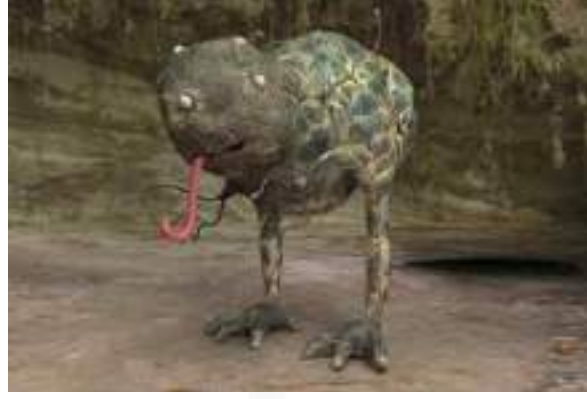
Görsel 4. Symbiosis II

Çok duyulu deneyimler yaratmayı hedefleyen Polymorf'un ürettiği etkileyici enstalasyonlar arasında şunlar yer almaktadır: Ünlü insanların hayatlarındaki son anları ses ve kokular aracılığıyla yeniden yaratarak katılımcının birinci şahıs perspektifinden deneyimlemesini sağlayan Famous Deaths, EEG teknolojisini kullanarak ziyaretçilerin beyin aktivitesinden üretilen bir benlik temsili sunan Entangled Body, dokunma, ses ve koku duyularını uyararak ve soğutma/ısıtma elemanlarından yararlanarak bir kuyruklu yıldızın yolculuğunu deneyimleme imkanı sunan Cosmic Sleep (Start, 2024).