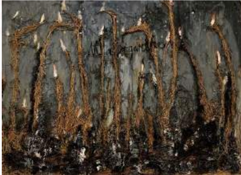
Görsel 1. Anselm Kiefer Margarethe (1981). 280 x 380 cm. T.Ü.K.T San Francisco Modern Sanat Müzesi. ABD.