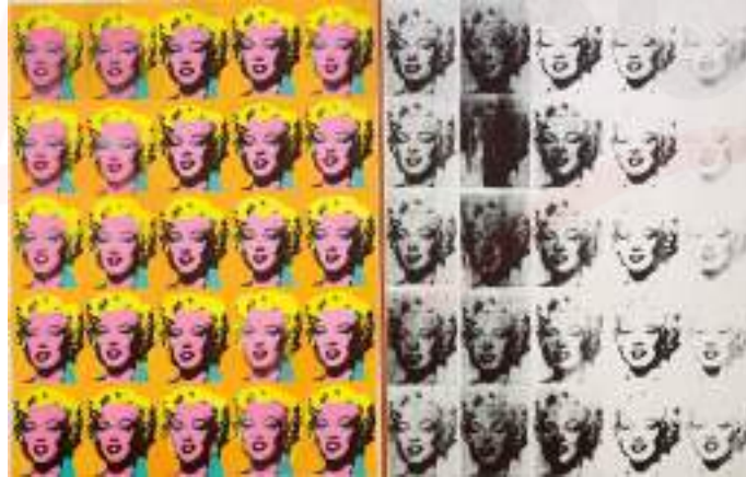
Görsel 13. Andy Warhol, “Marilyn Diptych”, Keten Üzerine Akrilik, Serigrafi Mürekkebi ve Grafit, İki Panel: 80 7/8 X 114 İnc, 205 x 289 cm, 1962.

İşaret ve sembollerin önemli olduğunu savunan Antoni Tàpies, soyut resim geleneğinde eserler üretmiştir. Sanat eseri üretim sürecinde deneye önem veren sanatçı, baskı, kolaj, grafiti gibi teknikleri birleştirdiği çalışmalar ortaya koymuştur. Çalışmalarında, farklı malzemeleri ve teknikleri birleştiren sanatçının kompozisyonlarında, baskılar, fırça darbeleri, tesadüfi çizikler, rastlantısal lekeler ve daha birçok deneysel teknik mevcuttur (URL-4).