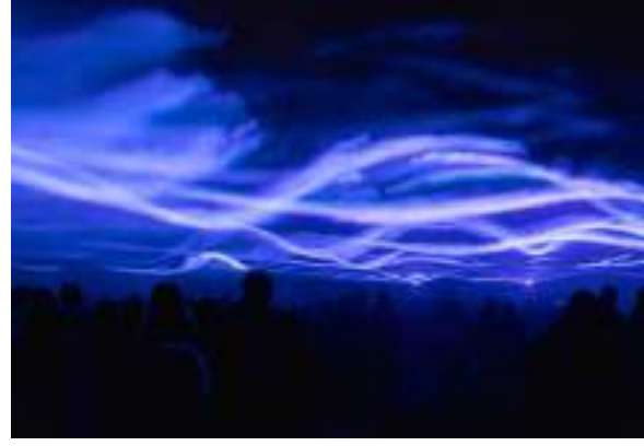
Görsel 2. Waterlicht II

Roosegaarde ve ekibi, “bir mucitin yaratıcılığı ve bir sanatçının öngörülemez tutumu ile” (Sabini, 2018) günümüz dünyasının küresel problemlerini ele alan çok sayıda dikkat çekici tasarım üretti. Roosegaarde’ın teknoloji ve doğaya hayranlığını yansıtan en çarpıcı projeler arasında şunlar yer almaktadır: Patentli pozitif iyonizasyon teknolojisi ile havadaki karbondioksitleri yakalayıp temiz hava üreten Smog Free Tower, 222nm UVC ışığı kullanarak koronavirüsü %99,9’a kadar azaltabilen Urban Sun, dünyanın yörüngesinde yer alan 29000’den fazla uzay çöpiye dikkat çeken Space Waste Lab.