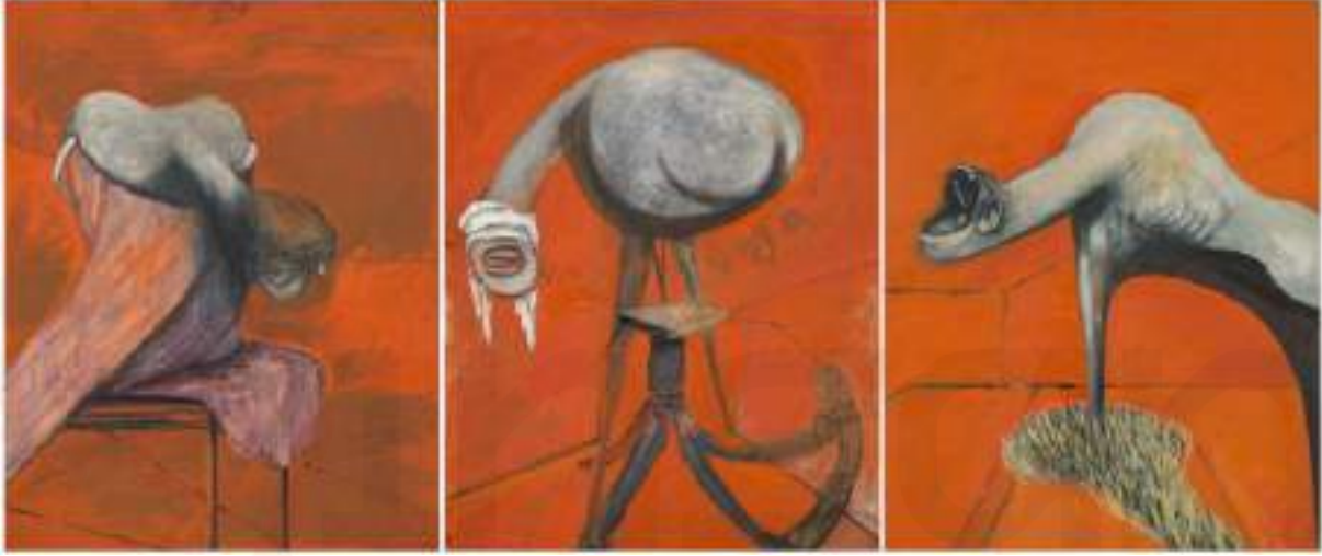
Görsel 2. Three Studies for Figures at the Base of a Crucifixion, 1944, Tate, Londra.

Bu resimlerde, topluma kendi kimliğini kabul ettirmeye çalışan bir insanın yaşadığı travmaları dışavurumcu bir yaklaşımla anlatmıştır. Eşcinsel olmasının yarattığı sıkıntılar gündelik yaşamını etkilediği kadar resimlerini de etkilemiştir. Toplum tarafından sapkın olarak görülen sanatçının yaşam biçimi, maruz kaldığı toplumsal ve bireysel şiddet onun sanatında kullandığı travmaların psikolojik yansımalarıdır.