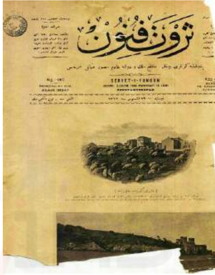
Görsel 1. Servet-i Fünûn Dergisi, 29 Ağustos 1896, 287. Sayı.

Ülkemizde 1800'lerin sonlarında fotoğraf sanatının gelişimi için başlamış olan çabalar her ne kadar sayısal ve yaygınlık anlamında yetersiz olsa da fotoğraf sanatına ilgi çekmek ve amatörleri desteklemek açısından çok önemlidir. Aynı zamanda katılımcıların belli bir düzeyde fotoğrafik bakış açılarını geliştirmelerine de olanak tanıdığı düşünülmektedir. İlerleyen yıllar içinde yaygınlaşarak sayıları artan fotoğraf yarışmalarının konuları sayesinde kültürel değerlere farkındalık artırılmış, onların belgelenmesi sağlanmıştır. Sanatsal tavırların ve teknolojik yeniliklerin değişimi ile de günümüzde fotoğraf yarışmaları dünya genelinde çeşitli kategorilerde düzenlenen büyük ölçekli etkinliklere dönüşmüş ve geniş katılımcı kitlesini bir araya getiren önemli organizasyonlar haline gelmiştir.