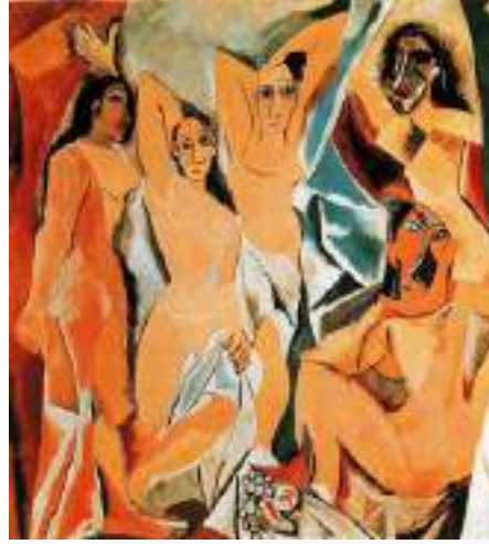
Görsel 4. Pablo Picasso, “Avignonlu Kızlar”, TÜYB, 244x234 cm, Modern Sanat Müzesi, New York, ABD.

Postmodern sanatla birlikte ise modern sanatın devamı olarak bazı ilkeler sürdürülürken bazı ilkeler reddedilmiştir. Ayrıca beden, özellikle Dada gösterilerinden sonra sanata daha fazla dahil edilmiştir. Joseph Beuys, Yves Klein, Marina Abramoviç, Stelarc ve Orlan gibi sanatçılar, sanat ve beden arasındaki araç ve amaç ilişkisini tersine çevirmişlerdir. Bu sanatçılar sayesinde beden kavramı, sanat tarihi ve sanat yapıtları kapsamında yeniden ele alınarak sorgulanmaya başlanmıştır. Böylece postmodern sanat sürecinde beden sanatı, performans sanatı gibi bedenin doğrudan ön planda olduğu sanat pratikleri ortaya çıkmıştır (Yılmaz, 2013).