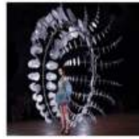
Görsel 3. Iris Van Herpen 2019 "Hypnosis" koleksiyonu

Moda ve sanat arasındaki sınırları zorlayan tasarım anlayışları, zaman içinde farklı biçimlerde kendini göstermiştir. Örneğin; Salvador Dalí, üzerine nane likörü dolu bardaklar yerleştirdiği klasik bir smokini sürrealist bir yaklaşımla giyilebilir sanat eserine dönüştürmüştür (görsel1). Benzer şekilde Viktor & Rolf'un Sonbahar/Kış 2015 haute couture