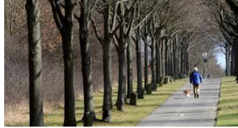
Görsel 1. Joseph Beuys, 7000 Meşe, Kassel, 1982

Land Art, 1960'ların sonunda Amerika ve Avrupa'da doğa ile doğrudan temas kuran, genellikle galeri dışında gerçekleştirilen sanat üretimlerini tanımlar. Robert Smithson'un Spiral Jetty (1970) adlı eseri bu akımın simgesel örneklerinden biridir (Smithson, 1996).