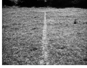
Görsel 2. Bir Yürüyüş Boyunca Çizgi, İngiltere, 1967

Yürüyüş boyunca gerçekleşen her adım, hem zamanın akışını hem de sanatçının mekânla kurduğu ilişkisel sürekliliği görünür kılar. Bu nedenle yürümek, modern kent yaşamının hızından ve tüketim odaklı yapısından uzaklaşarak doğanın ritmine uyumlanan eleştirel bir tavır olarak da okunabilir.