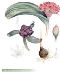
Görsel 5. Gülnur Ekşi, "Allium Akaka" Bellevalia rixii, kâğıt üzerine sulu boya, 2006