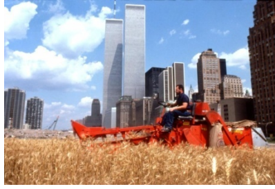
Görsel 3. Agnes Denes- Wheatfield- A Confrontation , 1982, The Harvest, Battery Park Çöplüğü, Manhattan Şehit Merkezi

Agnes Denes'in Wheatfield – A Confrontation (1982) adlı ikonik çalışması, çağdaş ekolojik sanatın sınırlarını yeniden tanımlayan; mekân, ekonomi, çevre ve insan emeği arasındaki ilişkileri görünür kılan öncü bir yapıt olarak kabul edilir. Manhattan'ın merkezinde, Dünya Ticaret Merkezi'nin tam karşısında yer alan bir çöplük alanın dönüştürülerek buğday ekilmesi, sanat tarihinde yalnızca estetik bir eylem değil, aynı zamanda politik, ekolojik ve ekonomik bir karşı duruş olarak da okunur. Denes, bu müdahalesiyle atıkla kaplanmış bir yüzeyi yeniden canlandırarak doğanın kendini yenileme potansiyelini hem maddesel hem de düşünsel düzlemde görünür kılar.