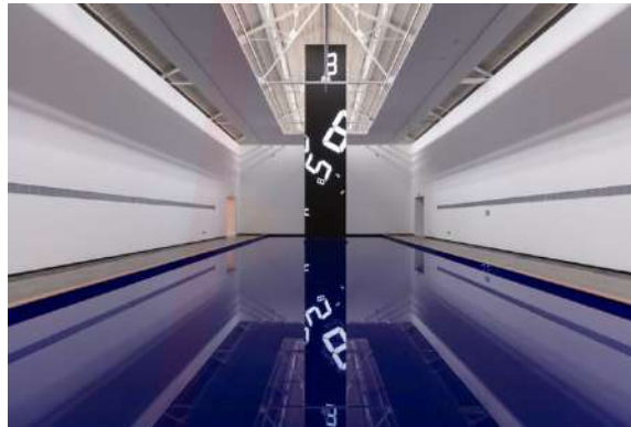
Görsel 15. Tatsuo Miyajima, L.E.D. panel (10mm aralık, 16 x 32 cm), IC, elektrik teli, çelik çerçeve, PC (Windows), LAN kablosu, Video denetleyicisi, 256 x 128 x 1200 cm

Felix Gonzalez-Torres’in 1991 tarihli “Untitled” (Perfect Lovers) adlı çalışması, zaman, aşk ve ölüm temalarını sade ama derinlikli bir biçimde işleyen çağdaş sanat örneklerinden biridir. Eserde, yan yana duvara monte edilmiş iki yuvarlak saat, ilk bakışta sıradan birer endüstriyel nesne gibi görünse de izleyiciye güçlü bir duygusal ve kavramsal çağrışım sunar. Başlangıçta tamamen senkronize olan saatler, zamanın ilerleyişiyle kaçınılmaz biçimde birbirinden sapar; bu da insan ilişkilerinde kaçınılmaz olan ayrılık, kayıp ve ölüm temalarına işaret eder. Gonzalez-Torres, bu çalışmasında mekanik zamanın ölçülebilirliğini, duygusal zamanın kırılgenliğiyle karşı karşıya getirerek, özellikle AIDS krizinin yaşandığı bir dönemde kişisel bir yas anlatısını evrensel bir metafora dönüştürür. Eserin başlığı olan “Perfect Lovers” (Kusursuz Aşıkler), bu birlikteliğin geçiciliğini ve kusursuzluğun olanaksızlığını ironik biçimde yansıtır. Minimalist bir biçimle kurulan bu yerleştirme hem bireysel hem kolektif hafızada yer edinen aşkın zamansallığına dair güçlü bir poetik ifade niteliğindedir.