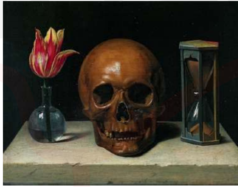
Görsel 1. Philippe De Champaigne, Kafatası ile Natürmort, Ahşap Üzeri Yağlı Boya, 28 x 37 cm, 1671

Farklı dönem ve sanat akımlarına mensup sanatçılar, saat imgesini kendi dönemsel bağlamları ve sanatsal yaklaşımları doğrultusunda farklı biçimlerde yorumlamışlardır. Natüralist ressam, saat imgesini çoğunlukla resmin arka planında, bazen mekânla bütünleşik bir unsur olarak, bazen de mekândan bağımsız bir biçimde kullanmışlardır. Bu yaklaşımda saat, günlük yaşamın olağan bir parçası olarak yer alırken, zamanın akışına dair doğrudan bir gönderme taşımaktan ziyade sahneye gerçeklik katma işlevi üstlenmiştir. Örneğin Jean-Baptiste-Siméon Chardin (1699-1779) gibi 18. yüzyıl ressamlarının natürmortlarında görülen saat betimlemeleri, dönemin gündelik yaşantısına dair bir belge niteliğindedir (Gombrich, 2007, s. 422). Öte yandan, 20. yüzyılın ortalarından itibaren çağdaş sanatçılar, saat objesini bir zaman göstergesi olmaktan çıkararak kavramsal ve metaforik bir anlama taşımışlardır. Özellikle Duchamp'ın "ready-made" yaklaşımıyla birlikte, gündelik nesnelere sanatın salt bir parçası hâline gelmiş; bu bağlamda saat de zamanın akışına, geçiciliğe ve bireyin zamansal algısına dair eleştirel bir imgeye dönüşmüştür.