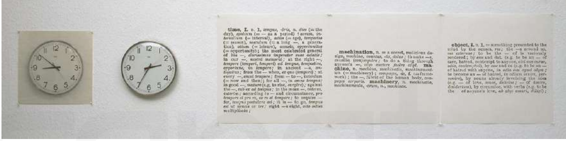
Görsel 6. Joseph Kosuth, "Saat (Bir ve Beş) / Latin Versiyon", Saat, Fotoğraf ve Baskı Alınmış Kağıtlar, 1965-1974

hemen alt köşesinde bir saat, diğer kenarda ise ikinci bir saat bulunmaktadır. Rauschenberg'in çoğu eserinde, objelerin resme dahil edilme sürecinde rastlantısallık ve anlamsızlık ön plana çıkabilmektedir. Ancak Rezervuar çalışmasında saatlerin yerleştirilmesi, zaman kavramı üzerinden bozulma, çürüme, eskime ve yok olma gibi temalara işaret etmektedir. Bu yönüyle eser, sadece fiziksel objeleri bir araya getiren bir kolaj olmanın ötesine geçerek, zamana ve varoluşun geçiciliğine dair bir anlatım sunmaktadır.