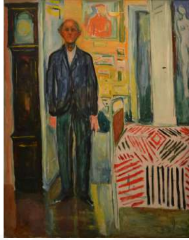
Görsel 4. Edvard Munch, Saat ile Yatak Arasında Otoportre, Tuval üzerine yağlıboya,1940-1943, Munch Müzesi, Oslo.