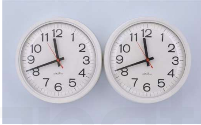
Görsel 14. Felix Gonzalez-Torres – “Untitled” (Perfect Lovers), 1991 Duvar Saatleri ve Duvar Üzerine Boya, duvar saatleri ve duvar üzerine boya, her bir saat: 35,6 cm çap × 7 cm derinlik (14 inç × 2 ¾ inç)

“The Clock / Zaman”, izleyiciyi içinde yaşadığı zamanı tekrar deneyimlemeye zorlamakta, bu da sanat eserinin zamansal farkındalık yaratma işlevine işaret etmektedir.