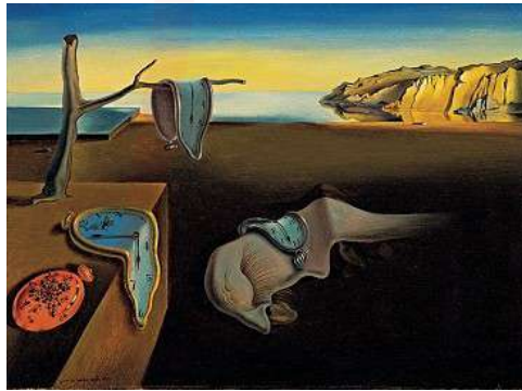
Görsel 3. Salvador Dalí, "Belleğin Azmı", Tuval Üzerine Yağlı Boya, 24.1 x 33 cm, 1931, Museum of Modern Art

Bu kompozisyonda yer alan saat, yalnızca bir nesne olarak kompozisyonun içinde bulunmaz; aynı zamanda mekânın sessizliği ve durağanlığı içinde zamanın akışını sorgulatan bir metaforik unsur haline gelmektedir. De Chirico'nun ısrarla tekrar ettiği mimari öğeler, endüstriyel nesnelere ve gündelik objelerle birlikte sahnede beliren saat, izleyiciye işlevsel bağlamını aşan bir düşünsel alan açmaktadır. Bu bağlamda saat, hem modern yaşamın ölçülebilir zamansallığını temsil eder hem de sahnedeki durağan atmosfer aracılığıyla zamanın kesintiye uğradığı, askıya alındığı ve kavramsal bir boyuta taşındığı bir deneyim üretmektedir. Böylece, sanatçının metafizik resim anlayışı doğrultusunda, sıradan bir obje düşünsel ve felsefi bir derinlik kazandıran görsel bir simgeye dönüşmektedir.