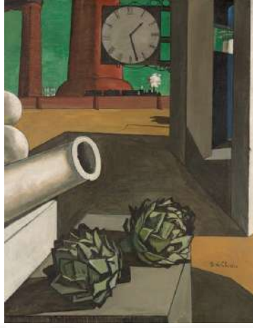
Görsel 2. Giorgio de Chirico, Filozofun Zaferi, 1914, Tuval Üzerine Yağlı Boya, 126 x 100 cm, Chicago Sanat Enstitüsü

Giorgio de Chirico'nun (1888-1978) "Filozofun Zaferi" (Görsel 2) adlı yapıtında saat, resimdeki diğer gündelik nesnelere ayrılarak sahnenin anlamını derinleştiren metaforik bir unsur olarak belirmektedir. Enginarlar, top ve endüstriyel yapılarla kurulan düzen, izleyiciye gündelik gerçekliğin sıradanlığını çağrıştırırken; saat, bu durağan kompozisyon içinde zamanın akışına dair belirsiz bir gerilim yaratmaktadır. Lynton'un (2004) yorumunda da vurgulandığı gibi, trenin bacasından çıkan duman yaşamın sürmekte olduğuna işaret ederken, saatin varlığı zamanı askıya almış bir atmosferin kapısını aralamaktadır. Böylece saat, işlevsel yönünün ötesinde mekânın tekinsizliğini artıran, düşünsel bir sorgulama alanı açan bir göstergedir (s.148-149).