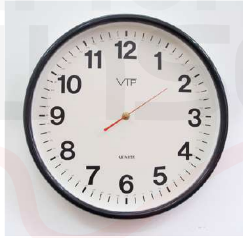
Görsel 11. Nicolás Bacal, Senden Sonra Uzun-Zamanın Geometrisi, 2010

Arjantinli Sanatçı Nicolás Bacal’ın 2010 yılında 12. İstanbul Bienalinde sergilenen çalışması “senden sonra uzam” zaman kavramını duvar saati objesi üzerinden ele almaktadır. Sanatçının yapıtında standart bir duvar saatinin akrep ve yelkovanını sökerek sadece saniye ölçen kadrani bıraktığı görölmektedir. Her bir rakamın yanına yazılan “vos” kelimesi ise Türkçede “sen” karşılığını bulur ve hem yapıtın ismi hem de anlatmak istediğı düşünceyi gözler önüne serer. Sanatçı bu çalışmasını şu sözlerle tanımlamaktadır. “Önce saati ve dakikaları gösteren akrep ve yelkovanı kaldırdım ve tam zamanı değil, zamanın geçişini göstermek üzere yalnızca saniye ibresini bıraktım. Sonra saat kadrannın kenarlarına vos (yalnızca Arjantin genelinde kullanılan İspanyolca “sen”) sözcüğünü yazdım” (12.İstanbul Biennial Kataloğundan, s.121). Akrep ve yelkovan’ı kaldırılmış bir saat ve dakikaları işaret etmiyor olsa da saniye kadrannın ilerlemeye devam etmesi zamanın akışının durdurulmaz oluşunu, bir döngü halinde dönmeye devam ettiğini ifade etmektedir.