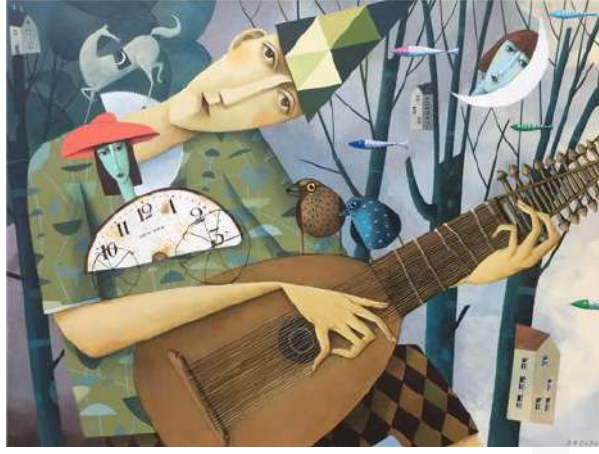
Görsel 12. Marek Brzozowski, Tuval Üzerine Yağlı Boya, 60 x 80 cm, 2017

Marek Brzozowski, üretimlerinde zaman, hafıza ve varoluş temalarını sembolik imgeler yoluyla işleyen bir sanatçıdır. Özellikle saat, dişli ve mekanik parça temsilleri, Brzozowski'nin figüratif kompozisyonlarında hem estetik hem de kavramsal düzeyde ön plana çıkar. Sanatçının 2017 tarihli bu çalışmasında, vanitas geleneğini anımsatan bir sahne yer almaktadır: müzik aleti çalan bir figürün sağ kolu üzerine yerleştirilmiş, oyuncak formunu andıran telden tekerlekler ve dişliler dikkat çekicidir. Bu detaylar, zamanın mekanik işleyişinin yanı sıra bedensel deneyim ve ruhsal süreklilik üzerindeki yıpratıcı etkisine de gönderme yapmaktadır. Brzozowski'nin bu yaklaşımı, zamanı bir ölçü birimi olmanın ötesine taşıyan bir anlayışı temsil etmektedir. Brzozowski'nin çizgisel anlatımı, post-vanitas estetiğiyle birleşerek, zamanın insanın fiziksel ve duygusal varoluşu üzerindeki izlerini vurgulayan çağdaş bir alegoriye dönüşmektedir. Bu bağlamda sanatçının saat imgesine yaklaşımı, sadece grafiksel bir motif olarak değil, insanın zamanla kurduğu çok katmanlı ilişkiyi görünür kılan eleştirel ve şiirsel bir dilin parçası olarak değerlendirilmelidir.