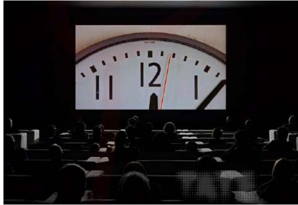
Görsel 13. Christian Marclay, "The clock /saat", 2010

Marek Brzozowski, üretimlerinde zaman, hafıza ve varoluş temalarını sembolik imgeler yoluyla işleyen bir sanatçıdır. Özellikle saat, dişli ve mekanik parça temsilleri, Brzozowski'nin figüratif kompozisyonlarında hem estetik hem de kavramsal düzeyde ön plana çıkar. Sanatçının 2017 tarihli bu çalışmasında, vanitas geleneğini anımsatan bir sahne yer almaktadır: müzik aleti çalan bir figürün sağ kolu üzerine yerleştirilmiş, oyuncak formunu andıran telden tekerlekler ve dişliler dikkat çekicidir. Bu detaylar, zamanın mekanik işleyişinin yanı sıra bedensel deneyim ve ruhsal süreklilik üzerindeki yıpratıcı etkisine de gönderme yapmaktadır. Brzozowski'nin bu yaklaşımı, zamanı bir ölçü birimi olmanın ötesine taşıyan bir anlayışı temsil etmektedir. Brzozowski'nin çizgisel anlatımı, post-vanitas estetiğiyle birleşerek, zamanın insanın fiziksel ve duygusal varoluşu üzerindeki izlerini vurgulayan çağdaş bir alegoriye dönüşmektedir. Bu bağlamda sanatçının saat imgesine yaklaşımı, sadece grafiksel bir motif olarak değil, insanın zamanla kurduğu çok katmanlı ilişkiyi görünür kılan eleştirel ve şiirsel bir dilin parçası olarak değerlendirilmelidir.