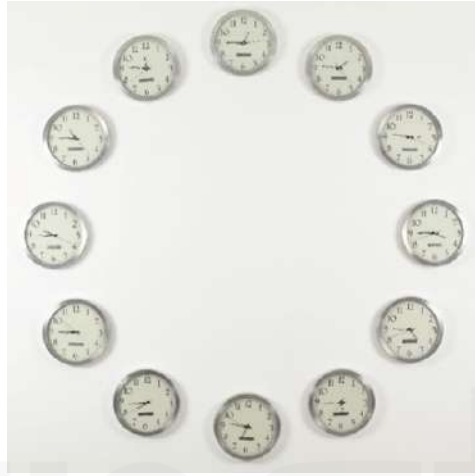
Görsel 10. Cengiz Çekil “Saat Kaç”, 2008, gümüş damgalı duvar saatleri, 12 adet, her biri Ø 36 cm