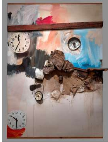
Görsel 5. Robert Rauschenberg, Rezervuar, 217.2 x 158.8 x 39.4 cm, Tuval Üzerine Yağlı Boya, Kalem, Kumaş, Ahşap ve Metal, İki Elektrikli Saat, Kauçuk Tekerlek ve Telli Tekerlek Jantı, Smithsonian Sanat Müzesi, ABD, 1961.

Rauschenberg'in (1925-2008) Rezervuar (Görsel 5) adlı eserinde, kompozisyonun sol üst ve alt köşelerine yerleştirilmiş iki farklı saat dikkat çekmektedir. Sanatçının genel üretim yaklaşımında, resim yüzeyine çeşitli objeleri kolaj tekniğiyle eklediği bilinmektedir. Bu çalışma da bu yaklaşımı yansıtır; resmin üst yüzeyini paralel olarak bölen metal şeridin