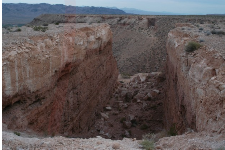
Görsel 1. Michael Heizer, Çifte Negatif, 1969, Nevada.

Bu sanatçılar geniş arazilerde yaptıkları üretimlerini, çoğunlukla izleyicinin kolaylıkla erişemeyecekleri yerlerde gerçekleştirmişlerdir. Çoğu izleyici bu üretimleri fotoğraf şahitliği aracılığıyla görebilmektedir. Bu sanatçılar sanatı, müze, galeri gibi mekanlardan çıkarıp, sanat eserini meta olmaktan kurtarmak için bu yolu seçmişlerdir. Diğer taraftan üretimlerini gerçekleştirmek için kullandıkları yollar eleştirilmiştir. Özellikle Heizer'ın buldozer ve dinamit kullanarak gerçekleştirdiği Çift Negatif isimli çalışması, doğaya karşı yaptığı müdahale bağlamında eleştiriyle karşılaşmıştır (Görsel 1). Bu çalışma için büyük ölçüde toprağın ve kayanın çıkartılması gerekmiştir. Toprağın ve kayaların çıkarılması için kullanılan dinamit, petrol, enerji doğaya zarar vermesi açısından ve bu bakımdan Land Art akımının doğasına uymadığı gerekçesiyle tepki çekmiştir. Sanatçı negatif heykelleri oluşturmak için 244.000 ton riyolit ve kumtaşı çıkartmıştır.