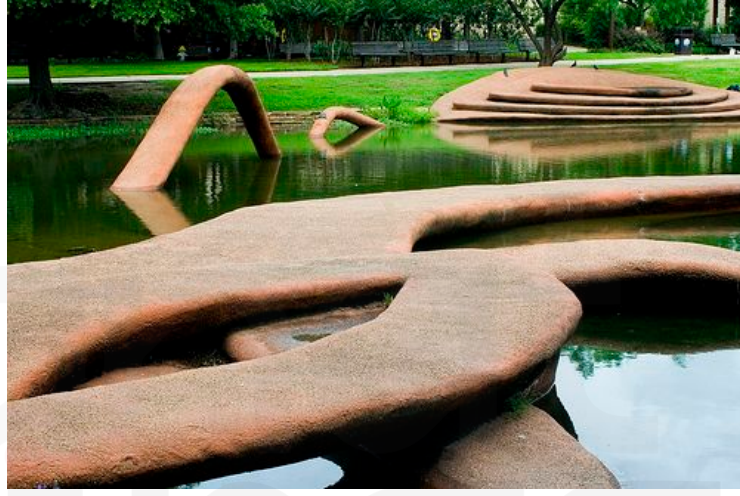
Görsel 8. Patricia Johanson, Fair Park Lagoon, 1981-86.

bitki ve hayvan çeşitliliğini artırmak adına yapılan projelerdendir (Görsel 8). Sanatçı bu proje ile amacına ulaşmıştır. Bölge yeniden canlandırılmış, bitkiler hayvanlar ve insanlar için yeniden yaşanabilir bir ye haline gelmiştir. Projede ziyaretçilerinde rahatça geçebilecekleri patikalar oluşturulmuş ve aynı zamanda kaplumbağalar ve diğer hayvanların kullanabilmelerine uygun tasarlanmıştır.