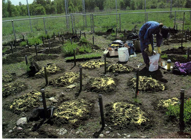
Görsel 9. Mell Chin, Revival Field, 1990.