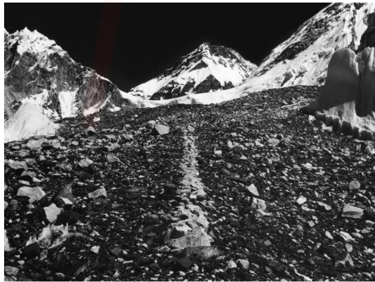
Görsel 3. Richard Long, Himalayalar'da Bir Çizgi, 1975.

Arazi sanatçılarından bir diğer isim Richard Long'tur. Ancak buraya kadar ele alınan arazi sanatçılarından farklı olarak o üretimlerinde doğaya müdahale etmemiş, fiziksel olarak çok fazla değiştirmeden daha fazla doğayla uyum yakalayan ve ince bir görsel estetik oluşturmuştur. Bir bağlamda doğaya ve çevreye duyarlı bir biçimde yaklaşarak üretimlerini gerçekleştirmiştir. O doğada uzun yürüyüşler gerçekleştirmiştir (Görsel 3). Buldozerler, dinamitler olmadan sadece bir çevre gezgini gibi yanında pusula, harita, defter, kalem, kamera gibi basit malzemeler taşır. Yaptığı yürüyüşlerde taş, çamur, dal gibi doğal malzemelerin de yardımıyla doğada izler bırakır. Bu üretimler doğada herhangi kalıcı bir değişiklik ve zarar oluşturmamaktadır.