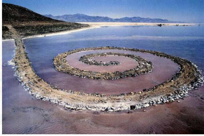
Görsel 2. Robert Smithson, Sarmal Dalgakıran, 1969-70, Büyük Tuz Gölü Utah

Heizer ve Smithson gibi büyük arazilerde ve mega büyüklükte üretim gerçekleştiren sanatçılar için oldukça büyük sponsora ihtiyaç duyulmaktadır. Üretimlerinin devasallığı ve doğaya müdahalesi, insanlığın doğaya hakimiyetinin görselleşmiş hali gibidir. Bu üretimlerin fotoğraf, video gibi dokümanları galeri mekanlarında sergilenmesi, galeri ve müze mekanlarını eleştirip doğaya çıkan sanatçının yine beyaz küpe dönmesi açısından eleştirilmiştir.