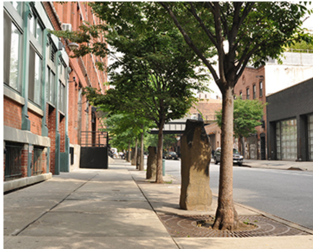
Görsel 4. Joseph Beuys, 7000 Oaks, 1982-1987.

Sanatçıdan etkilenen ve onun bu projesinin devamı niteliğinde işler üreten sanatçılar mevcuttur. Bu anlamda sanatçılar için doğa ve çevre ekolojik bağlamlarda ele alınmıştır diyebiliriz. Çünkü önceki dönemlerin sanatçıların doğa ilişkisindeki ekolojik duyarlılık, artan boyutta devam etmektedir. Bu şekliyle sanatın geleneksel eğilimleri yerinden oynatılarak ezberler günden güne hayalleri aşacak boyutta yıkılmaktadır. Ve hayaller gerçeklerle değişerek dünyayı iyileştirmeye, doğa ve insan arasındaki hiyerarşi yıkılarak insanlığın doğayla olan ilişkisini yapılandırmaya çalışan üretimler sanat dünyasında daha fazla boy göstermeye başlamıştır. Sanat sadece insan hayatıyla bütünleşmeyerek dünyanın ve doğanın hayatına iyimser anlamda daha fazla haşır neşir olmaya başlamıştır. Bu anlamda ekolojik sanat alanında üretim gerçekleştiren sanatçılar topluma ilham ve umut vermektedir. Yeryüzü Sanatı, Arazi sanatı, Çevresel Sanat gibi yaklaşımlardan bu özelliği ile ayrılan Ekolojik Sanat yaklaşımı, sanat ve doğa ilişkisinde sanatın iyileştirme gücünü doğa üzerinde etkili hale getirmektedir.