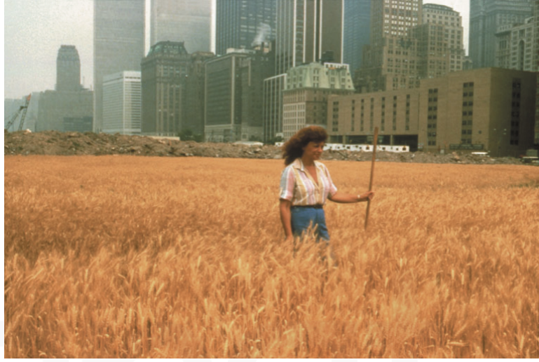
Görsel 5. Agnes Denes, Buğday Tarlası, 1982.

Bu cesaret sanatçılar açısından ise sanat ve doğa ilişkisi, doğayı sanat icra edecek bir mekan olarak kullanmaktan, doğayla birlikte çalışarak, onu destekleyerek iyileştirmek için sanat yapmaya doğru evrilmiştir. Bu durumun en açık yansımasına örnek olarak "Helen ve Newton Harrison'ın projeleri insanı doğaya yeniden yönlendirmek için tasvirsel metaforların kullanıldığı, genel olarak uluslararası, ekolojik bilinci gözler önüne seren anısal çalışmaları" (Zümrüt, 2012, s.46) verilebilir. Ekolojik Sanatın büyük annesi ve büyük babası olarak adlandırılan çift, çok uzun zamanlar ekolojik sanatın gelişimine büyük katkılar sağlayan üretimler gerçekleştirmiştir. Bir çok ekolojik sanatçı gibi bu sanatçılarda üretimlerini, içerisinde bilim insanlarının olduğu; özellikle biyologlar ve ekoloji uzmanları gibi insanlarla gerçekleştirirler.