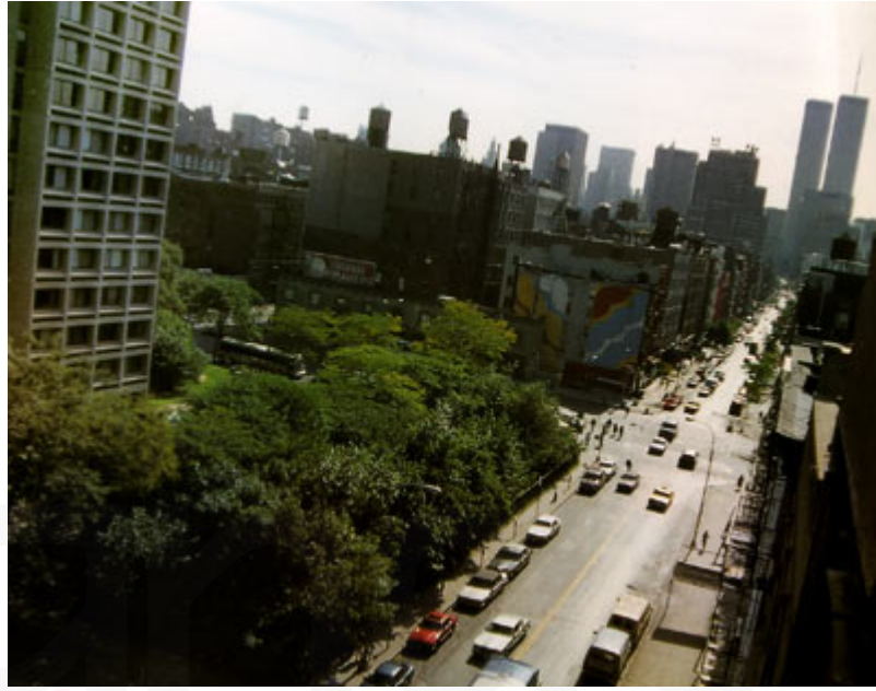
Görsel 11. Alan Sonfist, Time Landscape, 1978.