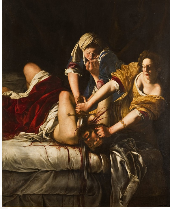
Görsel 10. Artemisia Gentileschi, Judith'in Holofernes'i Katli, 1611-1612.

17. yüzyıl Barok ressamlarından biri olan Giovanni Andrea Sirani, Guido Reni ile birlikte çalışmış, çalışmalarında Reni'den etkilenmiştir. Sanatçı Reni'den örnek aldıklarını kendi orijinal akıcı anlatımıyla özümseyerek yansıtır. Guido Reni'nin ölümüyle atölyeyi miras alan sanatçı, daha çok bir kadın ressam olan kızı Elisabetta Sirani (1638- 1665) ile birlikte anılır.