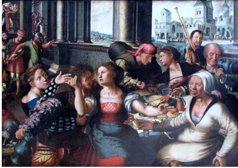
Görsel 1. Jan Sanders van Hemessen, Müsrif Oğul, 1536.

Caterina van Hemessen'in 20 yaşında cinsiyetten bağımsız, şövale başında çalışan bir sanatçı olarak kendisini resmettiği ilk otoportresinde imzası da yer alır. Meşe üzerine yağlı boya ile yaptığı ve en bilindik eserlerinden biri olan bu çalışmada "Ben Caterina van Hemessen, kendimi boyadım /1548 / 20 yaşında" yazılıdır. Bu yazı karakteri ve üslubu bakımından Albrecht Dürer'in 28 yaşında yaptığı 1500 tarihli otoportresindeki ile benzerlikler gösterir. 1554 yılına kadar az sayıda dini çalışmayla birlikte imzasını taşıyan birkaç portre çalışması bulunan Hemessen'in bu tarihten sonra günümüze ulaşan bir çalışması bulunmadığından, evlilik sonrası resim yapmadığı düşünülmektedir (Glovier, 2021).