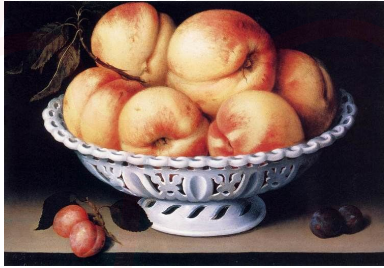
Görsel 6. Fede Galizia, Şeftali ve Porselen Kaseli Natürmort, 1610.

Fede Galizia'nın portre çalışmalarının önüne geçen resim konusu ise natürmortlarıdır. “Şeftali ve Porselen Kaseli Natürmort” çalışması belirgin bir kontrast ve tuvale hakim bir kompozisyon ile dikkat çekicidir. Işık, gölge ve dokular konusundaki gerçekçi yaklaşımıyla meyveler tuvalin içine uzanıp alabileceğiniz hissini yaratır.