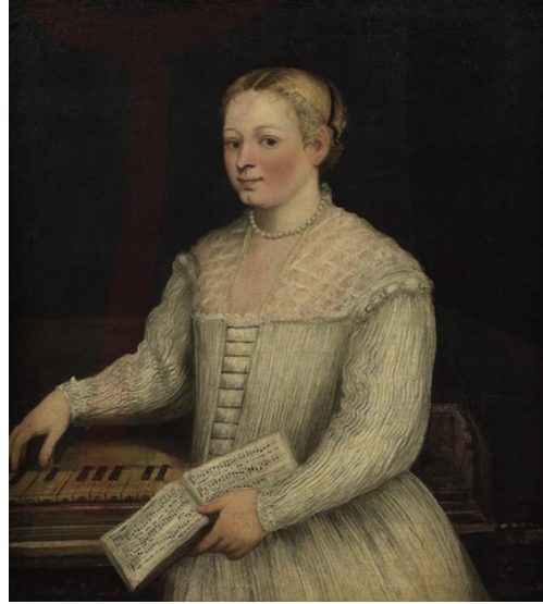
Görsel 4. Marietta Robusti, Madrigal ile Otoportre, 1580.

Marietta Robusti'ye atfedilen “Madrigal ile Otoportre” adlı çalışmada sanatçı kendisini beyaz bir elbise içinde elinde nota kađıtlarını tutarken resmetmiştir.