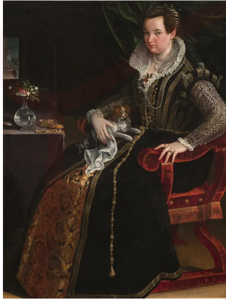
Görsel 8. Lavinia Fontana, Costanza Alidos'nin Portresi, 1594.

Prospero Fontana eğitiminin yanı sıra kızını çevresi ile de tanıştırmak için çok sayıda soylu müşteri edinmesini ve kiliseden komisyonlar almasını sağlamıştır. Soylu ailelerinin portrelerini yapan sanatçı, işlemeli ipek kumaşlar, mücevherler ve danteller içinde resmettiği bu figürlerle dönemin moda anlayışı konusunda da tarihçilere ışık tutmaktadır. Kariyeri boyunca pek çok ödül alan Lavinia Fontana 1603 yılında Papa VIII. Clement tarafından Roma'ya davet edilerek burada yaşamıştır (Maslov).