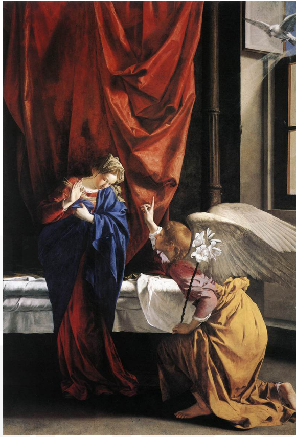
Görsel 9. Orazio Gentileschi, Müjde, 1623.

1623 tarihinde yaptığı “Müjde” tablosunda Caravaggio etkisinden uzaklaştığı görülür. Orazio Gentileschi kadın sanatçıların henüz kabul görmediği bir dönemde kızı Artemisia’yı (1593-1656) desteklemiş, Artemisia Floransa’da Accademia di Arte del Disegno’ya kabul edilen ilk kadın olmuştur. Babası kızının gelişimini desteklemek adına onu bir dönem birlikte çalıştığı arkadaşı Agostino Tassi’nin atölyesinde çalışmaya yönlendirmiştir. Desteklemek için yapılmış bu girişim Artemisa’nın hayatında bir dönüm noktasıdır. 17. yüzyılda bir kadın ressam olarak atölye hocasının ve arkadaşının tecavüzüne uğramış olan Artemisia’nın davası o dönemde sanattan çok konuşulmuş ve başarılarına gölge düşürmüştür (Harris, 2010).