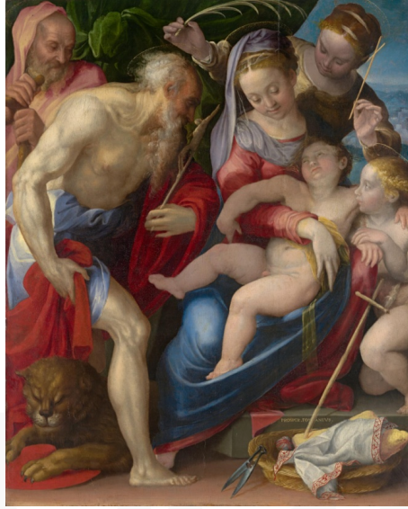
Görsel 7. Prospero Fontana, Azizler ile Kutsal Aile.

Prospero Fontana eğitiminin yanı sıra kızını çevresi ile de tanıştırmak için çok sayıda soylu müşteri edinmesini ve kiliseden komisyonlar almasını sağlamıştır. Soylu ailelerinin portrelerini yapan sanatçı, işlemeli ipek kumaşlar, mücevherler ve danteller içinde resmettiği bu figürlerle dönemin moda anlayışı konusunda da tarihçilere ışık tutmaktadır. Kariyeri boyunca pek çok ödül alan Lavinia Fontana 1603 yılında Papa VIII. Clement tarafından Roma'ya davet edilerek burada yaşamıştır (Maslov).