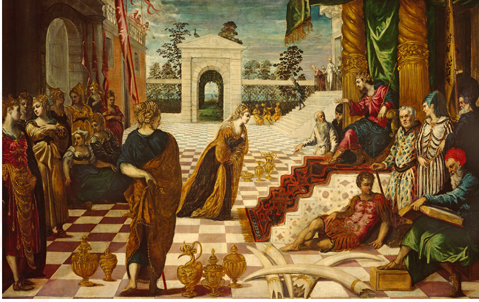
Görsel 3. Tintoretto (Jacopo Robusti), Saba Kraliçesinin Süleyman'ı Ziyareti, 1546-1548.