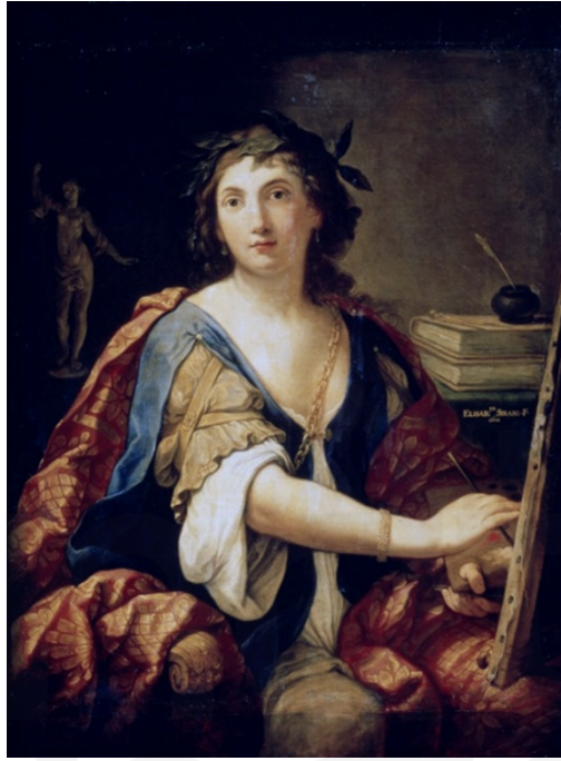
Görsel 12. Elisabetta Sirani, Resim Alegorisi, 1658.