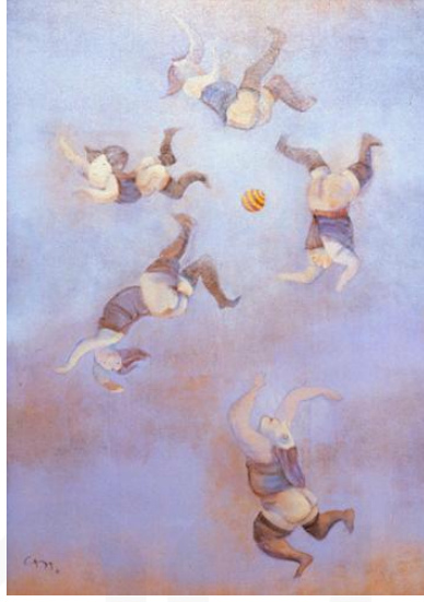
Görsel 10. Can Göknil, Kara Kızlar, 2001, Tuval Üzeri Akriolik, 70x50 cm

Şamanizm’de, gökyüzü, yeryüzü ve yeraltında bulunan ruhlar ve tanrılar olduğuna inanılırdı. Yeraltında bulunan ve kötü bir ruh olduğuna inanılan Erlik Han’ı, İnan (1986:39)’da şöyle tanımlamıştır;