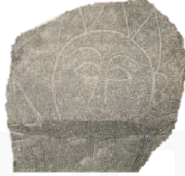
Görsel 7. Taş üzerine yapılmış Umay tasviri, Taraz (eski Cambul) Kastayev Devlet Müzesi

toprak ağzında büyümüş, şişmiş ve onu boğacak gibi olmuş. Kişi bakmış ki ölecek, Kara Han'ın büyüklüğünü kabullenmiş... Kara Han Kişi'ye tükürmesini emretmiş... Tükürdüğü topraklardan dağlar yükselmiş". Sanatçı bu eserinde birçok efsaneyi bir arada toplamayı başarmış ve yalın masalsi bir çizgi ile resmetmiştir. Görsel 6'da görülen resim Yer-Su İlahlarının yanı sıra yaratılmış efsanelerini de içinde barındırmaktadır.