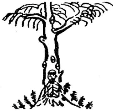
Görsel 3. Şamanların yuvalarında büyüdüğü ağaç ana

Ağaçtan türeme inancı Türklerde tarih öncesi devirlere kadar uzanmaktadır. Bu nedenle “Dünya Ağacı” ya da “Hayat Ağacı” olarak isimlendirilmiştir (Çoruhlu, 2002:116).