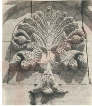
Görsel 2. Sivas Gök Medrese Ağacı kabartması