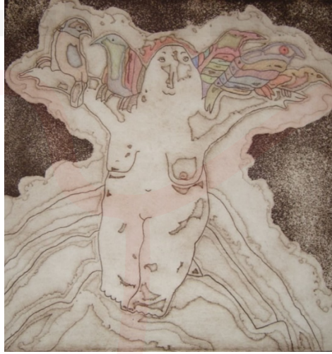
Görsel 8. Can Göknil, Umay Hatun 1, 1995, Gravür, 25x25 cm

“Kazakistan'ın Taraz (Cambul) şehrindeki bölge müzesinde bulunan Göktürk devri kaya resmi, yine Göktürk sanatının bir örneği olan Kudirge kaya resimlerindeki kadın tasvirlerinden büyük ebatta yapılmış olanı, Umay olarak kabul edilmiş ve saygı görmüştür” (Çoruhlu,2002:45).