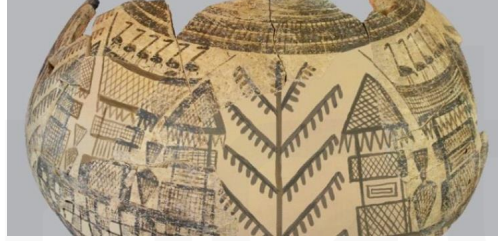
Görsel 1. Seramik Çanak, Domuztepe Höyüğü

Bu başlık altında Can Göknil'in Şamanist öğeler içeren 6 (altı) eseri incelenmiş ve tarih öncesi kalıntılardan örnekler verilmiştir. Sanatçının eserlerinde ve tarih öncesi kalıntılarda sıkça rastlanan ağaç figürü Şamanizm inancında oldukça önemli bir yer kaplamaktadır. Gökyüzündeki tanrılara ulaşmak için bir basamak olarak kullanılan ağaç, aynı zamanda hayatın başlangıcıdır. “Şamanlar ağacı gökyüzüne ulaşmak için bir merdiven gibi kullanıyorlardı. Yakut kamlarının her birisinin bir ağacı vardı” (Çoruhlu, 2002:116). Aynı inanca göre şamanlar ya da bir diğer adı ile kamlar kartal ile ağacın tepesine bırakılarak dünyaya gelir (Çoruhlu, 2002:65).