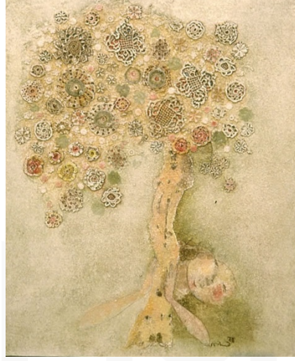
Görsel 4. Can Göknil, Ağaca Sarılmak, 1987, Tuval Üzerine Akrilik ve Tığ İşleriyle Kolaj, 60x50cm

“Şaman efsane ve memoratlarında geniş yer bulan ağaç ana, Şamanın doğduğu ve ilk yeteneklerini aldığı ağaçtır...Bu yuvalarda, gelecek Şamanın, kuş şeklindeki ruhu terbiye alıp büyür” (Bayat, 2006:7).