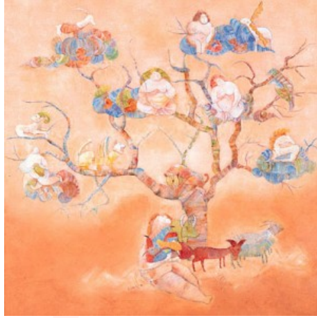
Görsel 5. Can Göknil, Ağaç (Hayat Ağacı, altında Ak-Ana oturuyor), 1995, Tuval Üzeri Akrilik Boya, 70x70 cm

Sanatçı Can Göknil'in eseri olan (Görsel 4)'te bir ağaç ve ağaca sarılan mutlu bir insan figürü görülmektedir. Kompozisyon bütününde çizgisel yönün dikey olarak inşası söz konusudur. Böylece göğe doğru yükselen ağaca vurgu yapılmıştır. Sarı ve yeşil pastel tonlarda resmedilen eser, ağacın kutsallığının ve verimliliğinin bir tasviri olarak kabul edilebilir. Eser yumuşak çizgiler ve renkler ile masalsi bir hava oluşturmaktadır. Şamanist inanca göre, dünyaya henüz gelmemiş olan ruhların ağaç dallarında beklediği düşünülmektedir. Buna göre, ağacın dallarına sıkça konumlandırılmış çiçekler henüz dünyaya gelmemiş ruhları ya da onların yuvalarını temsil ediyor olabilir. Sanatçının bu eserinde olduğu gibi birçok çalışmasında Şamanist öge olduğu bilinen tasvirlerle rastlanılmaktadır.