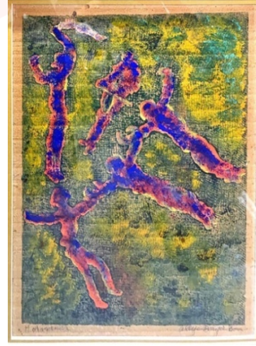
Görsel 13. Aliye Berger, Halaycılar , gravür üzerine renklendirme, 37x27 cm.