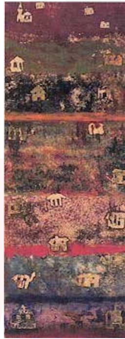
Görsel 15. Aliye Berger, Gecekondu , 1972, gravür, 78x28 cm, özel koleksiyon.

Yaşamının son yıllarında toplumun değişen yapısını gösteren gecekondu resimlerinde kendine has renklerle ve biçimlerle ele almıştır. Bir yandan çarpık kentleşmeye dikkat çekerken bir yandan kentte var olabilme çabalarını gösterir. 1972 yıllarına tarihlenen Gecekondu resminde evler yer kabuğunun katmanları gibi üst üste istiflenmiştir (Görsel 15). Dikey olarak yaptığı bu çalışmalarda katmanları rengarenk pembeler, morlar, maviler, sarılar, turuncularla boyamıştır.