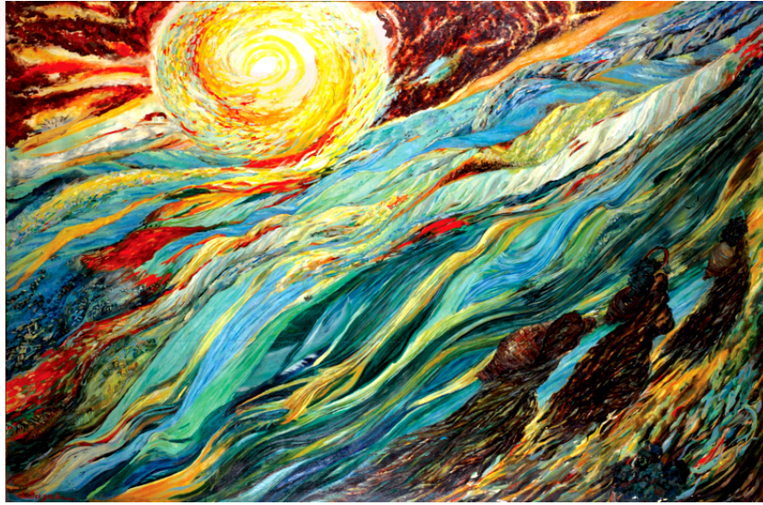
Görsel 1. Aliye Berger, Güneşin Doğuşu , 1954, tuval üzerine yağlıboya, 200x300 cm, YKY koleksiyonu.