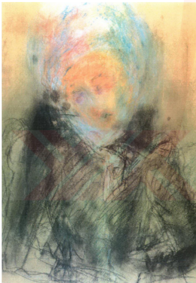
Görsel 6. Aliye Berger, Otoportre , Kağıt üzerine pastel, 50x37 cm, Özel koleksiyon.

Aliye Berger dönem dönem kendi portrelerini de yapmıştır. Bir ressamın otoportresini yapması bir nevi kendini tarihe not düşmesidir. Sanatçının kendini anlama/anlamlandırma arayışıdır. Başlangıçta daha yoğun olarak karakalem otoportreleri yapmıştır ve bu resimlerde acısını yüzünden okunacak şekilde betimlemiştir. Pastelle boyadığı otoportrelerinde yüzünü belli belirsiz betimlemiştir. Rengi otoportrelerinde de çizgiye eşdeğer bir kompozisyon elemanı olarak kullanır. Bu resimlerde acı ve hüznü hissedilir (Görsel 6, 7). Guaj otoportresinde boynunu örten yakası pek sevdiği otrişe benzeyen belirsiz giysisi içinde, dudakları, elmacık kemikleri, güneş rengiyle bakır renginin birleşiminde betimlemiştir. En sevdiği ressamlar arasında yer alan Munch'un dışavurumcu renk kullanımı ile Rembrandt'ın adeta bir günlük gibi yaptığı otoportrelerinden ilham almıştır. Kabarık saçları, derin bakan mavi gözleri, mavi-turuncu karışımı saçları ile ruhunun hem hüznünü hem de çocuksu coşkusunu yansıtabilmiştir (Görsel 8).