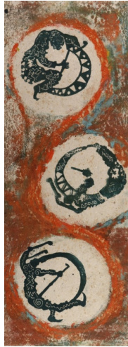
Görsel 9. Aliye Berger, Davulcu/Karayılan , 1972, metal baskı, 75x 27,5 cm, MSGSÜ İRHM koleksiyonu.