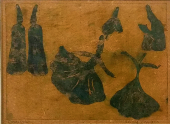
Görsel 2. Aliye Berger, Mevleviler , 1964, kağıt üzerine karışık teknik, Rabia Çapa koleksiyonu.