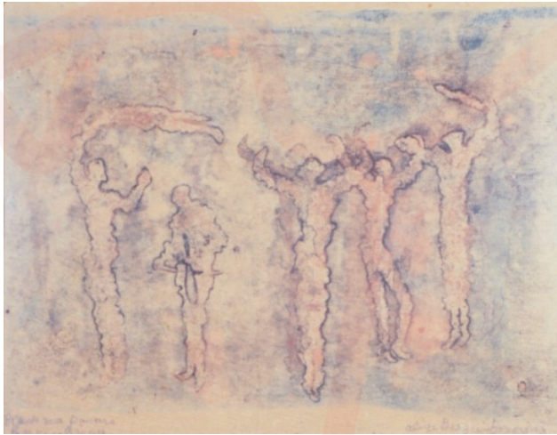
Görsel 12. Aliye Berger, Karadeniz Oyunları (Horon) , 1960, gravür baskı.

Sanatçı Karadeniz Oyunları , Horon Oynayanlar , Halaycılar , Dansçılar gibi folklorik dans çalışmaları da yapmıştır (Görsel 12, 13, 14). Bu gravürler genellikle renklidir. Sabahattin Eyüboğlu'nun "titrediklerini görüyorum" dediği bu figürlerde hareket ön plandadır (Özdoğru, 1974: 7). Aliye Berger coşkulu bir insandır ve dans resimlerinde bu coşku hissedilmektedir. Renkleri bazen canlı, bazen daha soluk kullandığı halay, dans, horon resimleri Matisse'nin Dans resimlerine benzer. Soğuk mavi-yeşil arka plana karşı dans eden nü'lerin ritmik ardışıklığı, özgürleşme duygularını iletir. Aliye'nin hayatında müzik hep vardır, dans resimlerinde de müzik ve ritm hissedilmektedir. Halaycılar ve Dansçılar gravüründe daha parlak renkler ve farklı malzemeler kullanarak dokulu bir görünüm elde etmiştir.