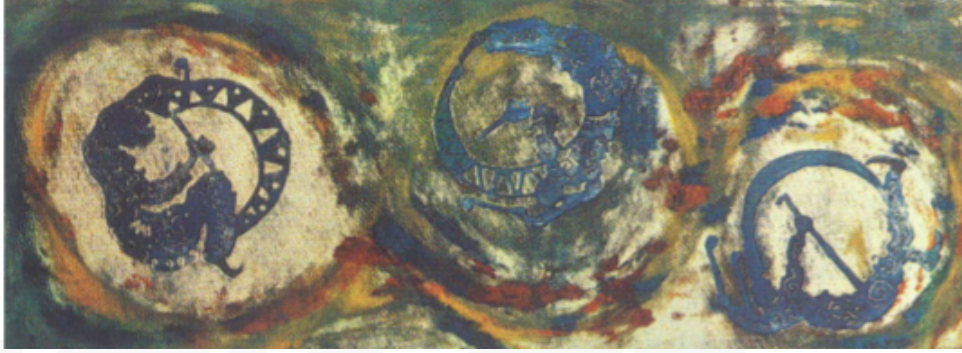
Görsel 11. Aliye Berger, Davulcu/Karayılan , karışık teknik, 28x75 cm.

Sanatçı Karadeniz Oyunları , Horon Oynayanlar , Halaycılar , Dansçılar gibi folklorik dans çalışmaları da yapmıştır (Görsel 12, 13, 14). Bu gravürler genellikle renklidir. Sabahattin Eyüboğlu'nun "titrediklerini görüyorum" dediği bu figürlerde hareket ön plandadır (Özdoğru, 1974: 7). Aliye Berger coşkulu bir insandır ve dans resimlerinde bu coşku hissedilmektedir. Renkleri bazen canlı, bazen daha soluk kullandığı halay, dans, horon resimleri Matisse'nin Dans resimlerine benzer. Soğuk mavi-yeşil arka plana karşı dans eden nü'lerin ritmik ardışıklığı, özgürleşme duygularını iletir. Aliye'nin hayatında müzik hep vardır, dans resimlerinde de müzik ve ritm hissedilmektedir. Halaycılar ve Dansçılar gravüründe daha parlak renkler ve farklı malzemeler kullanarak dokulu bir görünüm elde etmiştir.