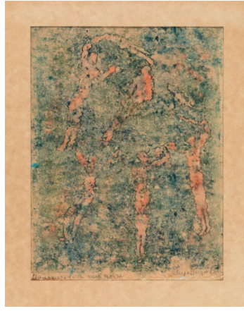
Görsel 14. Aliye Berger, Dansçılar , karışık teknik.

Yaşamının son yıllarında toplumun değişen yapısını gösteren gecekondu resimlerinde kendine has renklerle ve biçimlerle ele almıştır. Bir yandan çarpık kentleşmeye dikkat çekerken bir yandan kentte var olabilme çabalarını gösterir. 1972 yıllarına tarihlenen Gecekondu resminde evler yer kabuğunun katmanları gibi üst üste istiflenmiştir (Görsel 15). Dikey olarak yaptığı bu çalışmalarda katmanları rengarenk pembeler, morlar, maviler, sarılar, turuncularla boyamıştır.