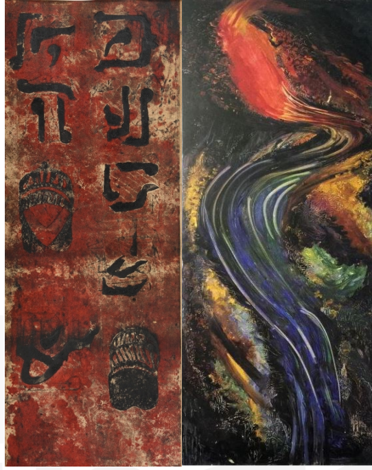
Görsel 4. Aliye Berger, Bektaşî , Gravür üzerine boyama, 76x 28 cm, Özel koleksiyon.