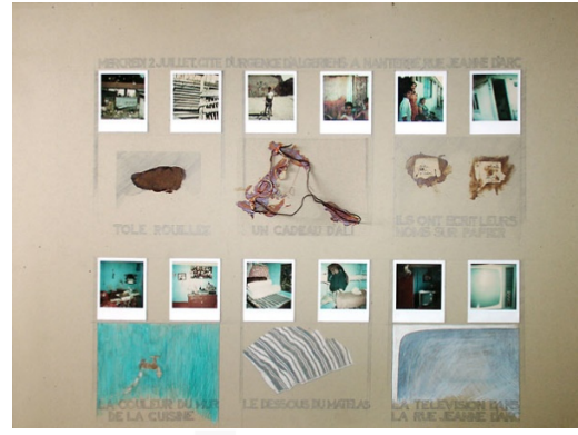
Görsel 2. Nil Yalter, Temporary Dwellings, 12 Kolaj, 1974

Nil Yalter'in çalışmalarında göçebelik, akışkan kimlik, melezlik, öteki-kimlikler gibi konuları ele alması düşünüldüğünde farklı coğrafyalardan edinilen bu kültürel deneyimlerin sanatçının kariyerine katkıları ortadadır. Paris, New York ve İstanbul'daki göçmenlerin geçici konutları üzerine polaroidler, nesnelere ve çizimler içeren 12 kolajdan oluşan Temporary Dwellings serisi (görsel 1-2) "umut, göç, yerleşim ve aidiyet duygusu inşa etme çabasının yarattığı çaresizlik sahnelerinin çizim, fotoğraf, buluntu objeler, metin ve videolar kullanılarak estetik ve dokümantasyon arasında melez üretimler olarak hayata geçirildiği işlerdir" (Oğuz, 2020: 1508). Sanatçı, "insan topluluklarını ve onların ev, ülke ve evrenle olan ilişkilerini anlamak ve ortaya çıkarmak için etnografik yöntemleri bir sanatsal üretim biçimi olarak kullanır. Bu eserler dünya/varoluşla ilgili pratiklere, inançların ve sembolik ilişkilerin bireyselliğine işaret eder" ayrıca göçmenleri görünür kılmayı hedeflerken aynı zamanda insanlarda farkındalık uyandırmak için sanat gibi farklı yöntemlerle mücadele edebileceğini vurgulamaktadır (Yücel, 2011).