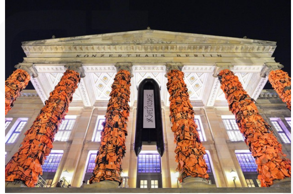
Görsel 13. AiWeiwei, Güvenli geçiş, 2016,

Ai Weiwei'nin Sidney Bienali'nde sunulan Yolculuk Yasası (görsel 13) isimli eseri kimliği belirsiz yüzlerce göçmenin 60 metre uzunluğunda bir lastik botun içerisinde betimlenerek umuda yolculuğunu göstermektedir. Bu eser sanatçının son yıllarda insan haklarını, mültecileri ve göçmenleri savunmaya odaklanmasını yansıtmaktadır. Sanatının, evlerinden zorla yerinden edilen yüzlerce insanın deneyimlerini ve koşullarını belgeleyen bir diğer eseri Güvenli Geçiş'tir (Görsel 15). Bu eser Berlin Konzerthausun ön cephesinde bulunan 6 kolonun 14.000 can yeleğiyle kaplanması ve tam ortasına da 'SafePassage' yazılı büyük bir bot asılmasıyla oluşturulmuş bu enstalasyondan oluşmaktadır. Kullanılan turuncu yelekler, Türkiye'den Yunanistan'a zor koşullarda deniz yoluyla yeni geçmeye çalışan mültecilere aittir. Ai Weiwei, mültecilerin Avrupa'ya ilk ayak bastıkları noktalardan olan Midilli Adası'na bir stüdyo kurmuştur. Sık sık adayı ziyaret eden Weiwei, mültecilere fotoğraflarını sosyal medya hesaplarından paylaşmıştır. Bu konuda tepkisini belli eden sanatçı, son olarak Danimarka'nın mülteci politikası sebebiyle ülkedeki sergisini iptal etmiştir (Merdim, 2016).