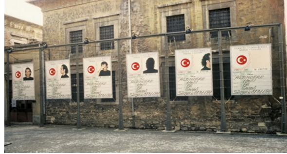
Görsel 8. Tabularla Dans II, 1997, Değişken ölçüler, 6 parça, 233 x 170 cm, 5. İstanbul Bienali

Günümüzde mültecilerin yaşadığı aidiyet problemi hem uyum hem de toplumsal kimlik olarak değerlendirilebilir. Kendi kültürlerine sahip olan mültecilerin birçoğu göç ettikleri ülkelerde uyum problemi yaşamaktadır. Sanatçının en bilinen çalışmalarından biri olan Tabularla Dans (Görsel 8) “sosyal, kültürel ve politik kodları manipüle eden, devletin resmî belgesini yeniden tanımlayan ve tartışmaya açarken ‘ben devlete göre kimim, kim olmalıyım’ sorusunu sorar.