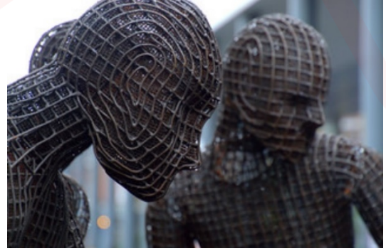
Görsel 11. Kalliopi Lemos, Yedi Kişilik Tekne, 2006,

Sanatçı eserinde kullandığı göçmen deneyimlerini temsil eden ve olaylara tanıklık eden tekneyi şu şekilde betimlemiştir: “Tekneler, anıların taşıyıcıları, hayatın farklı evrelerinde yolculuğumuzun metaforları veya doğumu veya doğurganlığı simgeleyen birer metafor olarak görülebilir. Tekneyi bir yaşam taşıyıcısı, bir rahim, yaşam kabının yanı sıra dünyaya girdiğimiz ve bu yaşamdan ayrıldığımız geçidi önermek için kullandım. Tekneler deneyimlerimizi, acılarımızı ve varoluşun farklı aşamalarını taşır” (Lemos 2010, aktaran Horsti, 2006:130).