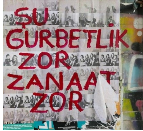
Görsel 5. Nil Yalter, Sürgün zor iş, 1976/ 2012-2019. Dijital fotoğraflardan yapılmış posterler, değişken boyutlarda.