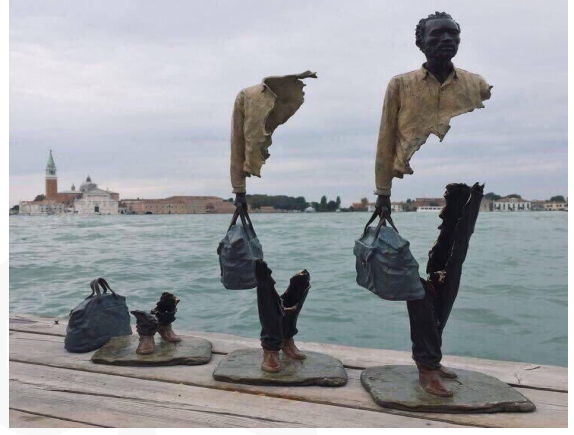
Görsel 9. Bruno Catalano, Yolcular, 1960

Sanatçı heykelleri için şu ifadelerde bulunmuştur: “Hayat yolunda hepimiz birer yolcuyuz, kimimiz iş kimimiz ise kendimizi aramak uğruna yola koyuluyoruz. Heykellerim de bir sebepten yola çıkmış, bir dünyanın insanı değil de dünyada bir insan olan ve çıkılması kaçınılmaz yolculuklara koyulmuş kişiler... Ayakları üzerinde duran ve evleri valizleri olan özgür ruhlar. Eğer yüzlerine bakarsanız hepsinde ortak bir şey görürsünüz, gurur. Yola çıkmış olmanın ve yol alıyor olmanın haklı gururu ile başı dik yürüyen insanlar hepsi. En önemlisi de kendilerini gerçekleştirmeye çalışan, her an kendilerini tamamlayan ‘eksik’ insanlar...” (Bozkurt, 2016).