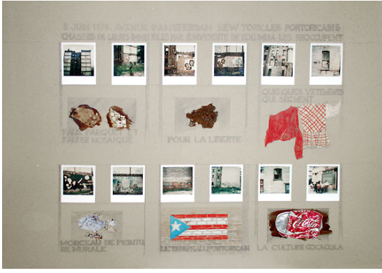
Görsel 1. Nil Yalter, Temporary Dwellings, 12 Kolaj, 1974