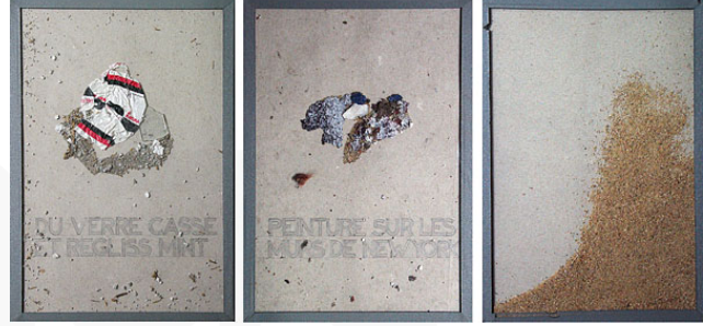
Görsel 3. Nil Yalter, Temporary Dwellings 2, 1974