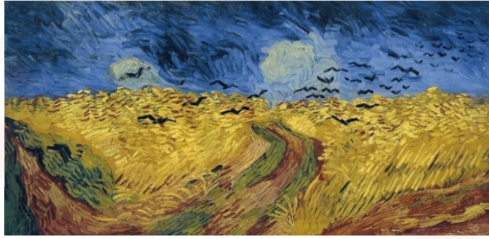
Görsel 4. Van Gogh, Kargalar ile Buğday Tarlası, 1889, Tuval Üzerine Yağlı Boya, 50,5 x 103 cm, Van Gogh Müzesi

Van Gogh, doğanın yatay sonsuzluğu içerisinde kimi zaman buğday tarlasını, kimi zaman ay çiçeğini görünür kılmıştır. Sanatçı istediği biçimi ön plana çıkartırken istediği de biçimi de geriye atmıştır. Bu sayede mekânın detayda saklı olan büyüü bakışı bakmaya itmiştir (Görsel 4) (Altaş, 2018: 21).