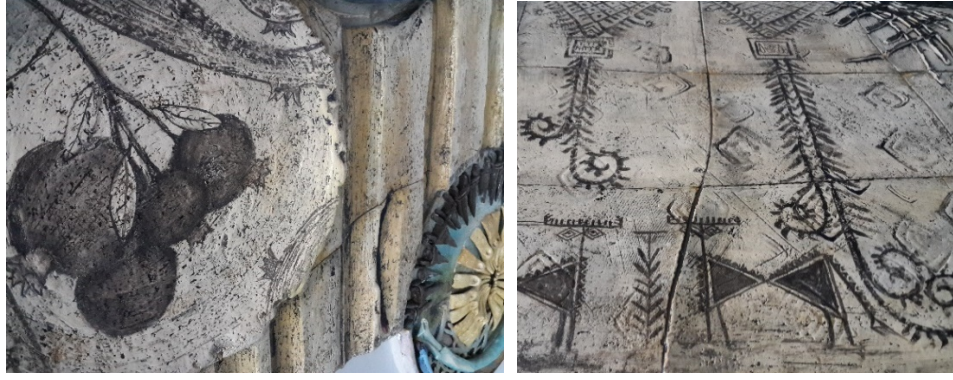
Görsel 18-19. Bereket, çalışma detay

Çalışmada tasarım ögesi olarak sıraltı dekor uygulanarak resmedilen turna kuşu ve buğday başağı toplumlarda bolluk bereketin vazgeçilmez iki unsurudur. Kavramsal anlamlarının yanı sıra ergonomik yapılarıyla da çalışmaya hareket ve biçim zenginliği katabilecekleri düşünülmüştür (Görsel 20). Yuvarlak form içerisindeki kurgulamada ise geyik boynuzlarından yola çıkarak tasarlanmış olan 3 adet yatay biçimin üzerine yine yorumlanmış geyik formundan oluşan baskılarla kurgulama yapılmıştır (Görsel 21).