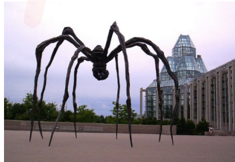
Görsel 8. Louise Bourgeois, Örümcek, 1999, Bilbao

Anadolu’da bereket sembolü olarak ta görülen örümcek salt biçimsel yönüyle sanatçılara esin kaynağı olmuştur. Heykeltıraş Louise Bourgeois örümceği sanatsal imge olarak çalışmıştır. Çalışma Kanada Ulusal Galerisi önünde kalıcı olarak sergilenmektedir (Görsel 8).