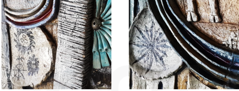
Görsel 14 -15. Bereket, çalışma detay

Çalışmada sıraltı yöntemiyle tasarım imgesi olarak kullanılan ve Anadolu’da farklı dönemlerde stilize edilmiş olan güneş sembollerini görmekteyiz. Güneş doğadaki tüm canlılar ve bitkiler için ışın ve besin kaynağı özelliğiyle önem taşımaktadır. Anadolu’da aydınlık ve bereketin önemli bir sembolü olarak dikkat çekmektedir. Kavramsal yönü veya biçimiyle sanatçılarındaki çalışmalarında direk veya dolaylı imge olarak kullanmada bir esin kaynağıdır (Görsel 14-15).