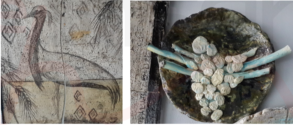
Görsel 20-21. Bereket, çalışma detay

Çalışmada tasarım ögesi olarak sıraltı dekor uygulanarak resmedilen turna kuşu ve buğday başağı toplumlarda bolluk bereketin vazgeçilmez iki unsurudur. Kavramsal anlamlarının yanı sıra ergonomik yapılarıyla da çalışmaya hareket ve biçim zenginliği katabilecekleri düşünülmüştür (Görsel 20). Yuvarlak form içerisindeki kurgulamada ise geyik boynuzlarından yola çıkarak tasarlanmış olan 3 adet yatay biçimin üzerine yine yorumlanmış geyik formundan oluşan baskılarla kurgulama yapılmıştır (Görsel 21).