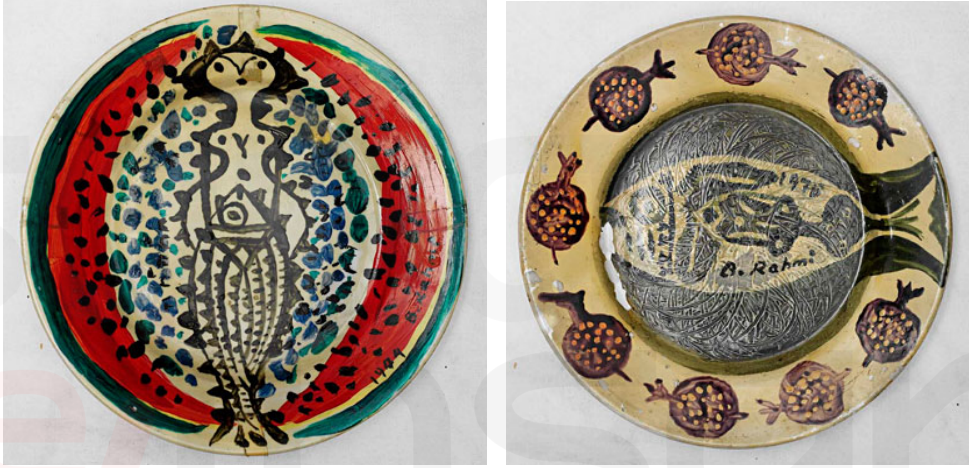
Görsel 9-10: Bedri Rahmi Eyüboğlu, karpuz, kadın, balık, nar, nar imgesiyle resimlenmiş tabaklar, 1975

Seramik tabak çalışmalarında; “Melengeç” adlı kadın figürleri, narlar, karpuzlar ve balıklarla iç içedir. Bedri Rahmi, Melengeçleri bazen bir karpuzun ya da bir balığın içinden çıkarken göstermiştir. Bunların bir bereket metaforu olduğu akla gelir. Bu bereket hem kadının, hem nakışın, hem de Bedri Rahmi’nin üretkenliğinin bereketi olmalıdır. Halk kültüründe de kadın bedeni ve nar gibi sembollerin bereketle ilişkisi vardır, balık ise denizin bereketidir, kısmettir. Çağlar boyunca Anadolu kültürlerinin hemen hepsinde yer etmiş bereket kültürünün izleri halk sanatlarında da gözlenir. Bedri Rahmi gibi Anadolu kültürlerine ve ürünlerine yakınlığı ile bilinen bir sanatçının bu simgeleri kullanması şaşırtıcı değildir (Görsel 9-10) (Yemenicioğlu, vd.2019: 862).