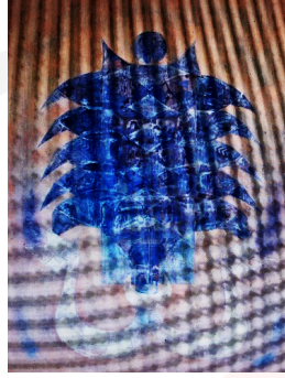
Görsel 1. Gülşen Ağyürek, Hayat Ağacı, 2010 Tuval Üzerine Karışık Teknik, 100x80 cm

Bu çalışmada yıldız, ay ve güneş gibi kozmolojik terimlerin bulunmasının yanında, hayat ağacının altında bulunan birçok hayvanın hayali birleşimiyle paradoks olarak ortaya çıkan çift başlı ejder bu kompozisyonun ana dengesini oluşturmaktadır (Görsel 1) (Ağyürek, 2011: 83) .