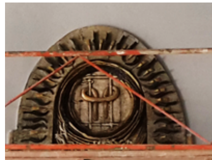
Görsel 12-13. Bereket, çalışma detay