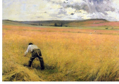
Görsel 3. “Olgunlaşmamış Buğdaylar”, Jules Bastien Lepage, 1880, Tuval üzerine yağlıboya, 50,7x105 cm, Musee Canadien de la Guerre, Kanada

Van Gogh, doğanın yatay sonsuzluğu içerisinde kimi zaman buğday tarlasını, kimi zaman ay çiçeğini görünür kılmıştır. Sanatçı istediği biçimi ön plana çıkartırken istediği de biçimi de geriye atmıştır. Bu sayede mekânın detayda saklı olan büyüü bakışı bakmaya itmiştir (Görsel 4) (Altaş, 2018: 21).