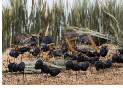
Görsel 6. Buket Acartürk, Tohum Takas Projesi, 1,5 m 2 , 2014

biçime dönüştürmektedir. Karıncaları özellikle örgütlü yaşam biçimleri ve disiplinleri nedeniyle seçmiş olan sanatçı, “Tohum-Takas” isimli projesinde buğday başağı taşıyan karıncaları ile yeryüzünün yoksulluk ve beraberinde en temel sorunu olan açlık durumuna dikkat çekmek istemiştir (Gökbel, 2018: 212).