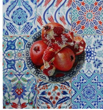
Görsel 7. İsmail Acar, Çinili Nar, T.Ü.K.T., 75 x 75 cm

İsmail Acar’ın Anadolu’daki bereket sembolleri içerisinde sıkça rastladığımız nar formunu seramik eserlerinde sanat imgesi olarak kullandığını görmekteyiz. Nar isimli resimde çini motifleriyle kaplı bir zemin üzerinde yer alan bir çini tabak içerisinde narlar görülmektedir. Eserde ikisi bütün, ikisi parçalanmış ve taneleri görülen toplamda dört tane nar ile geri plandaki çiniler üzerinde stilize edilmiş, narçiçeği desenleri dikkati çekmektedir. Türk Sanatının en önemli ve başarılı süsleme dallarından birisi olan çinicilikte, bitkisel motiflere sıkça yer verilmektedir. Doğadan yola çıkılarak oluşturulan bu motifler içerisinde stilize edilmiş nar meyvesine ve çiçeğine de sıkça rastlanmaktadır. Çini sanatının kendine has etkileyici mavi ve kırmızı renklerinin mükemmel uyumu içerisinde kırmızı renkteki narların hiperrealist bir anlayışla çarpıcı bir şekilde yansıtıldığı görülmektedir (Görsel 7) (Büyükkol, 2020: 116).