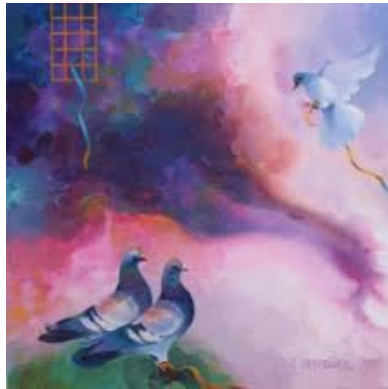
Görsel 5. İsimsiz, Kadir Şişginoğlu, Tuval Üzeri Karışık Teknik, 50x50 cm, 2015

Kadir Şişginoğlu eserlerinde güvercin imgesini merkeze koymaktadır ve güvercin, birlik, bereket, umut, inanç, sevgi, güzellik, aşk temalarını tablolarına yansıtmaktadır. (Görsel 5) (Şişçi, 2018: 51).