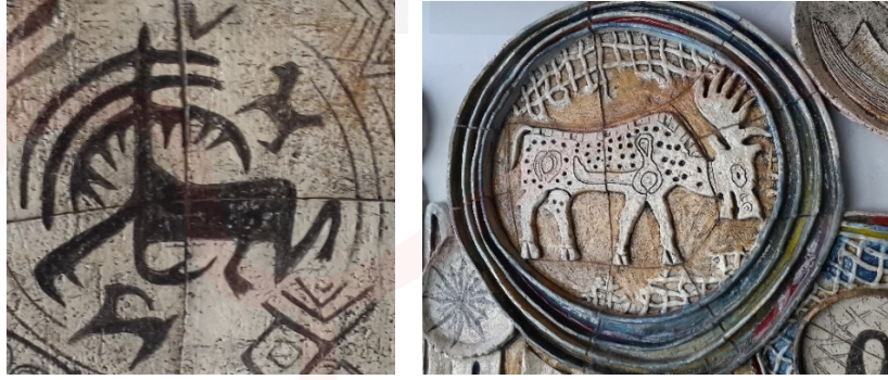
Görsel 16-17. Bereket, çalışma detay

Anadolu coğrafyasında da bulunan geyiğin insan yaşamında sembolik olarak önemli bir yeri vardır, saflığın ve bereketin sembolüdür. Çalışmada imge olarak yorumlanmış geyik biçimlerinden ilki M.Ö. 3300 yılında Arslantepe Höyük Sarayı mühür baskısı olarak işlenmiş stilize geyik formudur ve sıraltı resimleme tekniğinde uygulanmıştır (Görsel 16). İkincisi ise Pazırık Halısı’nda bulunan geyik yorumlamasıdır (Görsel 17).