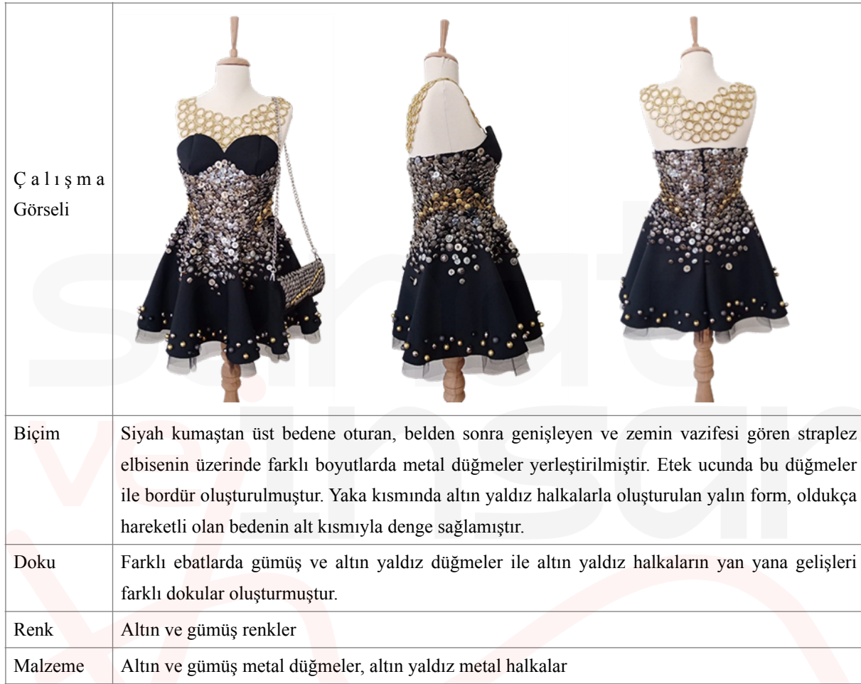
Tablo 2. Görsel 10,11,12. Tekstil ve Moda Tasarımı Bölümü Öğrencisi Büşra Fındık'ın Düğmelerden Oluşan Sanatsal Giysi Tasarımı

halkaların yalınlığı oldukça hareketli olan bedenin alt kısmıyla denge kurmuştur. Tasarımı tamamlayan aksesuar olarak kullanılan çanta yine aynı ürünlerle bezenmiştir (Tablo 2) (Görsel 10,11,12).