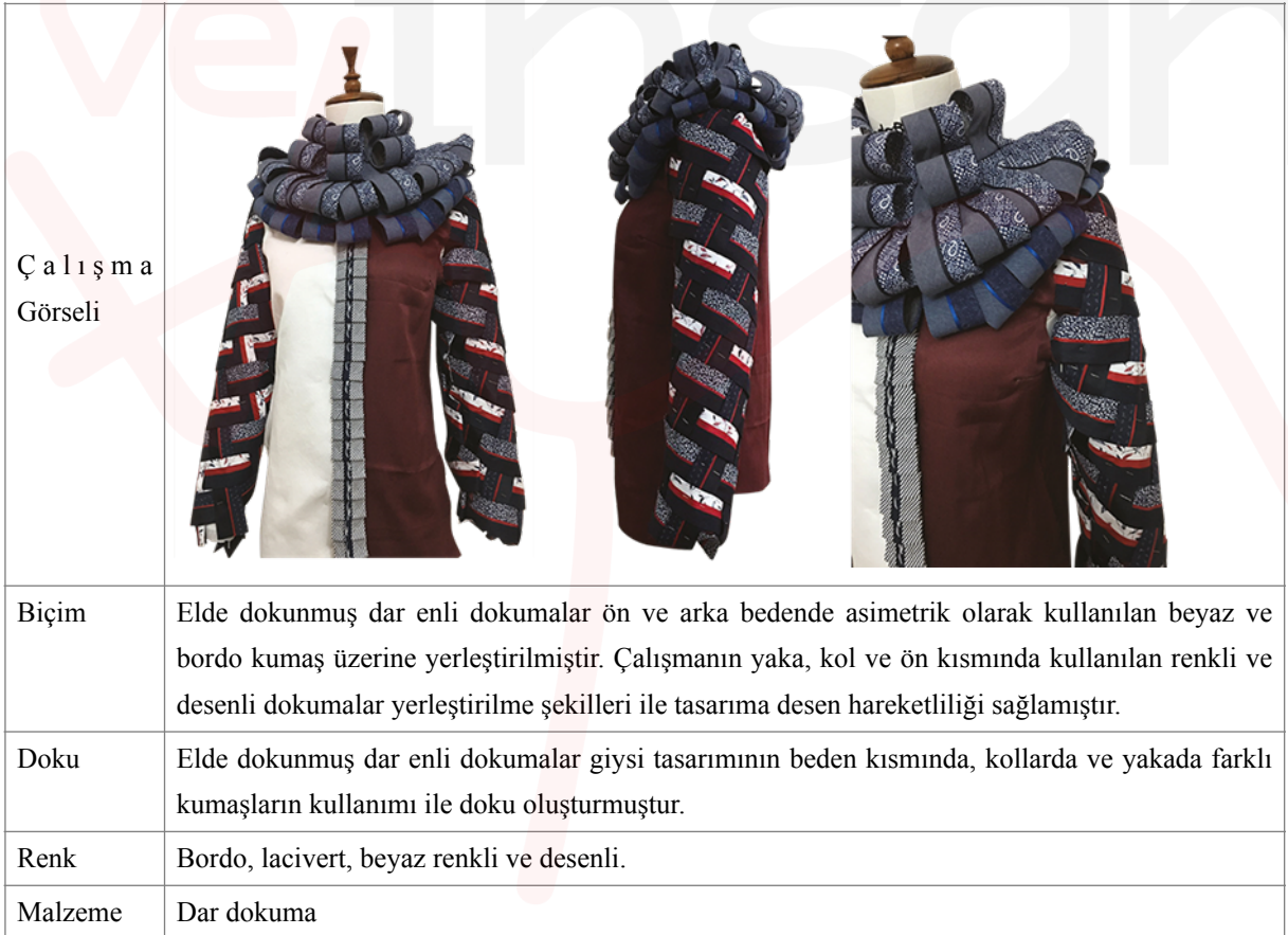
Tablo 5. Görsel 19,20,21. Tekstil ve Moda Tasarımı Bölümü Öğrencisi Semanur Özkaya'nın Dar Dokumalarla Oluşturduğu Sanatsal Giysi Tasarımı

Diğer bir çalışmada ise dar enli dokumalar kullanılmıştır. Öğrencinin elinde dokumuş olduğu dar enli dokumalar beden kısmında asimetrik olarak kullanılan beyaz ve bordo kumaş üzerine yerleştirilmiştir. Çalışmanın yaka, kol ve ön kısmında kullanılan renkli ve desenli dokumalar yerleştirilme şekilleri ile tasarıma desen hareketliliği sağlamıştır. Yaka kısmında kullanılan dört katlı volanlı yaka çalışmada hacim etkisi yaratmıştır (Tablo 5) (Görsel 19,20,21).