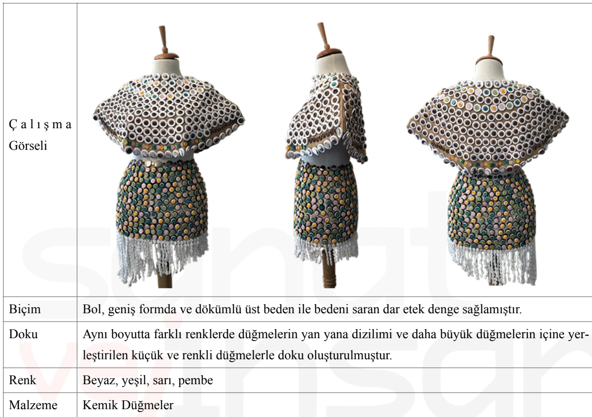
Tablo 3. Görsel 13,14,15. Moda Tasarımı Bölümü Öğrencisi Özlem Altunkaya'nın Düğmelerle Oluşturduğu Sanatsal Giysi Tasarımı

Gümüş metal ve siyah düğmeler, yuvarlak kemer tokaları, zincirler ile oluşturulan sanatsal çalışma mini etek ve büstiyerden oluşmaktadır. Metal düğmelerin büstiyerde büyükten küçüğe doğru ve her iki tarafta da simetrik dizilimi, kabarık bir doku oluştururken göğüs ve etek kısmını birleştirmesi de çalışmada bütünlük yaratmıştır. Tasarımın ön kısmında kullanılan yuvarlak kemer tokalar, gümüş metal, siyah düğmeler dairesel hareketlilik etkisini baskın bir şekilde hissettirirken, arka kısmında kullanılan metal zincirler çizgisel bir etki oluşturmaktadır (Tablo 4) (Görsel 16,17,18).