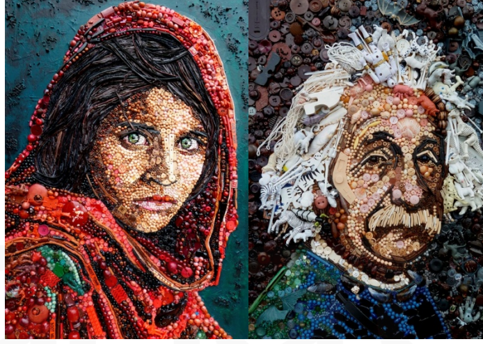
Görsel 1, 2. Jane Perkins'in Tekstil Ürünleri İle "The Afghan Girl" Ve "Einstein" Portreleri (Kurtuldu, 2014, s.281)

olarak kullanılmamış; tamamen sanatçının tuvalindeki renk ve boyanın yerine geçmiştir (Kurtuldu, 2014, s.281) (Görsel. 1, 2).