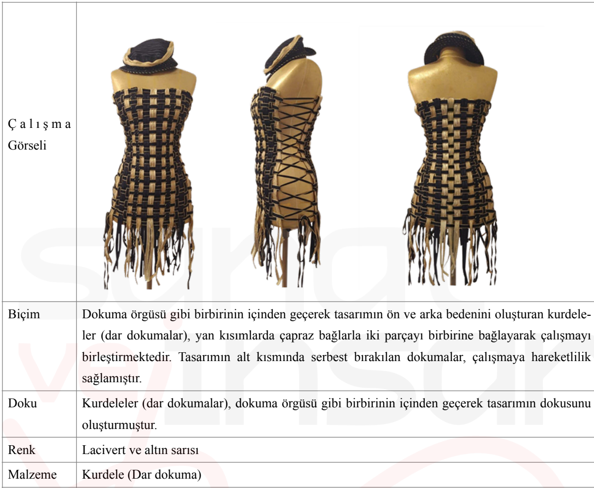
Tablo 7. Görsel: 25,26,27. Moda Tasarımı Bölümü Öğrencisi Rana Ersöz'ün Dar Dokumalardan Oluşturduğu Sanatsal Giysi Tasarımı

Diğer bir çalışma ise; çeşitli renk ve ende yapılmış dantel dokumaların bir araya geliş biçimlerinden oluşmaktadır. Bedene oturan üst kısımda, dokumaların yan yana geliş şekilleri ile yüzeyde desen ve doku etkisi baskın olarak görülmektedir. Omuz kısımlarında kullanılan dokumalar dikiş tekniği ile fırır şeklini alarak çalışmaya hareketlilik sağlarken, etek kısmında enine kullanılan dokumalar ince, kalın çizgi etkisi yaratmıştır (Tablo 8) (Görsel 28,29,30).