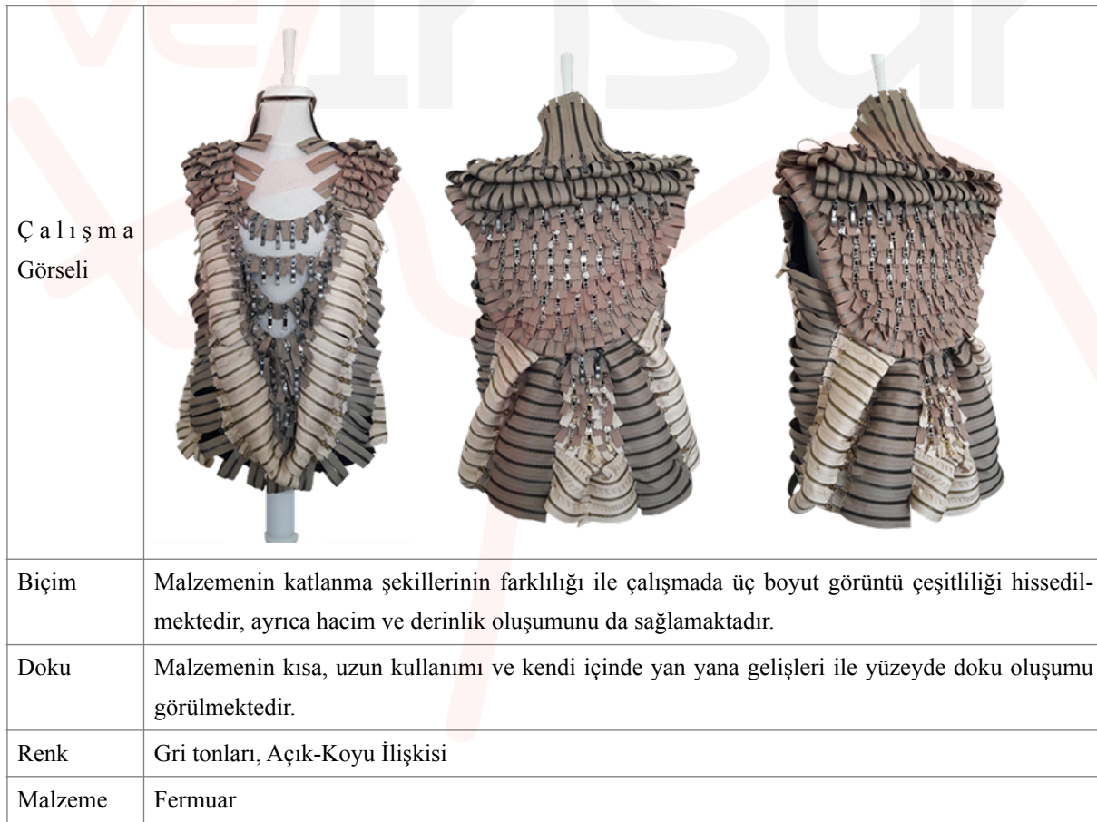
Tablo 1. Görsel 7,8,9. Tekstil ve Moda Tasarımı Bölümü öğrencisi Berna Özadenc’ın fermuarlardan oluşturduğu sanatsal giysi tasarımı

İstanbul Okan Üniversitesi, Sanat ve Tasarım Fakültesi, Tekstil ve Moda Tasarım Bölümü öğrencilerinin yapmış olduğu çalışmalardan ilki; tekstil yan ürünü olarak tanımlanan fermuar ile yapılmıştır. Yaklaşık üç yüz adet, 15cm.lik fermuarlar ile oluşan tasarımda renk olarak gri ve tonları seçilmiştir. Gri tonlarının farklı kullanılması, çalışmanın yüzeyinde açık-koyu renk gamı oluşturmuştur. Malzemenin özelliği ve yüzeyde sıralı kullanımı ile çalışmada çizgi görüntüsü baskın olarak görülmektedir. Aynı zamanda fermuarların katlanarak belli bir form ile yüzeye yerleştirilmesi çalışmada hacim ve derinlik yaratırken, ürünün mat ve parlak kullanımı ile yüzeyde görsel hareketlilik sağlanmıştır (Tablo 1) (Görsel 7,8,9).