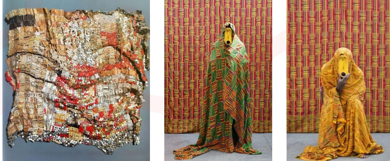
Görsel 9 (Solda). El Anatsui, Woman’s Cloth, 2002 (Spring, 2012, 23).

Müzik ve Sinemanın yanı sıra kente dokumalarının Gana kökenli çağdaş sanatçılara da ilham verdiği örnekler mevcuttur. El Anatsui’nin Afrika tekstilleri ve kentelerden ilham alarak oluşturduğu eserleri ilgi çekici örnekler arasındadır. Sanatçının 2002 yılında metal folyolar ile yaptığı “Woman’s Cloth” adlı British Museum’da sergilenen çalışmasında bu etkiler göze çarpmaktadır (Görsel 9) (Spring, 2012, 22). Bir diğer örnek teşkil eden sanatçı ise “Kente Sculpture” çalışmaları ile Serge Attukwei Clottey’dir (Görsel 10). Sanatçı çalışmalarında kendi geliştirdiği bir kavram olan “Afrogallonism” ile çevresel ve sosyal adalet kavramlarının altını çizmiştir. Atıkların göçü ile Gana’da biriken atık sarı galonları kullanarak kente dokumalarının bir araya getiriliş şekillerinden ilham aldığı ya da kente kumaşlarını yerleştirmelerinde kullandığı eserleri alanında öncü nitelik taşımaktadır.