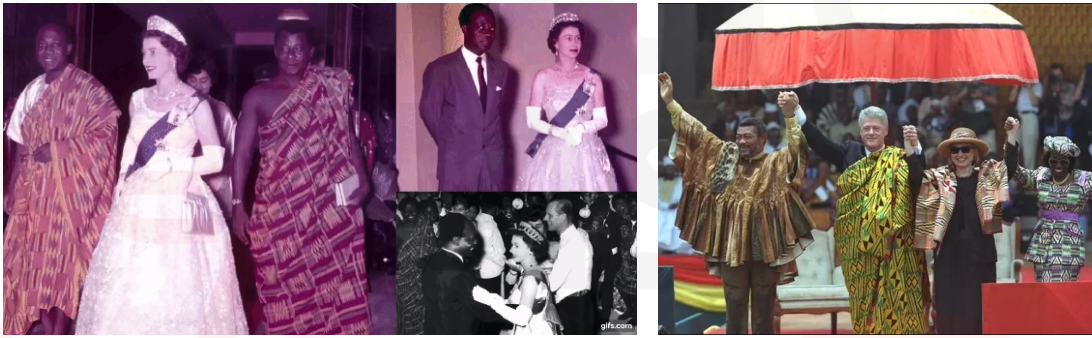
Görsel 4 (Solda). Queen Elizabeth II ve Nkrumah, 1961, Gana.