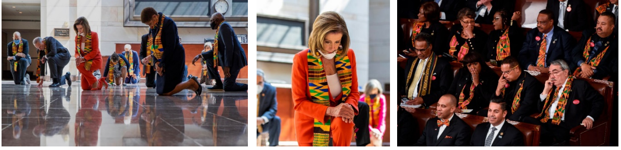
Görsel 15 (Solda ve Ortada). Demokratların George Floyd için Kenteler ile Saygı Duruşu.