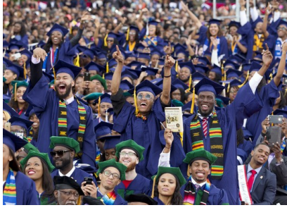
Görsel 11 (Solda). Howard Üniversitesi Mezunlarının Cüppelerine Taktıkları Kente Kuşaklar.