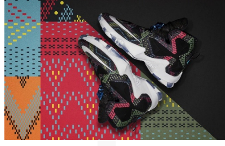
Görsel 12 (Sağda). Kente Desenleri ile Tasarlanmış Nike Spor Ayakkabı.