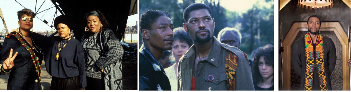
Görsel 6 (Solda). “Ladies First” İsimli Video Klipte Queen Latifah’ın Taktığı Kente.