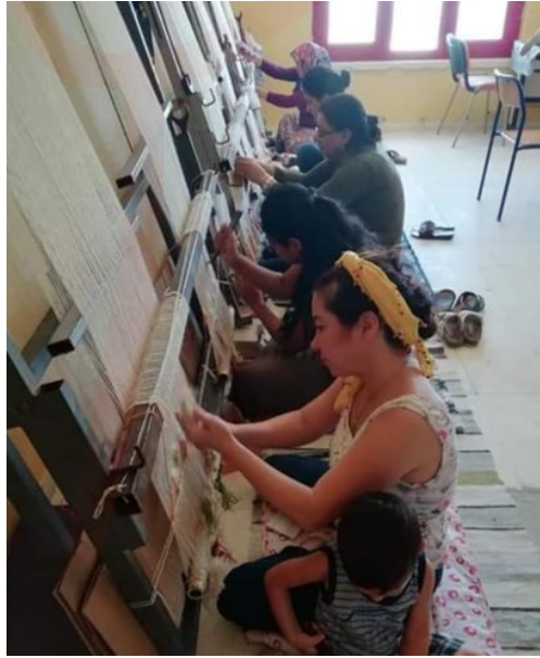
Görsel 1. Halı dokuma Atölyesi

Yerel yönetimler bünyesinde yürütülen meslek edindirme kursları halı ve kilim dokuma yaygılarının üretimine katkı sağlamaktadır (Görsel 1). Geleneksel bilgi ve üretim bu tür kurslar ve eğitim programları ile yaşatılmaktadır. Bu sanatın yaşatılması ve genç kuşaklara aktarılması gayesiyle açılan kurslar ve yapılan projelerde özellikle işsiz ve emekli hanımların çalışmalarına imkân sağlanmaktadır (K.K. Çolak). Halı ve düz dokuma yaygılarının sanatsal değerlerinin yanında ekonomik değeri de vardır. Bir dokuyucuyu ilgilendiren, ileride müzeye girecek bir ürün ortaya koymak değil, pratik olarak günlük gelirini kazanacağından emin olmaktır. O nedenle dokumalarda “kimliğin korunması” sorumluluğu artık dokuyucuda değil, devletin bu konu hakkında kuracağı özel sistemlerin sorunudur (Küçükerman, 1997: 46).