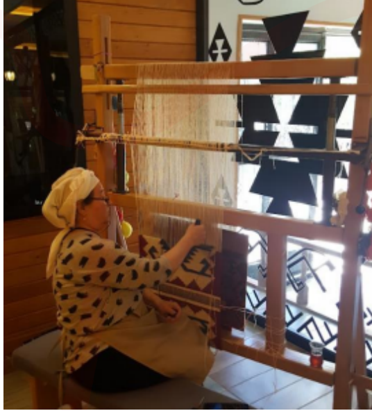
Görsel 3. Sivrihisar Uygulamalı Kilim Müzesinden

Halı ve düz dokuma geleneğinin korunmaya çalışıldığı alanlardan biri de dokuma tamir atölyeleridir. Gerek dış etkilere maruz kalan gerekse yılların getirdiği yorgunlukla halı ve düz dokumalar bu atölyeler sayesinde ömrünü uzatmaktadır. El dokuma halılarının alınıp, satıldığı, değerlendirme yapıldığı halı ve düz dokuma işyerleri, düzenlenen mezzatlarla, e-ticarette sektörde hareketlilik sağlamakta, mevcut olan dokumalar bu sayede el değiştirmektedir (K.K. Arısoy).