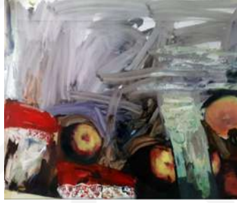
Görsel 3. Binnaz Koca, X-ray görüntüleri, Dijital baskı üzerine yağlıboya, 65*55 cm, 2018

Katılımcıya, çalışmalarında oluşan natürmortların sebebini sorulduğunda verilen yanıt: “Onlar x-ray cihazlarından elde ettiğim görüntüler. Hem geçmiş işte belki sadece bir odaya ait bir şey varken, özel yaşam varken yani odanın içinde kalan özel yaşam durumu varken, şimdi bu biraz daha immm şeye dönüşüyor, herkesin gözü önünde olma durumu. Çantanın güvenlik kamerasından geçtiği yani x-raydan geçtiği anda yani geçmişi düşün şey var x-ray çıktılarını alıyorum natürmort hazırlayıp. Bu dijital baskıyla elde ediliyor (1.görüşme katılımcı).” olmuştur. Katılımcının bu ifadelerinden yola çıkarak yalnızca konu ve resim sanatı ilişkisi üzerine resim çalışmaları yapmaktan ziyade, bu çalışmalardaki tür ve kompozisyonun belirlenmesinde de özel yaşam ihlaline sebep olan unsurlardan faydalanarak bir takım yerleştirmelere gittiği çıkarılabilir. Yani katılımcının x-ray cihazlarından elde ettiği görüntülerden yararlanarak, hazırladığı natürmortları sanata dâhil ediş sürecinden bahsetmektedir denilebilir. Özel yaşamın bizlerde oluşturduğu izler, teknolojik cihazlarda kayıt altına alınan görüntülerden yararlanılarak meydana gelmiştir. Örneğin, havaalanında, alışveriş merkezlerinde olan x-ray cihazlarının kayıt altına aldığı görüntülerden oluştuğu söylenebilir.