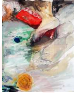
d- 110*90 cm