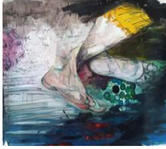
Görsel 2. Binnaz Koca, X-ray görüntüleri, Dijital baskı üzerine yağlıboya, 50*45 cm, 2018

“Ve onu kontrol eden şeyler bende neydi, güvenlik mesela. Güvenlik kameraları, gözetim, gözetim toplumu bununla alakalı iki yapının birleşimi. Yani bir taraftan korurken gözetim toplumunu düşün, güvenlik kameralarını düşün, koruma amaçlı ama aynı yerde de özel yaşamın alanlarının nerede başlayıp nerede bittiğini gösteren ince bir çizgisi olmuş oluyor. Bu benim özel yaşamım ama çantan x-ray cihazından geçerken içindekiler o özel yaşamın güvenlikle alakalı bir noktada durumu değişiyor. Yani iki nokta var içerikte diyebiliriz; özel yaşam ve gözetim toplumu (1.görüşme katılımcı).” diyen katılımcının sözlerinden hareketle, konuyu ele alma biçimi ve konuya olan bakış açısının karşıtlıklardan oluştuğu yorumu yapılabilir. Katılımcı toplum tarafından olumlu anlamda hayata geçirilen uygulamaların, aynı zamanda mahremiyeti ve özel alanı yok sayan faktörler olduğunu, bunun ise kişilerin güvenliğini sağlarken, bir yandan da özel alanın güvenliğini yıkan etkilere sahip olan unsurlar olduğunu resimsel yorumlamalarla dile getirmeye çalıştığı söylenebilir.