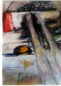
e- 110*80 cm