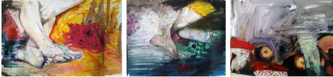
a- 130*100 cm

Araştırmacı bu süreçte nasıl ilerleyeceğine ilişkin ipuçları arar, verileri toplamaya başlar, gözden geçirir, keşfeder ve araştırmaya nasıl devam edeceğine karar verir. Zamanını nasıl değerlendireceğine, araştırmayla nereye varacağına, kimle görüşeceğine, neyi derinlemesine inceleyeceğine karar veren araştırmacı, düzenlemeyi sürekli olarak şekillendirir (Bogdan ve Biklen, 1998: 54). Bu araştırma sürecinde hiçbir müdahalede bulunmayan araştırmacı, yalnızca katılımcının yapmış olduğu beş çalışmayı inceleyerek, daha önceden belirlenen amaçlar doğrultusunda hazırlanan sorular ile görüşmeler gerçekleştirmiş ve söz konusu görüşmeler esnasındaki tüm sesli, yazılı ve görsel verileri kayıt altına alarak araştırma dokümanı olarak kullanmıştır.