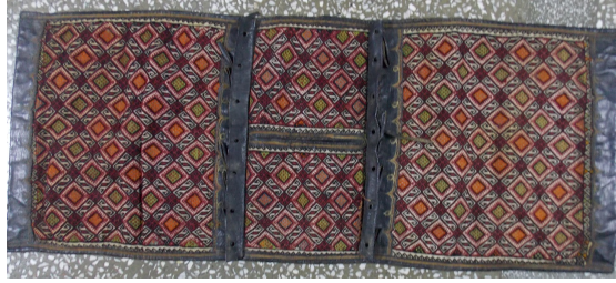
Görsel 9. Düz Dokuma Heybe Örneği, Arapgir, Serge Köyü, (Bozdağ Kişisel Arşiv)

Malatya yöresi heybe gözü denilen kısım ve ağ parça kenarları genellikle ince bir suyolu veya çengel motifleriyle çerçevelemiştir. Heybede bulunan sulara S kıvrımlı dal bağlantılı yaprak, dallar ve çiçek, bereket, küpe, sığır sidiği, göz, çarpı, geçmeli geometrik formda klasik dokuma yanırları sıklıkla yer alır. Malatya yöresinde atlarda kullanılmak üzere saraçlı heybe örnekleri de tespit edilmiştir. Atlı kültür olarak bilinen Türkler atlarına her zaman özel bir ihtimam ve hassasiyet göstermiştir (Acar:1982). Tarihte saraçlık zanaatı 20. yüzyıl son çeyreğine kadar hatta son çeyreği de dâhil çok önemli bir zanaat kolu olarak yerini her zaman korumuştur. Heybelerin sağlamlığını, kullanım heybenin ömrünü uzatmak, eskimesini geciktirmek, heybeleri daha kullanışlı ve dokumayı gösterişli hale getirmek için heybelerin kenarlarına deriden saraçlama uygulamaları yapılmıştır. Heybe saraçla uygulaması; heybe tabanı, heybe gözlerinin ağız kenarları, göz kapakları, dış kenarlar ve ağ parçası kenarlarının meşin-deri bantlarla kaplanması işlemi olarak adlandırılır. Heybelerde kullanılan deri bantlar sade veya süslü dikişlerle bezenerek sıkıca tutturulmuştur (Akalm: 1993).