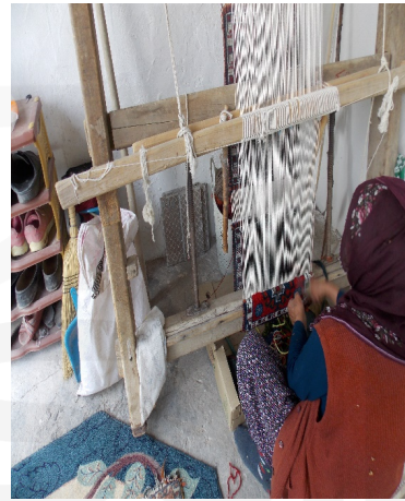
Görsel 5. Dokuma Tezgahı

1979 tarihinden 1986 yılları arasında kazı çalışmalarını yürüten Pirot, Caferhöyük arkeoloji çalışmaları, Aslantep ve Değirmen-tepe kazıları, sonucu raporlanan dünyanın ilk sayılan heykel örneği olarak bilinen, beyaz kireçtaşı kullanılarak yapılmış olan küçük figüratif şekilleri, M.Ö. 7000 yılına dayandırılılabileceği tarihlenmektedir. Bu kazılarda seramik parçaları, boncuk, savaş aletleri, dokuma parçaları ve birçok dini eser çıkarılmıştır. Kazı sonrası sergilenmek üzere gün yüzüne çıkarılan bu eserler şu anda Malatya müzesi tarafından korunmakta ve sergilenmektedir (Ufuk:1984).