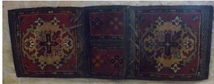
Görsel 7. Halı Dokuma Heybe Örneği, Pütürge, Tepehan Köyü, (Bozdağ Kişisel Arşiv)

Malatya yöresi düz dokumaları yaygınlığında ünlüdür (Deniz:2010). Özellikle yörede parmak, sandık, göbek, göl, koçboynuzu, çengel, gılç, pıtrak, küpe ve bereket yanlışlarının yaygın olarak kullanıldığı gözlenmiştir (Deniz:1994). Alan araştırmasında yanlışların yöresel ifadeleri ve yöreler arası aynı yanlışların farklı isimlerle adlandırıldığı tespit edilmiş. Gündüzbey ilçesi köyleri araştırıldığında Adıyaman yöresinde de yaygın olarak kullanılan çengel yanlışına cengelo, cenge olarak adlandırdıklarını, Sivas yöresine sınır komşusu olan Hekimhan yöresinde ise bu yanlışın çengel, çakmak, eğri olarak isimlendirdikleri tespit edilmiştir. Malatya yöresi heybeleri insanların kullanımı, binek hayvanlarda kullanılmak üzere dokunmasının yanı sıra dekoratif amaçlı dokunan örnekleri de tespit edilmiştir. Malatya evlerinde avlu denilen ve avluya açılan çift kanatlı veya tek kanatlı kapılar vardır (İskenderoğlu:2009).Avluya açılan bu kapıların sağ veya sol tarafındaki ahşap direklerin üzerine asılmak suretiyle konan ebatları küçük dekoratif amaçlı heybe örnekleri de çalışma sahasında kaydedilmiştir.