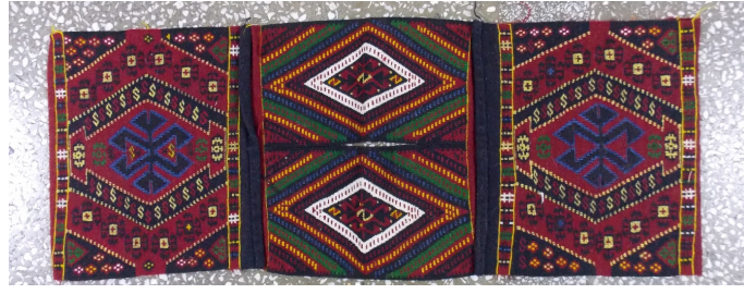
Görsel 11. Düz Dokuma Heybe Örneği, Darende, Gökçeören Köyü, (Bozdağ Kişisel Arşiv)

Pütürge yöresinde heybe dokumalarda kırmızı renk kullanımı daha yaygın olduğu tespit edilirken Darende yöresinde yünün kendi doğal renginde dokuma örnekleri yaygın olarak tespit edilmiştir. Renkler eski reçetelerle bitki köklerinden elde edilen boyama yöntemi kullanıldığı bir dönem yöreye gelen çerçi veya yöreye belirli dönemlerde gelen boyama ustaları tarafından boyandığı son dönemlerde ise Malatya merkez de bulunan boyahanelerde boyatıldığını kaynak kişiler ifade etmişlerdir.