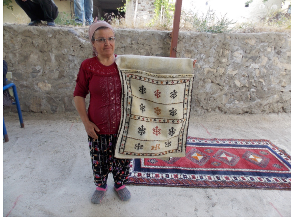
Görsel 6. Düz Dokuma Heybe Örneği, Akçadağ, Çoban Uşağı Köyü, (Bozdağ Kişisel Arşiv)

İçine malzeme konulup taşınması için yapılmış olan heybelerin bazılarının orta kısmı dokunurken yarı dokunur. Heybedeki yarı dokunmuş kısım eşek ya da atın semerinin kaşına gelecek şekilde yerleştirilir. Bazı heybeler, hayvanın silkelene veya irkilmesi esnasında heybenin iç kısmındaki eşyaların dökülmesini önlemek için, kapak mahiyetinde olmak suretiyle ağız kısmı uzun olarak dokunmuştur (Ergüder:2009). Heybe dokumalarının üzerine yöreye özgü yanlışlar ve nazar değmesine ya da uğursuzluğa iyi geldiğine inanılan boncuk, deniz kabuğu, deve dişi dikilir. Heybe dokumalarında özellikle, at üzerinde kullanılan örnekler incelendiğinde çok süslü olduğu görülmüştür (Pekin:1974).