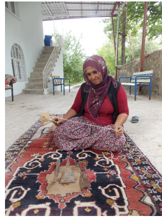
Görsel 3. Dokuma Aletleri

Özellikle boyalı vazolar üzerindeki dokuma ile ilgili resimler bu konuya aydınlık getirmektedir (Fazlıoğlu:1997). Anadolu'da dokumacılık Küçük Asya adı ile anılan Anadolu, Asya ile Avrupa arasında kalan üç tarafı denizlerle çevrilmiş ve sıradağlar ile çeviri olarak korunmuş bir yarımada şeklindedir. Çeşitli iklimi, çeşitli coğrafi bölgelere sahip