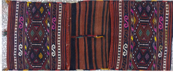
Görsel 12. Düz Dokuma Heybe Örneği, Darende, Günpınar Köyü, (Bozdağ Kişisel Arşiv)

Pütürge yöresinde heybe dokumalarda kırmızı renk kullanımı daha yaygın olduğu tespit edilirken Darende yöresinde yünün kendi doğal renginde dokuma örnekleri yaygın olarak tespit edilmiştir. Renkler eski reçetelerle bitki köklerinden elde edilen boyama yöntemi kullanıldığı bir dönem yöreye gelen çerçi veya yöreye belirli dönemlerde gelen boyama ustaları tarafından boyandığı son dönemlerde ise Malatya merkez de bulunan boyahanelerde boyatıldığını kaynak kişiler ifade etmişlerdir.