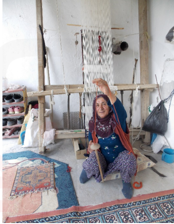
Görsel 4. İp Eğirme İğ-Taşı

Anadolu dokumacılığının 8500 yıl önce varlığından söz edilmektedir. En son Urfa Göbekli tepedeki kazılar Anadolu'da M.Ö. 10.000'den bu yana insan yerleşiminin varlığını ortaya koymaktadır. Günümüzde örneklerine rastlanılan geleneksel dokumacılığın Anadolu'da köklü bir geçmişi olduğu görülmektedir (Atalayer: 2012). Dokumacılık Anadolu'ya yerleşmiş her kültürden insanı ortak bir uğraşta birleştirmiş, günlük uğraşların belirlenmesinde, toplumsal uyumu sağlamada önemli rol oynamıştır (Yağan:1978).