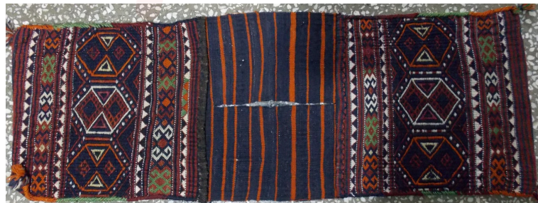
Görsel 13. Düz Dokuma Heybe Örneği, Hekimhan, Mollaibrahim Köyü, (Bozdağ Kişisel Arşiv)

Malatya yöresi heybe dokuma örneklerinin kompozisyon özellikleri incelendiğinde; yoğun olarak geometrik süslemeleri uygulandığı dikkat çekmektedir. Saha araştırmasında görülen dokuma örneklerinde yaygın kullanım olarak ortada büyük baklava ve ya yörede çengelli baklava olarak adlandırılan yatay üçgen geometrik süsleme ve bunu takip eden küçük dikey kare, dikey küçük üçgen formlu kompozisyon düzeni örneklerde dikkat çekmektedir. Tespit edilen bazı örneklerde heybe gözü desenleri “köşe-göbek” denilen göbek yörede göl olarak ifade edilen bezemeleri oval veya dairesel şemse formları, dörtgen, sekizgen, sekiz kollu yıldız biçimli madalyonlar, son dönemlere bozulmuş yıldız formları çelenk veya çiçek buketi şeklindedir. Heybelerdeki birbiri içine geçmiş veya tek olarak kullanılan geometrik dolgulu bezemelerin iç kısımlarına çiçekli bitki, rozet, yıldız, muska vb. motiflerle doldurulmuştur. Heybelerde sıklıkla kullanılan köşebentler çeyrek madalyon veya yarım göl kullanımı birbirine benzer özelliكتedir. Bazı farklı örneklerde köşelerde rozet vb çiçekler dolgu motifler kullanıldığı görülmektedir. Heybe dokumaların ara parçalarında ise rozet, muska, göz, yıldız, sığır sidiği, sandık veya hayat ağacı gibi yöreye has bazı motifler yer almaktadır.