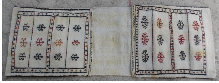
Görsel 8. Düz Dokuma Heybe Örneği, Akçadağ, Çoban Uşağı Köyü

Malatya yöresi heybe gözü denilen kısım ve ağ parça kenarları genellikle ince bir suyolu veya çengel motifleriyle çerçevelemiştir. Heybede bulunan sulara S kıvrımlı dal bağlantılı yaprak, dallar ve çiçek, bereket, küpe, sığır sidiği, göz, çarpı, geçmeli geometrik formda klasik dokuma yanırları sıklıkla yer alır. Malatya yöresinde atlarda kullanılmak üzere saraçlı heybe örnekleri de tespit edilmiştir. Atlı kültür olarak bilinen Türkler atlarına her zaman özel bir ihtimam ve hassasiyet göstermiştir (Acar:1982). Tarihte saraçlık zanaatı 20. yüzyıl son çeyreğine kadar hatta son çeyreği de dâhil çok önemli bir zanaat kolu olarak yerini her zaman korumuştur. Heybelerin sağlamlığını, kullanım heybenin ömrünü uzatmak, eskimesini geciktirmek, heybeleri daha kullanışlı ve dokumayı gösterişli hale getirmek için heybelerin kenarlarına deriden saraçlama uygulamaları yapılmıştır. Heybe saraçla uygulaması; heybe tabanı, heybe gözlerinin ağız kenarları, göz kapakları, dış kenarlar ve ağ parçası kenarlarının meşin-deri bantlarla kaplanması işlemi olarak adlandırılır. Heybelerde kullanılan deri bantlar sade veya süslü dikişlerle bezenerek sıkıca tutturulmuştur (Akalm: 1993).