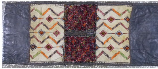
Görsel 10. Düz Dokuma Heybe Örneği, Arapgir, Serge Köyü