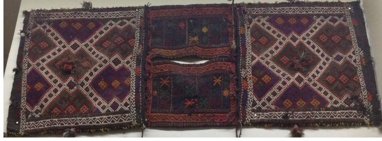
Görsel 14. Düz Dokuma Heybe Örneği, Yazıhan, Sinan Köyü, (Bozdağ Kişisel Arşiv)