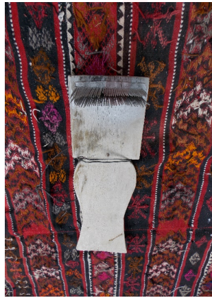
Görsel 2. Tarak

Kazılarda ele geçen dokuma parçaları ile tezgâh ağırlığı vb. buluntulara göre, "Anadolu'da dokumacılığın Neolitik devirde başladığı, Kalkolitik devirde fazla bir değişiklik görmeden Neolitik çağdaki geleneğini sürdürdüğü, İlk (Erken) Tunç devri ile beraber gelişimin hızlandığı kabul edilmektedir (Görgünay:1984). Özellikle Truva'da (Troia) bulunan ağırlıkların pişirilmemiş topraktan yapıldığı dikkat çekicidir. Dokumacılıkta yünün kullanılması ise 6000 yıllarına dayanmaktadır. Keten dokuma ise Tunç devrinden itibaren görülmektedir (Gönül:1956). M. Ö. II bin yıllardan itibaren dokumacılık iyice gelişmiştir. Yazılı belgelerden kumaşın nasıl dokunduğunu ve dokuma isimlerini öğrenmekteyiz. M. Ö. I. bin yıllarında ise dokumacılık hakkındaki bildiklerimiz çoğalmaktadır (Görgünay:1987). Bu dönemlerde genellikle yatay ve dikey tezgâhların kullanıldığı kabul edilmektedir (Acar: 1982).