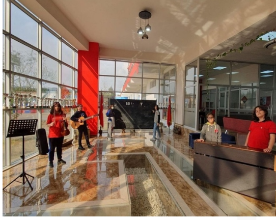
Görsel 1. 29 numaralı aileye ait 18 Mart okul müzik ekibi paylaşımı

29 numaralı aile, Malatya’da eğitim aldıkları öğretmenin paylaşımı için “Öğretmenimizle iletişimimizi hiç kesmemiştik. 18 Mart etkinliğinde piyano performansını paylaşarak, öğretmenimize “Emekleriniz boşuna gitmedi. Artık Türkiye’nin her bir köşesinde öğrencileriniz sizin eserleriniz olarak yetişecekler.” yazarak göndermişim. Öğretmenimiz de sosyal medya hesabında yeni okulumuzu etiketleyerek videodan bir kare ve o dokunaklı notuyla paylaştı. Yaşadıklarımızın en net özetidir aslında o not. Bütün hisleri aynı anda yaşıyoruz.” Olarak ifade etmektedir.