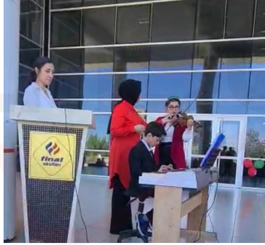
Görsel 3. 47 numaralı aileye ait 23 Nisan 2023 okul kutlamasından bir kare

47 numaralı aile Doğu algısı sebebiyle çocuklarının misafir öğrenci olarak nakil olduğu okulda piyano çalabildiğine inanılmamış olduğunu ve performans sergileyene kadar akran zorbalığına dahi maruz kalmış olduğunu şu sözlerle ifade etmektedir; “Oğlumuzu Malatya’da gönderdiğimiz okulun gittiğimiz ildeki şubesine nakil aldığımızda neredeyse bir ay okula alışamadı. Özellikle müzik dersinin olduğu bir gün sonu ağlamaklı halde çocuğu okuldan alınca, oğlum ne oldu diye sordum. Bana verdiği cevap “öğretmenim piyano çaldığıma inanmadı” oldu. Öğretmen ile daha sonra özel olarak okula giderek görüşme yaptım. Yaklaşık olarak bir senedir haftalık iki saat piyano dersi aldığımızı ve günlük 45 dakika gözetimimizde pratik yaptığımızdan söz ettim. Lütfen, müzik sınıfınızda piyanonuz var, oğlumu dinlemeyecekseniz bile teneffüslerde çalmasına müsaade edin dedim. Bir hafta sonrası okul müzik öğretmeninden telefon aldım. Oğlumun çok yetenekli olduğu ve senelerce eğitim alan, devam eden öğrencilerinden dahi iyi olduğu övgülerini aldım. Malatya’da böyle bir eğitim nasıl olabileceğini ve şaşkınlığını ifade etti. Ben de şaşırmanın birisi de artık sizin öğrenciniz dedim. Telefon sonrası müzik öğretmenimiz sık sık pratik yapmasına imkan tanıdı. Oğlum 23 Nisan programında sahne aldı, birçok eser çaldı ve öğretmenine bir eserde eşlik yaptı. Bu gururu kelimelere dökmem...” (Aile 47, Kişisel görüşme, 03.05.2023).