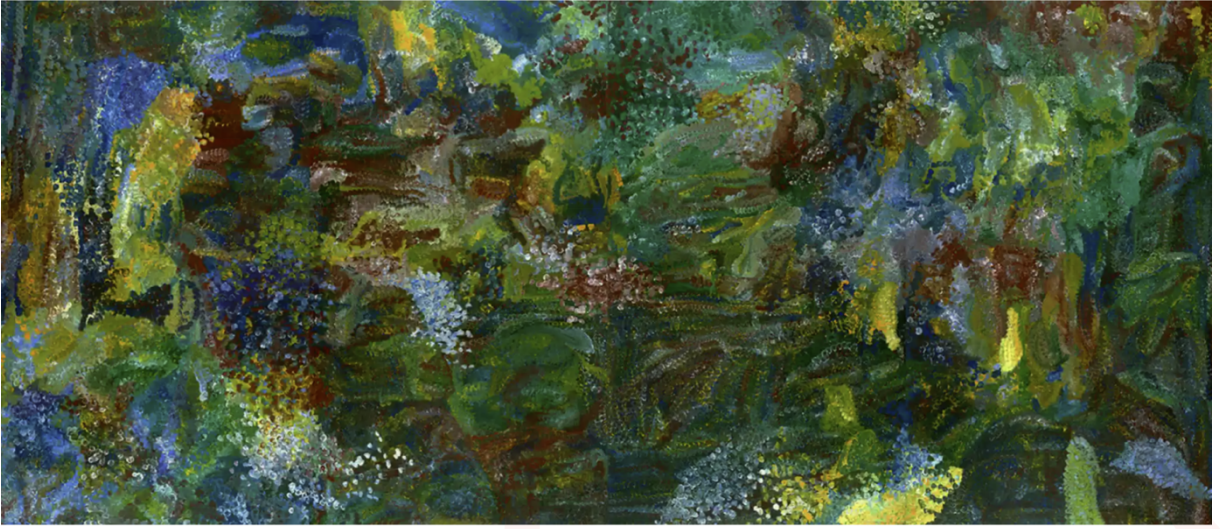
Resim 2. Emily Kame Kngwarreye, Earth's Creation (1994 (1995))