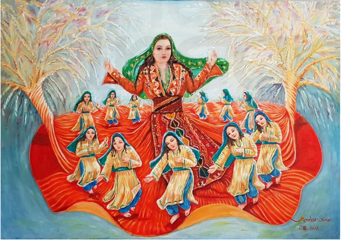
Resim 8. Saliha (Menekşe) Sümer, İnsana Semah , 2017, Tuval üzeri yağlı boya, 70 x 100 cm.

Menekşe Sümer'in "İnsana Semah" adlı tablosu, kompozisyon ve renk kullanımı açısından oldukça etkileyici ve anlamlı bir eserdir. 70x100 cm boyutlarındaki bu yağlıboya tablo, izleyiciyi adeta evrensel değerlerle bezenmiş bir dünyaya davet etmektedir. Kompozisyon açısından bakıldığında, tablonun merkezinde dev bir kadın figürü yer almaktadır. Bu figür, bir Ana Tanrıça temsilini andırmakta ve resmin odak noktasını oluşturmaktadır. Merkezi figürün etrafında, semah dönen daha küçük kadın figürleri bulunmaktadır. Bu düzenleme, izleyicinin gözünü önce merkezdeki ana figüre, sonra da dışa doğru genişleyen bir hareketle diğer figürlere yönlendirmektedir. Tablodaki figürlerin dizilimi dairesel bir form oluşturmakta, bu da semahın dönüş hareketini vurgulamaktadır. Bu dairesel kompozisyon, aynı zamanda evrenin döngüsellikini ve yaşamın devamlılığını simgelemektedir. Figürlerin boyut farklılıkları, resme derinlik katmakta ve bir hiyerarşi hissi uyandırmaktadır. Renk kullanımına baktığımızda Menekşe canlı ve kontrast renkleri tercih etmiştir. Arka planda flu tonlar kullanılırken, figürler daha parlak ve canlı renklerle resmedilmiştir. Bu kontrast, figürlerin ön plana çıkmasını sağlamakta ve resme dramatik bir etki katmaktadır.