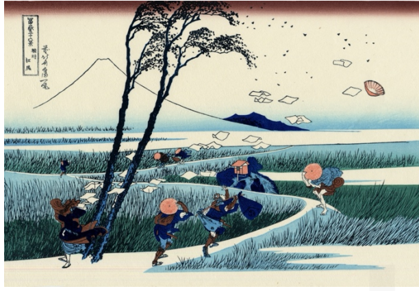
Resim 3. Katsushika Hokusai “36 Fuji Dağı Manzarası” Japon ukiyo-e Baskı Sanatı Örneği