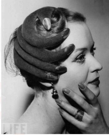
Görsel 5. Elsa Schiaparelli El Şapka

Schiaparelli, Dali'nin dudak şeklindeki koltuk tasarımından esinlenerek oluşturmuş olduğu bu tasarımında, ceketin bel hattının iki tarafına dudak şeklinde cep tasarlamıştır. Dudak yüzde değil beden üzerinde bel hizasında iki yana ait olmadıkları yere yerleştirilmiştir. Yüzün parçası olan dudak bel hizasına taşınarak hem bir yüz etkisi hem de birden fazla dudak görüntüsü ile yadsıma durumları oluşturularak dudak ile cep arasında kavramsal bir yer değiştirme yapılmıştır.