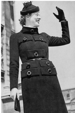
Görsel 7. Elsa Schiaparelli Sekiz Çekmece Cepli Manto

Schiaparelli bu tasarımında Dali'nin 'Çekmeceler Şehri' çalışmasında kullanmış olduğu çekmeceleri tasarlamış olduğu manto üzerinde kendine has üslubu ile kullanmıştır. Tasarımcı, günlük hayatta eşyaların saklanması için kullanılan dolap çekmecelerini, giysinin ceplerine dönüştürmüştür. Mobilya ve giysi arasında yer değiştirme yapılan bu çalışmada, günlük kullanım nesnesi olan dolap çekmeceleri, giysinin cepleri olarak sıra dışı bir mantoya ilham vermiştir.