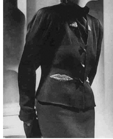
Görsel 6. Elsa Schiaparelli Dudak Cepli Ceket