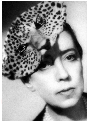
Görsel 10. Elsa Schiaparelli – Pars Şapka

Schiaparelli bu tasarımında parsın başının bir kısmını şapkaya dönüştürmüştür. Özellikle de gözlerini odak noktası yapmıştır. Burada parsın bakışları ile hem bir tedirginlik ve yadsıma durumları oluştururken hem de parsın gözleri ile şapka arasında bir yer değiştirme yapmıştır.