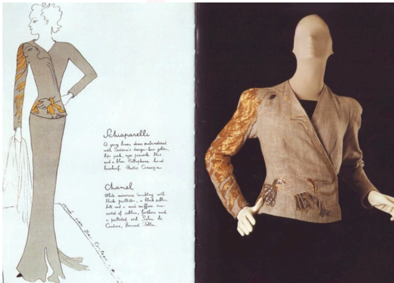
Görsel 15. Elsa Schiaparelli & Jean Cocteau – Saç İşlemeli Ceket

Tasarımcı, anvelop olarak tasarlanmış olduğu bu ceketin sağ bedeni üzerinde uzun saçlı bir kadın figürünü resmetmiştir. Figürün yüzü sağ omuzdan başlayıp bele kadar inen kol ve belde mendil tutan bir el ile sonlanmaktadır. Ceket üzerine işlenen figürün eli, kemer görünümündedir. Burada tasarımcı insan vücudunun bir parçası olan eli, günlük kullanım nesnesi olan kemer yerine kullanarak bir yanılsama oluşturmuştur. Aynı zamanda ceketin bir tarafında saçları giysinin kolundan aşağı doğru uzanan insan yüzünü yansıtmıştır. Vücudun parçaları olan el ve yüzü, ait olduğu yerden başka yerlerde kullanarak daha fazla yüz ve el görüntüsü oluşturmuştur.