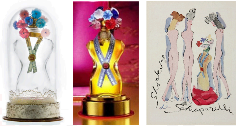
Görsel 9. Elsa Schiaparelli – Şok Edici Parfüm ve Eskiz Çizimi

İncelenen diğer çalışmalardan farklı olarak tasarımcı bu kez bir parfüm tasarlamıştır. Şişenin eskiz çizimlerinde kadın silüetlerinin de beraber resmedildiğini görmekteyiz. Bu tasarımında da insan vücudunu parfüm şişesinin yerine geçirek insan figürünü günlük kullanım nesnesi olan parfüm şişesine dönüştürmüştür. İnsan vücudu ile parfüm şişesi arasında yer değiştirme yapılmıştır.