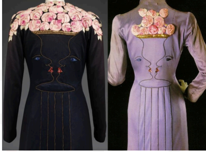
Görsel 11. Elsa Schiaparelli – İnsan Yüzlü – Vazo Elbise

Tasarımcı burada bilinçli olarak figür ve objeleri, başka bir figüre dönüştürerek görsel illüzyon etkisi oluşturmuştur. Günlük kullanım nesnesi olan vazo ve yaşayan varlık olan insan yüzünün silueti, asıl olması gereken yerden alınarak giysinin sırt kısmına yerleştirilmiştir. Burada tasarımcı hem bir illüzyon hem de günlük kullanım nesnesi olan vazo ile insan vücudunun işlevi ile oynamıştır.