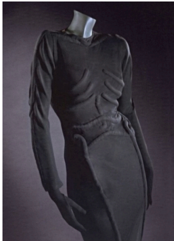
Görsel 12. Elsa Schiaparelli İskelet Elbise

İnsan vücudunun derinin altında kalan görünmeyen iskeleti, giysinin üzerinde ikinci bir ten(cilt) görünümündedir. Tasarımcı, vücudumuzu oluşturan derinin altında kalan görünmeyen iskelet silueti, kemik ve omurga çizgilerinden dikilerek içerisine pamuk doldurularak (kapitone tekniği) iskelet görüntüsü verilmiştir. İskelet, elbise üzerine taşınarak hem bir algı yanılsaması hem de iskelet ile elbise arasında bir yer değiştirme yapılmıştır.