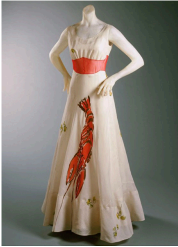
Görsel 3. Elsa Schiaparelli İstakoz Elbise

Schiaparelli bu tasarımında Dali'nin 'İstakoz Telefon' eserinde yer alan istakozu kendi tasarlamış olduğu elbisenin üzerinde kendi sanatsal anlayışını yansıtarak kullanmıştır. Dali'nin çizmiş olduğu büyük boyutlardaki bir istakozu elbisenin tam ortasına (vücutun ön kısmına) yerleştirmiş ve istakoz ile aynı tonlarda bir kumaş ile bel kısmında kemer oluşturarak istakozun etrafına yeşillikler serpiştirmiştir. İpekten fırfırlı bir elbise ile romantik bir görünüm verirken aynı zamanda da istakozun denizden sofraya yer değişimini yansıtmıştır. İpeğin yumuşak, zarif görüntüsü ile istakozun sert ve kaba görüntüsü ile de zıtlık oluşturulmuştur.