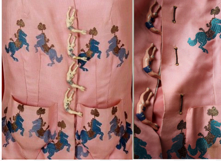
Görsel 14. Elsa Schiaparelli – Akrobat Düğmeler

Schiaparelli, 1938 Circus koleksiyonunun bir parçası olan pembe ceketin düğmelerinde sırte gösteri yapan insan silüetini kullanmıştır. İpe tutunmuş bir şekilde uzanan jimnastikçiler figürünü düğme olarak giysinin ön ortasına alt alta dört adet yerleştirmiştir. İnsan silüeti ile ceket düğmeleri arasında bir yer değiştirme yapılmıştır.