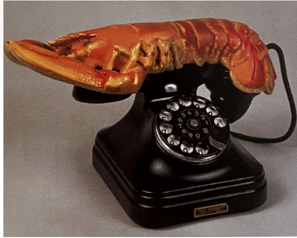
Görsel 4. Salvador Dali İstakoz Telefon