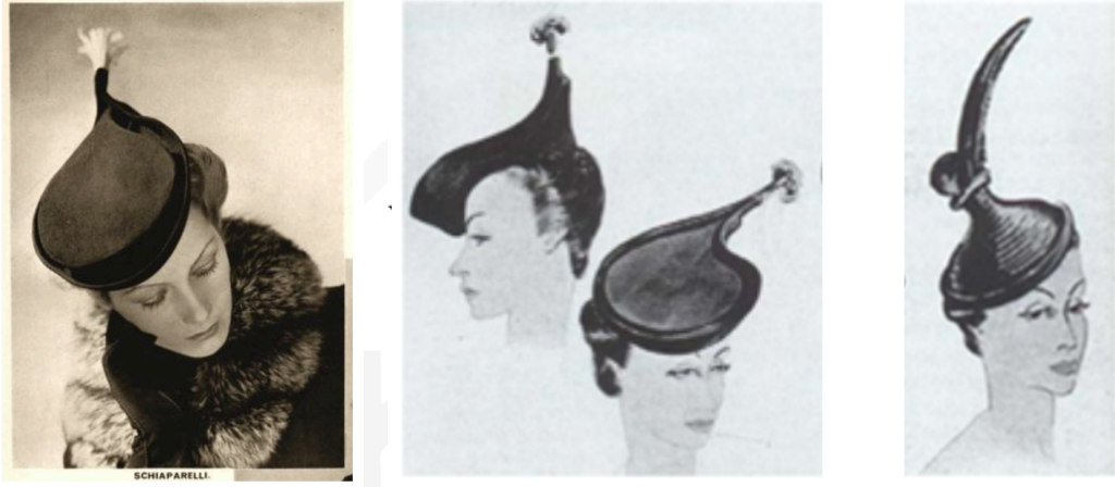
Görsel 2. Pirzola ve Mürekkep Hokkası Şapka

Yiyecek ile şapka ve mürekkep hokkası ile şapka arasında bir yer değiştirme yapılan bu tasarımlarda aynı zamanda da bir alaycılık söz konusudur.