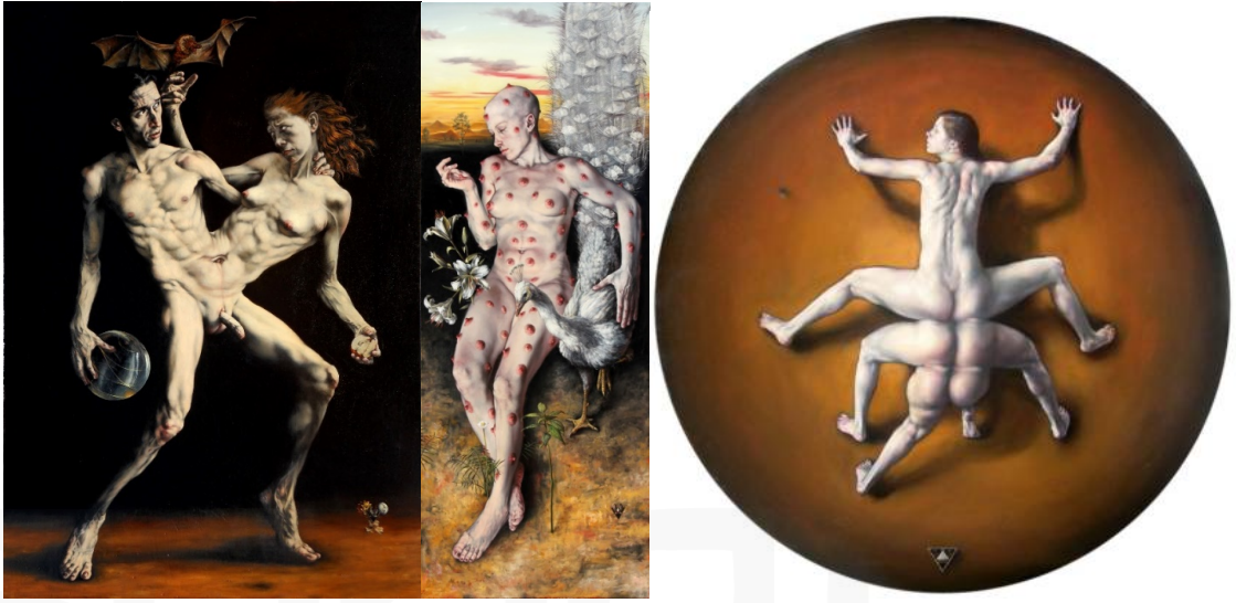
Görsel 3-4-5. Gabriel Grun, Hermaphrodite, 2012, Tuvale yağlıboya- Tacto, Tuvale yağlıboya, 2012 - La Pequena Aracne, Tuvale yağlıboya, 110x110 cm. 2012.

Grun'un resimlerinde bedenin imgesinin söylem olarak efsanelerdeki ve mitlerdeki özenli güzelliğin yıkılışını simgeleyen figürler mevcuttur. La Pequena Aracne adlı (Küçük Böcek) resminde bedenin dönüşümü ve fantastik öğeye dair imgenin yıkılışı görülür. Bu yıkılışı gerçekleştiren şey ise aslında doğrudan Grun'un stratejisidir. Grun klasik gerçekçi bir şekilde izleyiciye fantastik düşünce ürünü bir figürün ne kadar acı bir gerçekliği olabileceğini göstermektedir.