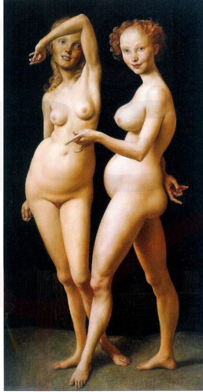
Görsel 2. John Currin, The old Fence, 1999, Tuvale Yağlıboya

Klasik güzellik kavramını ve kitle kültürünün beğenisini eleştiren bazı sanatçılar, klasik sanatların tekniklerini kullanma stratejisi izlemektedirler. Bu sanatçılardan birisi John Currin, kitle kültürünün beğenilerini ve klasik sanat anlayışının beğenilerini, beden imgeleri üzerinden, altüst edecek şekilde klasik resimler yapmaktadır.