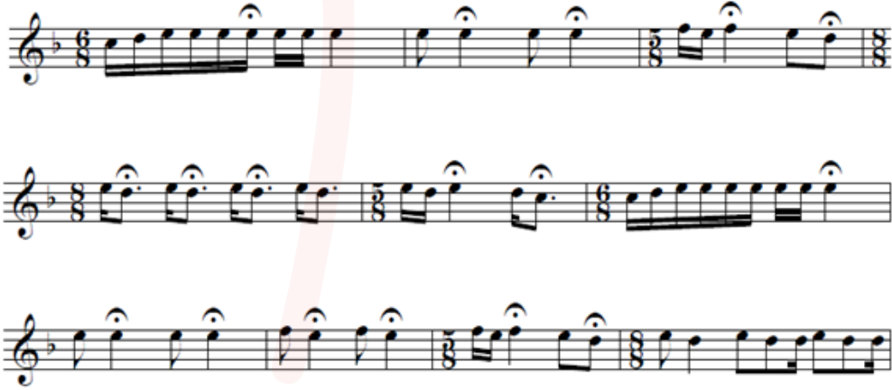
Nota 1. Bir Gün Şu Dünyadan Göçüp Gidersem , Arguvan Yöresi Uzun Hava Örneği (Atılğan ve Turhan 1999: 202)

Derleyen: Cemal Kaya Notaya Alan: Uğur Kaya