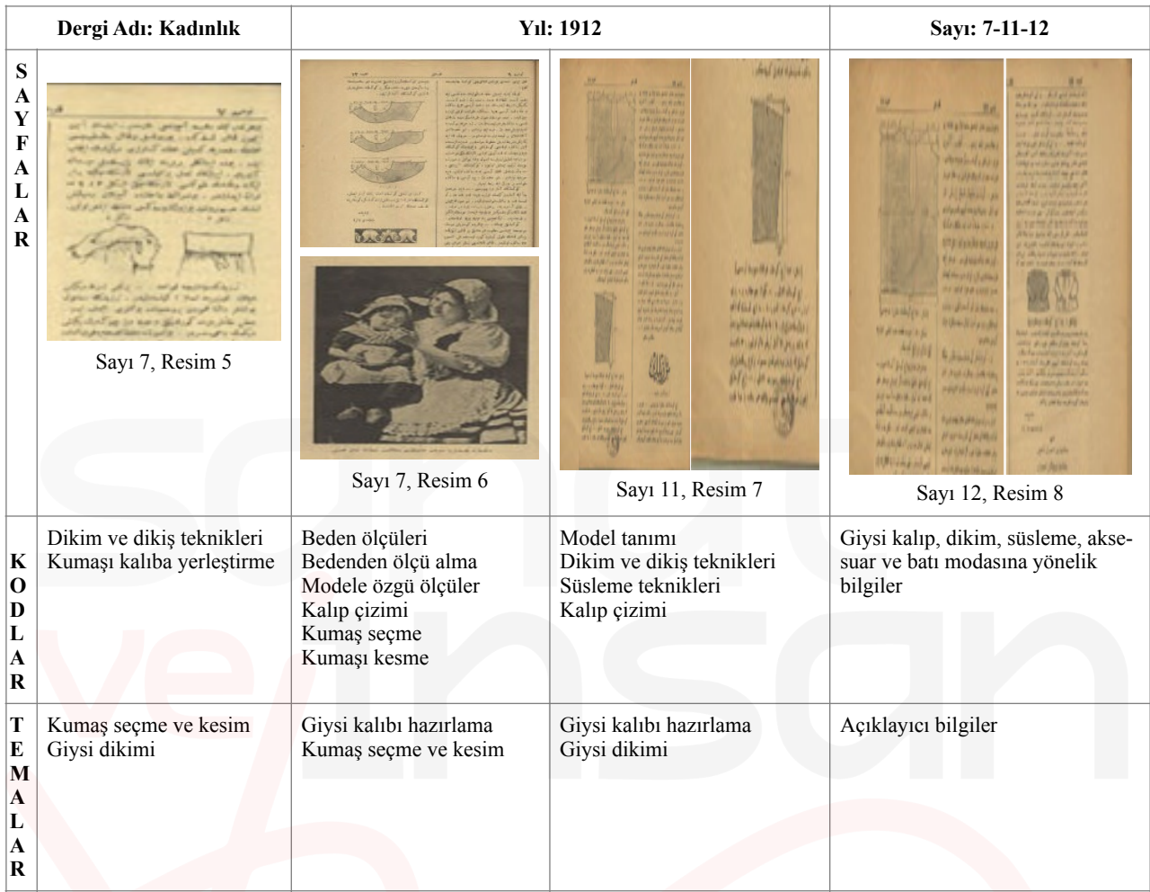
Tablo 3. Kadınlık Dergisi 1912 Yılı 7-11-12 Sayılarındaki Kalıp ve Dikim Teknikleri Tematik Kodlama Tablosu