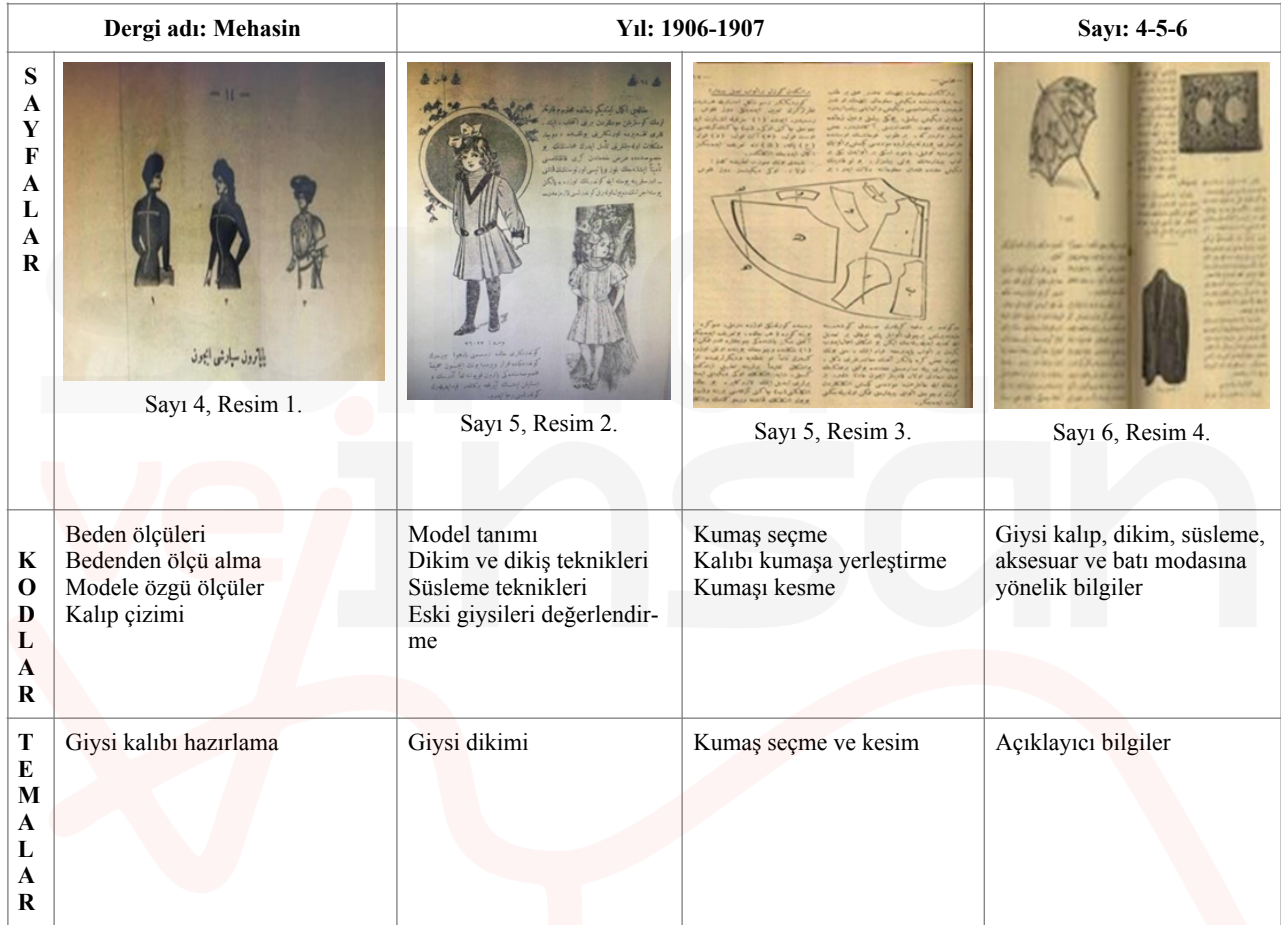
Tablo 2. Mehasin Dergisi 1906 -1907 Yılı 4-5-6 Sayılarındaki Kalıp ve Dikim Teknikleri Tematik Kodlama Tablosu

detaylı bilgilerle teşvik edici rol de üstlenmişlerdir. Bu bağlamda, araştırma kapsamındaki Mehasin ve Kadınlık dergilerinin içeriklerinde yer alan giysi üretimine dair kadınları yönlendirici sayfaların hangi bilgilere yer verdiği önem kazanmaktadır. Tematik kodlama tablolarında (Tablo 2,3) dergilerin Avrupai kadın giysilerinin üretimine yönelik sayfalardaki kodlar ve oluşturdukları temalar alan sistematığı çerçevesinde belirlenerek, dergilerin giyim tarzlarının değişimindeki etkisi yorumlanmıştır.