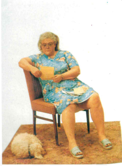
Görsel 1. Duane Hanson, Köpekli Kadın, karışık gereç, 1977, Whitney Museun, New York.

Görsel 1’de Duane Hanson’un “Köpekli Kadın” adlı çalışmasına bakıldığında bir fotoğraf mı yoksa bir resim mi olduğu hemen anlaşılır. Kadının kıyafetlerinden oturduğu sandalyeye ve yatmakta olan köpeğe kadar her şey sabırla işlenmiştir. Sanatçı fotoğrafın aslını verebilmek için ustalığını göstermiştir. Uzun ve sabırlı bir çaba gerektiren çalışmada sanatçı fotoğraftaki herhangi bir detaydan kaçma özgürlüğüne sahip değildir. Bu resimde sanatçı tarafsız, duygusuz ve objektif bir bakış açısıyla resmini tamamlamıştır. Bu yüzden bu resimde sanatçının bir yaratıcılığını görmek mümkün değildir.