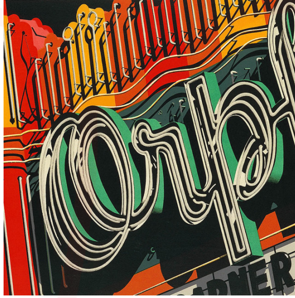
Görsel 4. Robert Cottingham, RET, tuval üzerine yağlıboya, 1972, orph lithograph

Chuck Close'nin "Linda" adlı çalışması bir portredir. Sanatçı, uygun bulduğu kişilerin büyük boy portrelerini yapmıştır. Sanatçı, diğer hiperrealist sanatçılarda olduğu gibi her detayı uzun bir uğraş sonrasında gerçekleştirmiştir. Bu portrede fotoğrafın diapositifini tuval üzerine yansıtıldığından sanatçı oran-orantı gibi sorunların çözülmesiyle uğraşmak zorunda kalmadığı için tüm çabasını renk karışımlarına ayırır.