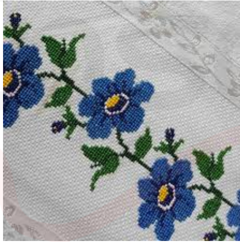
Görsel 8. Geleneksel Kaneviçe Örneği

Örneğin Nas ve Kandemir (2018, s. 438)'de, Kanaviçe geleneksel işlemlerimizin teknik özelliklerinin korunarak uygulanması ve teknolojiye uygun olarak günümüze kazandırılabilmesi için; öncelikle işlemlerin incelenerek teknik özelliklerinin belirlenmesi gerekmektedir. Teknolojinin gelişmesi nakış alanını da etkilemiş, geliştirilen bilgisayar destekli nakış makinelerinin kullanımı yoğunlaşmıştır. Böylece daha kısa zamanda, daha ucuza, daha az insan gücü ile üretim olası kılınmıştır. Ancak işlemlerin; ticari kaygılarla ve eğitimsiz bireylerce yapılması, sanatsal nitelik taşıyan geleneksel işlemlerimizin karakteristik özelliklerinin yok olmasına neden olduğunu aktarmıştır.