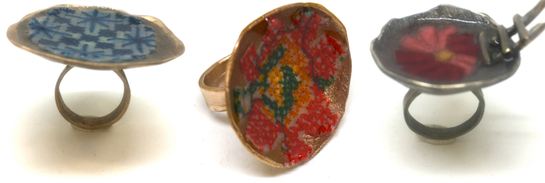
Görsel 15. Yüzükler, Bronz, Gümüş, Kanaviçe, Reçine, 2018

Günümüzde sınırların olmadığı ve farklı disiplinlerin bir arada kullanıldığı bir sanat anlayışının benimsendiğini söylemek mümkündür. Herhangi bir kültürel ya da geleneksel terim üzerine yapılacak yeni bir söylemde kullanılacak malzeme ve teknik önemli değildir. Önemli olan sanatçı tarafından oluşturulmuş yeni anlatıdır. Bellek Serisi de sanatsal bir çabanın ve eklektik bir yaklaşımın sonucu olarak ortaya çıkmıştır. Farklı disiplinlere ait kavramların bir arada kullanımı yeni bir sanat pratiği oluşturması ve sanatta alternatif dil oluşturması bakımından Bellek Serisi iyi örnekler arasında gösterilebilir.