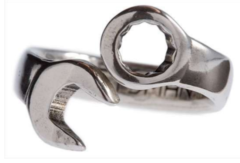
Görsel 5. Tisah Tucknott, Mekanik Takılar Serisinden