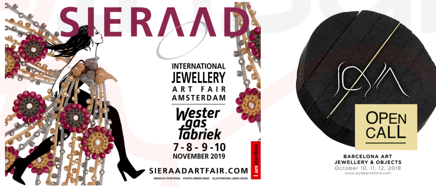
Görsel 7. Amsterdam ve Barselona’da Gerçekleştirilen Çağdaş Takı Fuarı Afişleri

Müze ve galerilerin yanı sıra takı sanatı alanında gerçekleştirilen en önemli etkinlikler takı sanatı fuarlarıdır. Bu fuarlar alışageldiğimiz, ticari metallerin ön planda olduğu fuarlardan farklı olarak malzeme, teknik, anlatım ve biçim sınırı olmaksızın tasarlanan takıların sergilendiği ve alıcısına ulaştırıldığı etkinliklerdir. Bu fuarlarda takılar izleyici ile buluşarak bedenle buluşabilir. Henüz ülkemizde gerçekleştirilemeyen ancak dünyaca iyi örneklerinin olduğu fuarlara, İspanya’da ‘JOYA Barcelona Art Jewellery Fair’, Hollanda’da ‘SIERAAD International Art Jewellery Fair’ örnek olarak verilebilir (Görsel 7).