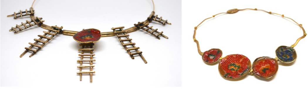
Görsel 12. Bronz, Metal Kili, Reçine, Kanaviçe, 2018