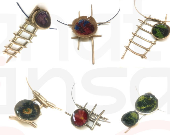
Görsel 13. Kolye uçları, Bronz, Gümüş, Çelik, Kanaviçe, Reçine, 2018