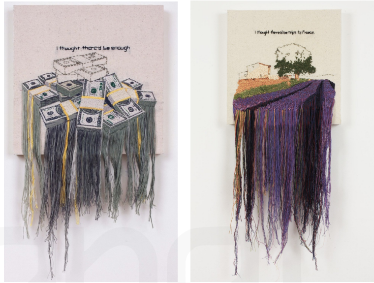
Görsel 11. Katy Halper'a Ait Çalışmalar