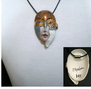
Görsel 4. Peggy Bjerkan, Porselen Kolye.