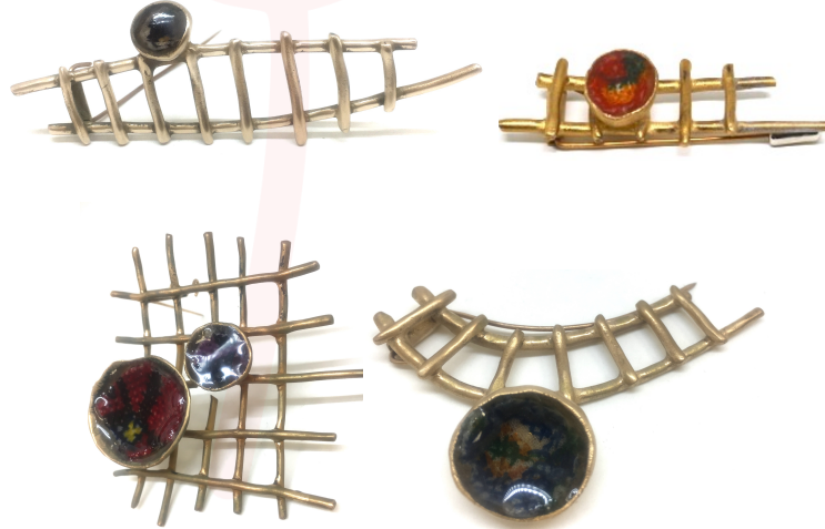
Görsel 14. Broşlar, Bronz, Gümüş, Çelik, Kanaviçe, Reçine, 2018