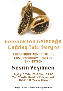
Görsel 6. Çağdaş Takı Sergilerinden Örnekler

Müze ve galerilerin yanı sıra takı sanatı alanında gerçekleştirilen en önemli etkinlikler takı sanatı fuarlarıdır. Bu fuarlar alışageldiğimiz, ticari metallerin ön planda olduğu fuarlardan farklı olarak malzeme, teknik, anlatım ve biçim sınırı olmaksızın tasarlanan takıların sergilendiği ve alıcısına ulaştırıldığı etkinliklerdir. Bu fuarlarda takılar izleyici ile buluşarak bedenle buluşabilir. Henüz ülkemizde gerçekleştirilemeyen ancak dünyaca iyi örneklerinin olduğu fuarlara, İspanya’da ‘JOYA Barcelona Art Jewellery Fair’, Hollanda’da ‘SIERAAD International Art Jewellery Fair’ örnek olarak verilebilir (Görsel 7).