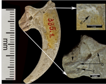
Görsel 1. Bulunan Kartal Pençesi

Yapılan son araştırmalar ve arkeolojik buluntuların ardından takının bilinen 70.000 yıllık tarihi yeniden güncellenmiştir. 2015 yılında araştırmacı, akademisyen Radovic tarafından Mısır'da yapılan araştırmalar ve kazılardan elde edilen verilerle takının 130.000 yıllık bir geçmişe sahip olduğu kanıtlanmıştır. (Radovic vd., 2015). Bulunan kartal pençelerinin insan eli ile şekillendirildiği ve parçaların belli bir düzende tasarımsal bir kaygı güdülerek birleştirildiği açıklanmıştır (Görsel 1). Mısır'da bulunan bu kartal pençeleri tarihin bilinen ilk takısı olarak literatürde yerini almıştır.