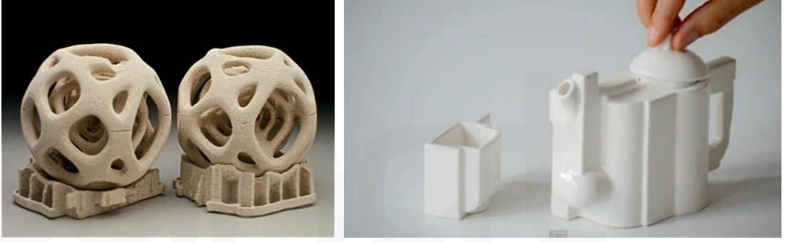
Görsel 1. 3 Boyutlu Seramik Baskı Örnekleri

sergiler için dekorları ve eğlenceyi kopyalamak için kullanılmaktadır. Seramik 3D baskı bugün ve gelecekte büyük potansiyele sahip malzemelerdendir. Kil ve seramik için 3 boyutlu yazıcıların bulunduğu uygulama ile sektörde 3 boyutlu prototipler, geniş bir şekilde kullanılmaktadır. 3B yazıcılar, 3B sanat ürünü yaratmak için naylon tozu, ABS plastik, polikarbonat, ahşap, alüminyum, seramik malzemeler, filament , reçine ve alçı tozu gibi malzemeler kullanırlar. 3D yazıcıları, bir sanat eseri haline getiren çok küçük ayrıntıları yazdırabilme özelliğinden ötürü bugün pek çok noktada kullanım açısından tercih edilmektedir (Görsel 1).