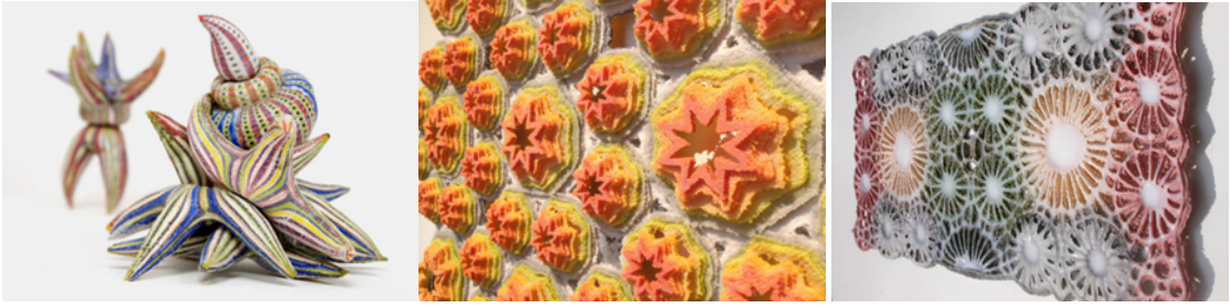
Görsel 8. Steve Brown, 'Taxonomy - After Haeckel I & II' 'Shifting Sands' (Detail) – 2012, 'Matrix' 2006

Bireyin sanat potansiyelinin oluşması, gelişmesi toplumsal açıdan önemlidir. Sanatın yaşamın merkezinde yer alması birey açısından, kendi sanatsal deneyimlerini derinleştirerek toplum üzerinde etik, siyasal, dinsel anlamda kendine ifade olanağı yaratması ve bulmasıdır. Gelişimi için yine sanattan, özellikle de seramikten etkin bir şekilde yararlanabilir.