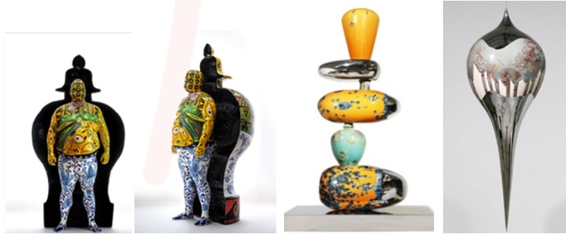
Görsel 6 ve 7. Roberto Lugo, Yo Soy Boricua: Bir DNA Çalışması , 2019, Li Hongwei, Allegory of Balance, Xuan- Porcelain and Stainless Steel

Uluslararası Seramik Bienalleri, Uluslararası çağdaş seramik festivalleri, kültürel mekânlardaki sergiler ve etkinliklerle, Çömlekçilik Müzeleri ve Sanat Galerileri, genellikle birlikte çalıştıkları sanatçıların çeşitliliğini vurgulayarak, görülecek ve keşfedilecek çok şeyin varlığını ortaya koymaktadırlar. Aynı zamanda yenilikçi ve yaratıcı yeni nesil sanatçılar, tasarımcılar ve yapımcıları da bir araya getirmektedir. Bu alanlarda meydana gelen etkinlikler ile kil malzemesini araştıran, keşfeden ve zevk veren çalışmalar sonucu seramiğin, çanakdan daha fazlası haline geldiği heykel, yerleştirme ve hatta resim dünyasına geçilen ortamların sağlandığı görülür (Görsel 6, Görsel 7).