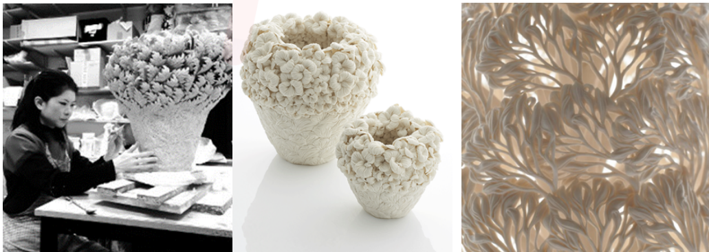
Görsel 12. Hitomi Hosono, Porselen Botanik Sanat Eserleri

Japonya'nın önde gelen kadın seramik sanatçılarından Hitomi Hosono, eserlerinde bitki esintili, detaylandırılmış çiçek parçalarından oluşan çok katmanlı, ince porselen formlar ortaya koyar. Hosono bu porselen eserlerini oluştururken, ilk referansını Josiah Wedgwood'dan aldığı tekniği kullanarak gerçekleştirir. Onun gibi ince seramik kabartmalar uygular veya bir parçaya yüzey dekorasyonu olarak dallar ekler (Görsel 12).