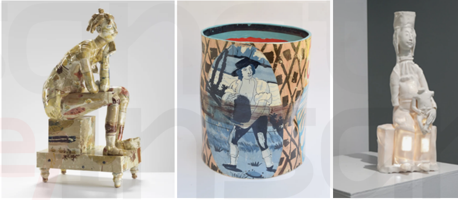
Görsel 3,4,5. Philip Eglin , Seated Nude, 2006 , Calais Lille 2019, Peekaboo Madonna and Child

Philip Eglin'in seramikleri de bu anlamda "yüksek kültür" ile "popüler kültür" ün mükemmel bir şekilde yan yana gelmesi olarak ifade bulmaktadır (Görsel 3, 4, 5). Sanatçının çalışmaları Post-modern estetik, popüler kültür ve seramik tarihinden yüksek sanata ve Gotik Madonna'lardan 1950'lerin Soyut Dışavurumcu ressamlarına kadar birçok kaynağa dayanır. Heykellerinde genellikle kola şişeleri veya atık plastikler gibi günlük nesnelere kalıp alınmış parçalar ve grafiti öğeleri bulunur (The Scottish Galery). Çalışmalarındaki post-post-punk heyecanı taşıyan metinler ve desenlerle kaplanmış tarihsel imgelerle belirli bir anlatı bulunması, daha parlak bir bakış açısı ile yeni bir teatrallik ve artırılmış arzu edilebilirlik kazandırmış olabilir (Roberts, S., 2017. 07. 24)