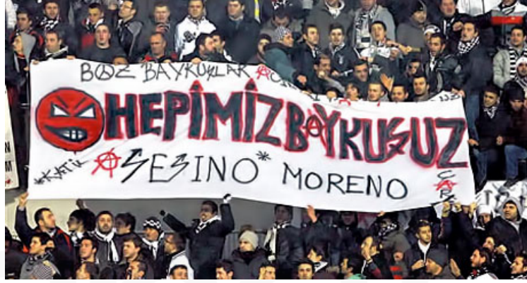
Görsel 10. BOZ BAYKUŞLAR ACINIZI PAYLAŞIYORUZ “Hepimiz Baykuşuz”, Beşiktaş-Trabzon Müsabakası, Yatay Pankart, 2011.