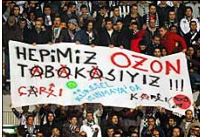
Görsel 8. “HEPİMİZ OZON TABAKASIYIZ !!! ÇARŞI KÜRESEL ISINMAYA'DA KARŞI”, Beşiktaş-Denizlispor Müsabakası, Yatay Pankart, 2017.