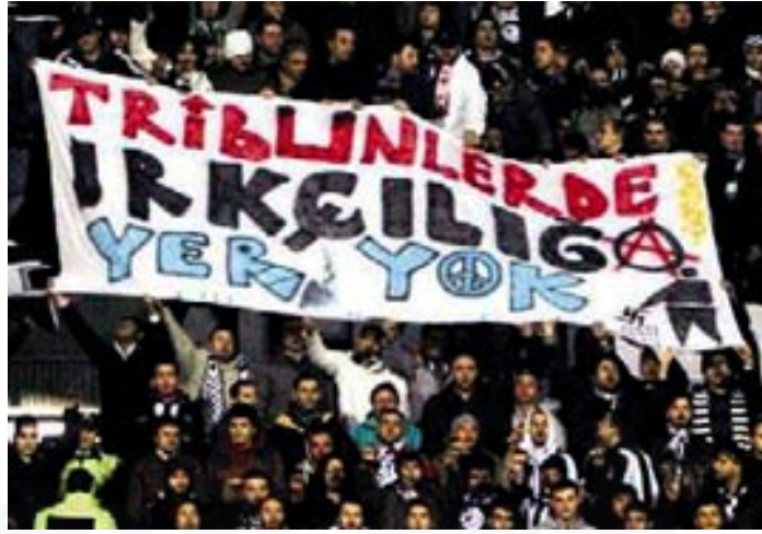
Görsel 6. “TRİBÜNLERDE İRKÇİLİĞA YER YOK” Beşiktaş – Antalyaspor Müsabakası, Yatay Pankart, 2009.