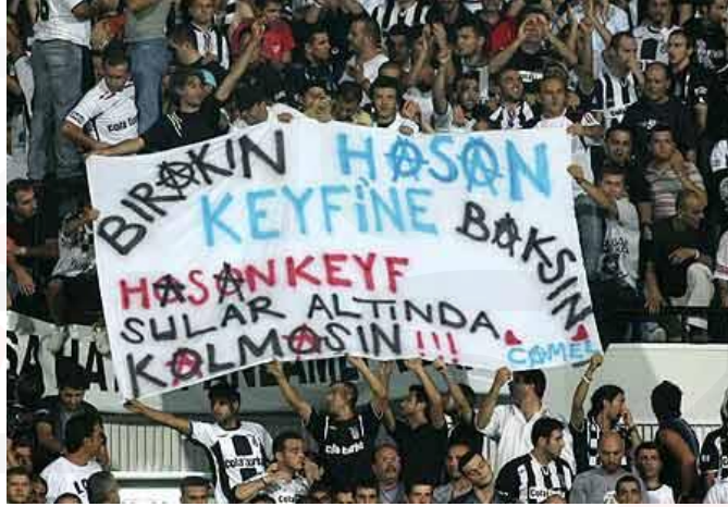
Görsel 9. “BIRAKIN HASAN KEYFINE BAKSIN, HASANKEYF SULAR ALTINDA KALMASIN !!!, Beşiktaş- Zürih Müsabakası, Yatay Pankart, 2007.

Alt metinde bulunan “ÇARŞI KÜRESEL ISINMAYA'DA KARŞI” sloganı her şeye karşı olan Çarşı grubunun bu duruma da karşı olduğunu ifade etmektedir. Fakat Çarşı, “KÜRESEL ISINMAYA'DA” kelimelerinin farklı renk ve yüzeye farklı konumlandırılması alt metnin bütünlüğünü bozarak okuma güçlüğüne yol açmıştır.