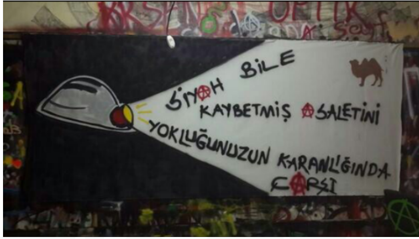
Görsel 4. “SİYAH BİLE KAYBETMİŞ ASALETİNİ YOKLUĞUNUZUN KARANLIĞINDA”, Beşiktaş-Gençlerbirliği Müsabakası, Yatay Pankart, 2014.

Pankart siyah ve beyaz renklerin hâkim olduğu yatay bir düzlem üzerine kurulmuştur. Karanlık ve aydınlığı, gece ve gündüzü, yer altını ve yerin üstünü simgelemek amacıyla siyah ve beyaz renkler kullanılmıştır. Bu simgeleme Beşiktaş Jimnastik Kulübünün kurumsal amblemindeki siyah ve beyaz ile aynı anlamları taşıması, Çarşı grubunun geçmişini unutmadığını ve bugün hala etkisinin varlığını da bizlere göstermiştir. Bu renklerin sağlı ve sollu yer alması ile görselde denge sağlanmak amaçlanmıştır.