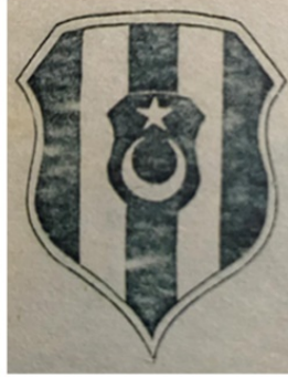
Görsel 1. Eski Amblem- Vektörel Amblem

Özellikle Beşiktaş Jimnastik Kulübünün Kurumsal kimliğinde de yer alan ambleminde kültürüne ait sosyal sorumluluk bilinci görülmektedir. Günümüzde de kullanılan armaya çok benzemekte olan ilk arma çubuklarının üçü kırmızı, ikisi beyaz çizgilerden oluşmaktadır. Armanın ortasında yukarıya doğru bakan ay ve yıldız yer alırken ilk armada kulübün ismi ve tarihi yer almamaktadır. Ancak I. Balkan Savaşı'nın (1913) kaybedilmesi ve vermiş olduğumuz şehitlerden dolayı üçü kırmızı olan çubuklar siyah renge dönüştürülerek matem ilan edilmiştir (Ebcim, 2010).