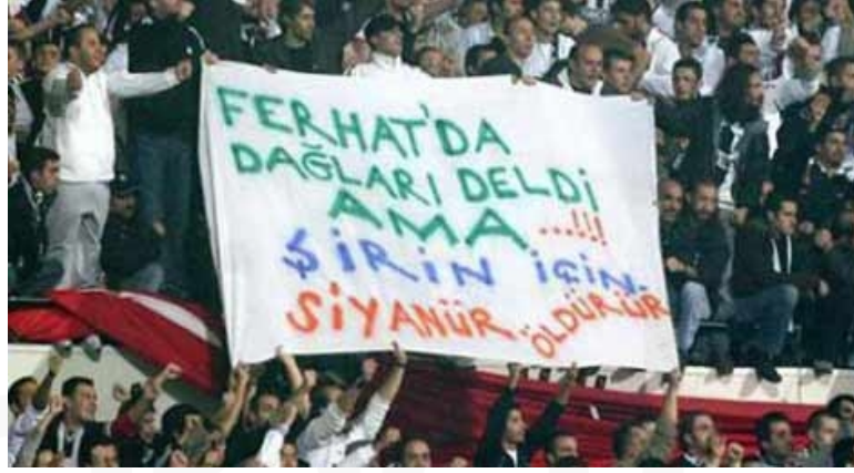
Görsel 11. “FERHAT’DA DAĞLARI DELDİ AMA ŞİRİN İÇİN!!! SİYANÜR ÖLDÜRÜR”, Beşiktaş-Trabzonspor Müsabakası, Yatay Pankart, 2011.

sıkıştırılmış bir şekilde konumlandırılan amblem deforme edilerek yan yana olması gereken harflerin alt alta yazılması da marka bütünlüğüne zarar vermektedir.