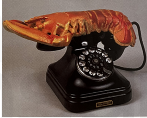
Görsel 7. İstakoz Görünümlü Telefon-Salvador Dali

Tasarım, Dali'nin 'Lobster Telephone'-'İstakoz Görünümlü Telefon' eserinde olduğu gibi büyük boyutlardaki bir istakoz, günlük yaşantıda alışılmış olanın dışında kullanımı ile şaşırtan, özellikle yapıldığı dönemi düşünüldüğünde, giyside yadsıyıcı bir izlenim vermektedir.