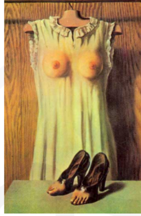
Görsel 14. Yatak Odasında Felsefe-Rene Magritte

İnsan vücudunun derinin altında kalan görünmeyen iskeleti, giysinin üzerinde ikinci bir ten (cilt) görünümündedir. Vücudumuzu oluşturan derinin altında kalan görünmeyen iskelet silüeti, kemik ve omurga çizgilerinden dikilerek içerisine pamuk doldurularak (kapitone tekniği) iskelet görüntüsü verilmiştir.