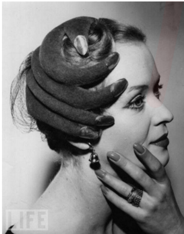
Görsel 8. El Görünümlü Şapka Elsa Schiaparelli