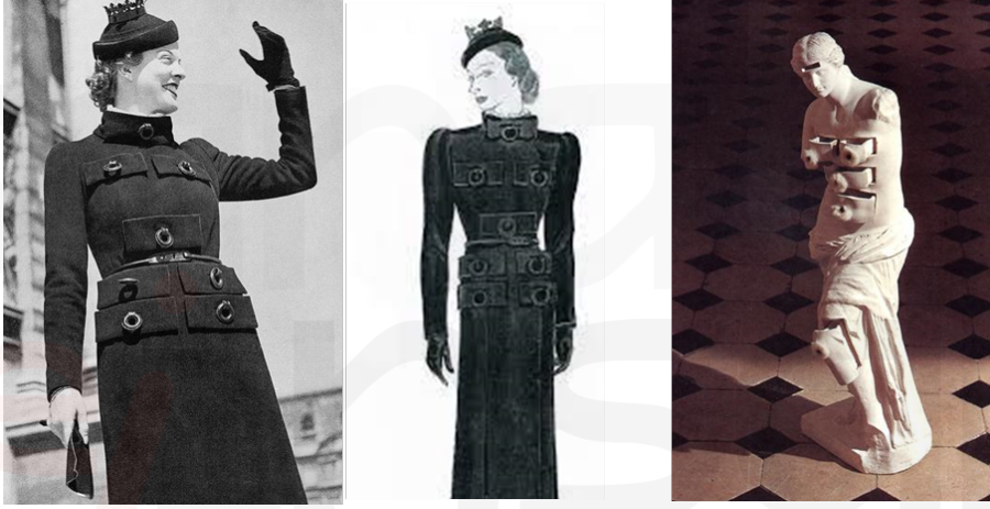
Görsel 10. Çekmece Cepli Tasarım ve Eskiz Çizimi Elsa Schiaparelli