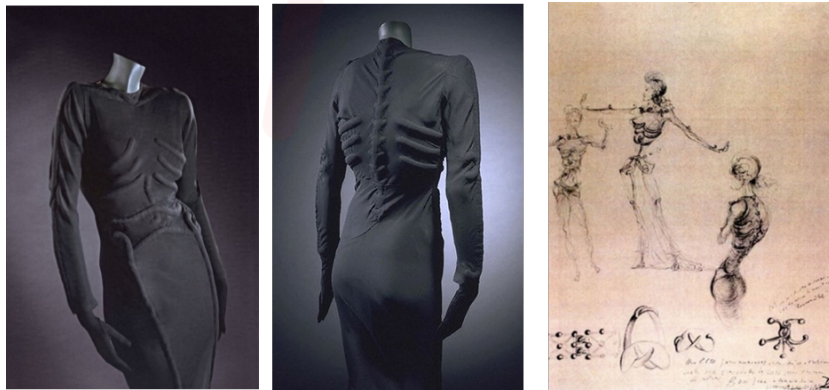
Görsel 12. İskelet Görünümlü Elbise Elsa Schiaparelli