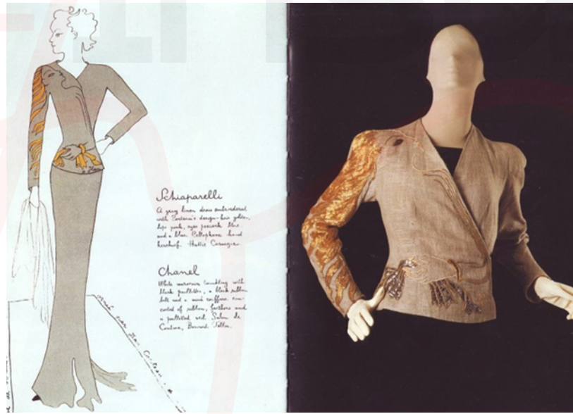
Görsel 17. Altın Saç İşlemeli Ceket Elsa Schiaparelli & Jean Cocteau

Tasarımcı, anvelop olarak tasarlamış olduğu, parlak işlemeli bu ceketin sağ bedeni üzerinde uzun saçlı bir kadın figürünü resmetmiştir. Figürün yüzü sağ omuzdan başlayıp omuzdan aşağı, kola doğru sarkan saç ve belde mendil tutan bir el ile sonlanmaktadır. Ceket üzerine işlenen figürün eli, kemer görünümündedir. Burada tasarımcı insan vücudunun bir parçası olan eli, günlük kullanım nesnesi olan kemer yerine kullanarak bir yanılsama oluşturmuştur. Aynı zamanda ceketin bir tarafında saçları giysinin kolundan aşağı doğru uzanan insan yüzünü yansıtmıştır. Vücudun parçaları olan el ve yüzü, ait olduğu yerden başka yerlerde kullanarak daha fazla yüz ve el görüntüsü oluşturarak görsel yanılsama elde etmiştir. Papalas (2015) çalışmasında, yaka üzerindeki işlemeli kolun, figürün iki gerçek koluna ek olarak üçüncü bir kol haline geldiğini ve hassas profili ile ceketin omzundan ve kolundan aşağıya uzanan saçları ile modelin gerçek olana yakınlığını, gerçek olmayan ve gerçeklik arasında bir gerilim sunduğunu belirtmektedir.