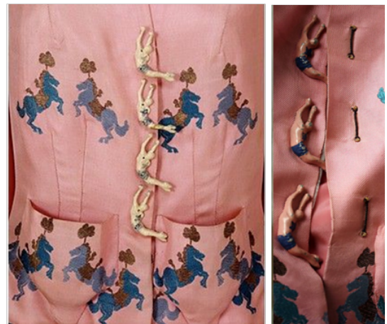
Görsel 16. Akrobat Düğmeler