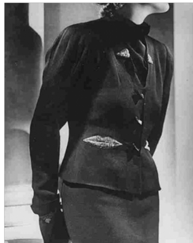
Görsel 9. Cepleri Dudak Görünümlü Ceket Elsa Schiaparelli