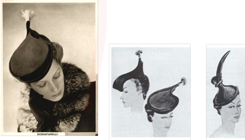
Görsel 5. Pirzola ve Mürekkep Hokkası Görünümlü Şapka-Elsa Schiaparelli

Schiaparelli, ayakkabı şapkada olduğu gibi bu tasarımlarında da günlük kullanım nesnesi olan mürekkep hokkası ve insanın günlük yaşamında açlık gereksinimini karşılayan bir yiyeceği şapkaya dönüştürmüştür. Mürekkep hokkası ve pirzola kendi doğal çevresinden çıkarılarak gerçeğe ters düşen şaşırtıcı, düşsel bir biçimde yansıtılmıştır. Yiyecek ile