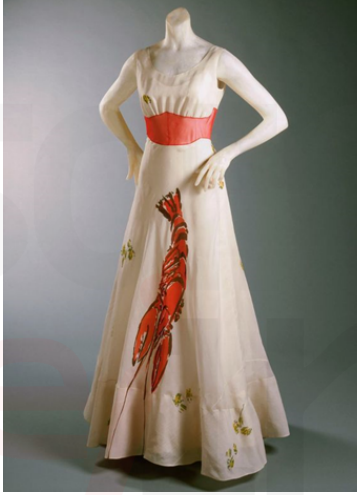
Görsel 6. İstakoz Elbise-Elsa Schiaparelli