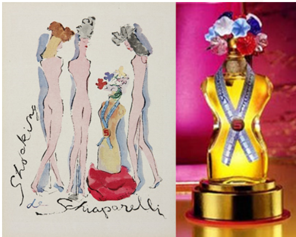
Görsel 15. Şok Edici Parfüm ve Eski Çizimi